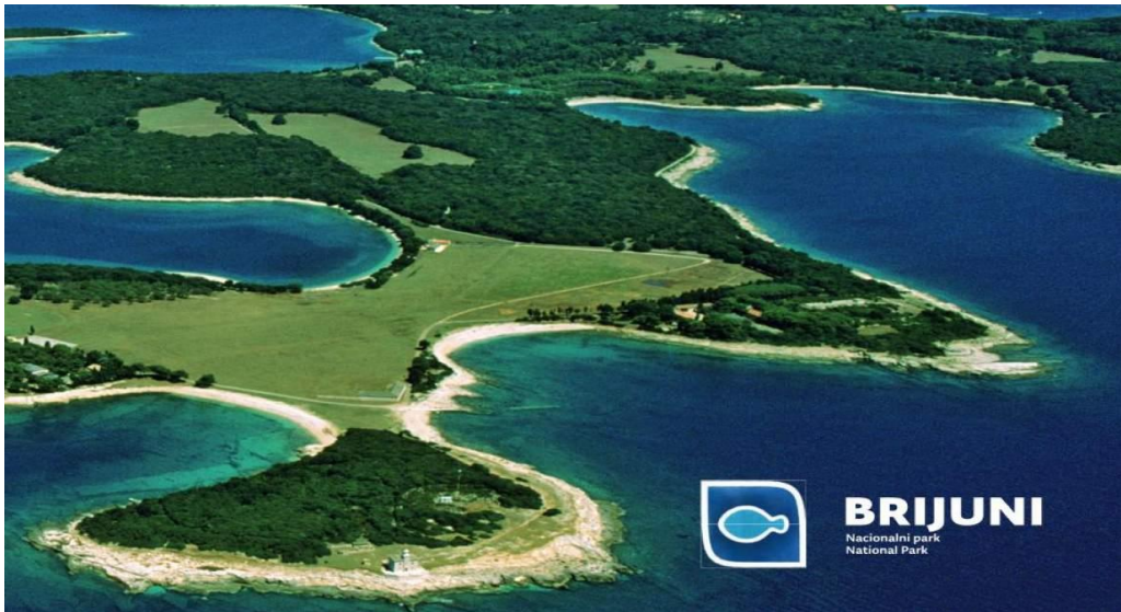
Slika 2. Prikaz Nacionalnog parka Brijuna