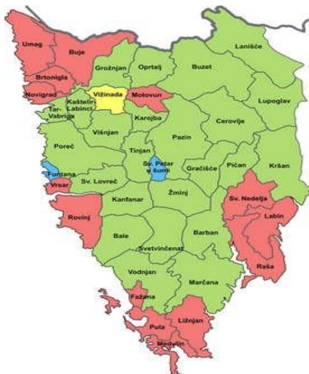
Slika 1. Kartografski prikaz gradova i općina Istarske županije

Istarska županija je administrativno teritorijalna jedinica koja se nalazi u zapadnoj Hrvatskoj. Sjedište županije nalazi se u gradu Pazinu. Županija obuhvaća prostorno najveći dio poluotoka Istre, a čine ju deset gradova i trideset jedna općina. Gradovi u Istarskoj županiji su Buje, Buzet, Labin, Novigrad, Pazin, Poreč, Pula, Rovinj, Umag i Vodnjan. Bale, Barban, Brtonigla, Cerovlje, Fažana, Funtana, Gračišće, Grožnjan, Kanfanar, Karojba, Kaštelir-Labinci - Castellier-Santa Domenica, Kršan, Lanišće, Ližnjan, Lupoglav, Marčana, Medulin, Motovun, Oprtalj, Pićan, Raša, Sveti Lovreč, Sveta Nedelja, Sveti Petar u Šumi, Svetvinčenat, Tar, Tinjan, Višnjan, Vižinada, Vrsar i Žminj općine su Istarske županije (Sl. 1). 9