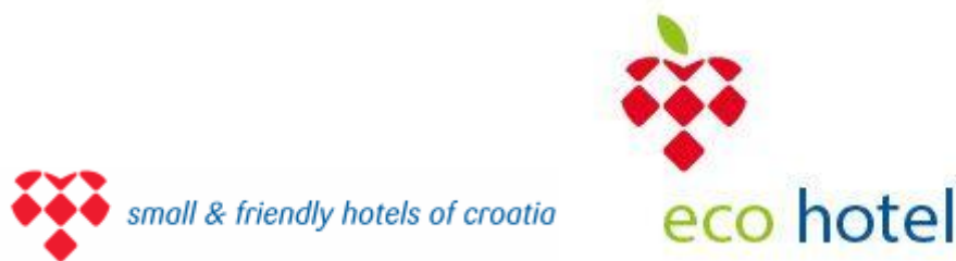
Slika 3. Logo Nacionalne Udruge malih i obiteljskih hotela