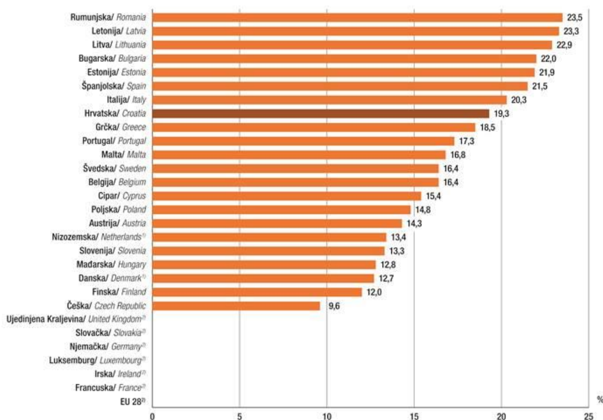
G-3. STOPA RIZIKA OD SIROMAŠTVA, USPOREDBA ZEMALJA EUROPSKE UNIJE I REPUBLIKE HRVATSKE U 2018. AT-RISK-OF-POVERTY RATE, COMPARISON BETWEEN EU COUNTRIES AND REPUBLIC OF CROATIA, 2018