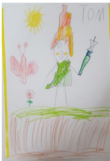
Prilog 1. Dječji (radovi) prikazi zgrade vrtića i stereotipni prikaz vile