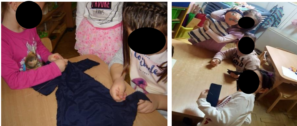
Prilog 4. Djeca šiju i izrađuju lutke