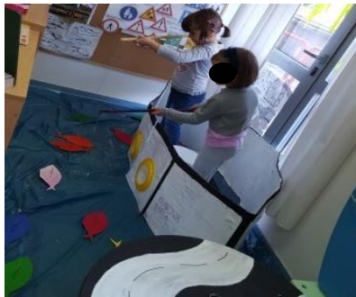
Prilog 6. Manipuliranje lutkama u kazalištu sjena, izrada scenografije i rekvizita