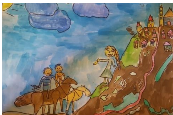
Prilog 9. Gotove ilustracije