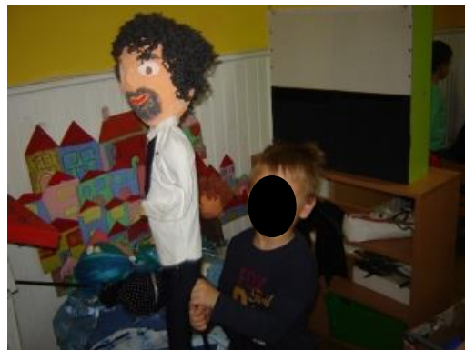
Prilog 5. Animacija lutki u dramskom centru