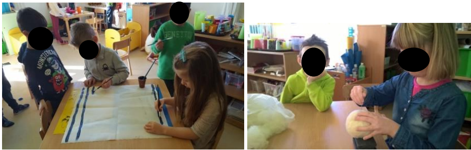
Prilog 3. Bojanje tkanina, kaširanje i filcanje kao jedan od koraka pri izradi lutaka