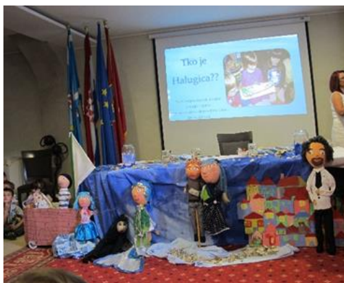
Prilog 11. Svečana promocija slikovnice Halugica

Svečana promocija slikovnice održana je u Gradskoj vijećnici Grada Kastva na kojoj su prisustvovala i sudjelovala djeca dviju odgojno-obrazovnih skupina, autori slikovnice. Odgajateljice su kolažom videozapisa prikazale sve faze razvoja projekta Halugica uključujući izradu svih vrsti lutaka koje su sudjelovale u projektu, njihovu animaciju, dodatne efekte i kulise koje su izradila i stvarala djeca. Videozapis su snimale odgajateljice u nekoliko etapa, a sve su prizore animirala djeca.