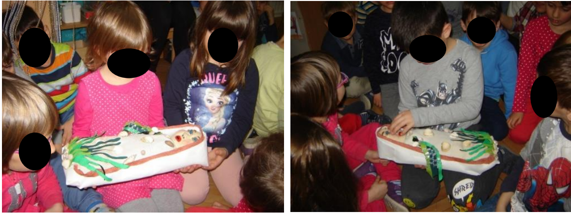
Prilog 2. Lutka bebe Halugice koja započinje priču