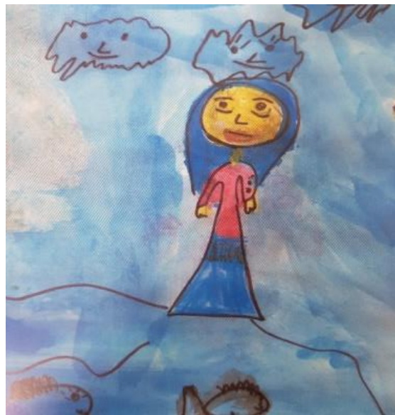
Prilog 8. Skice za ilustraciju, Halugica prije i poslije