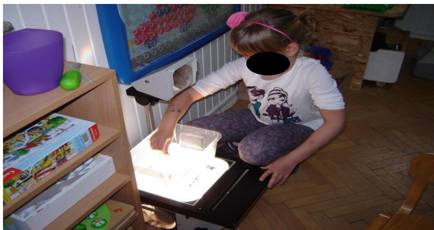
Prilog 7. Stvaranje efekata rastresitim materijalima