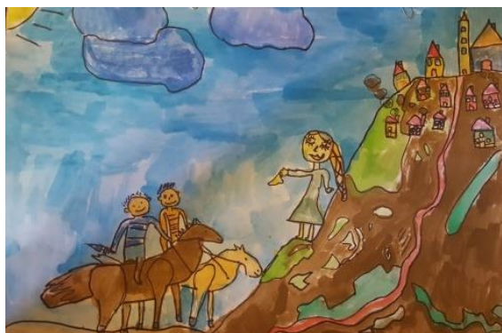
Prilog 9. Gotove ilustracije