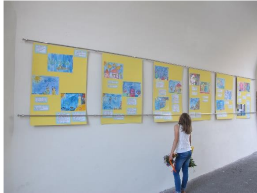
Prilog 12. Izložba u centru Grada Kastva

Sve ilustracije koje su pratile slikovnicu bile su izložene u centru Grada Kastva prilikom trajanja središnje kastavske kulturne manifestacije pod nazivom Kastafsko kulturno leto 2017. godine . Ilustracije slikovnice izložene su u knjižnici Grada Kastva zajedno s pratećim lutkama i kulisama.