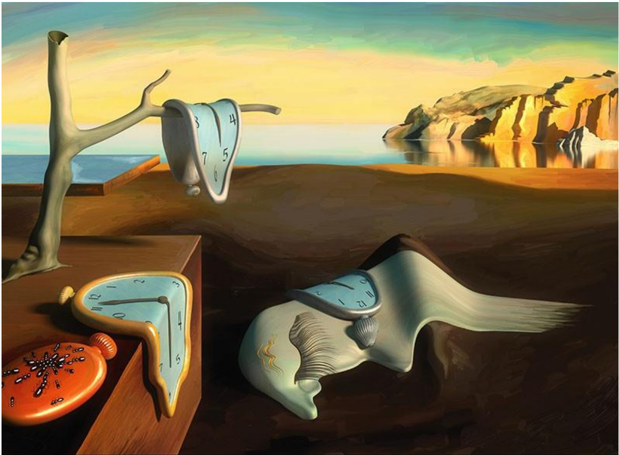
Slika 16. Postojanost pamćenje. Ulje na platnu, 1931.

( https://www.reproduction-gallery.com/catalogue/uploads/1522662218_large-image_dali-persistence-of-memory-lq.jpg?is_thumbnail=yes , 10.08.2020.)