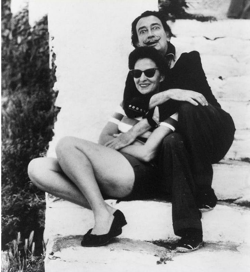
Slika 8. Gala i Dali