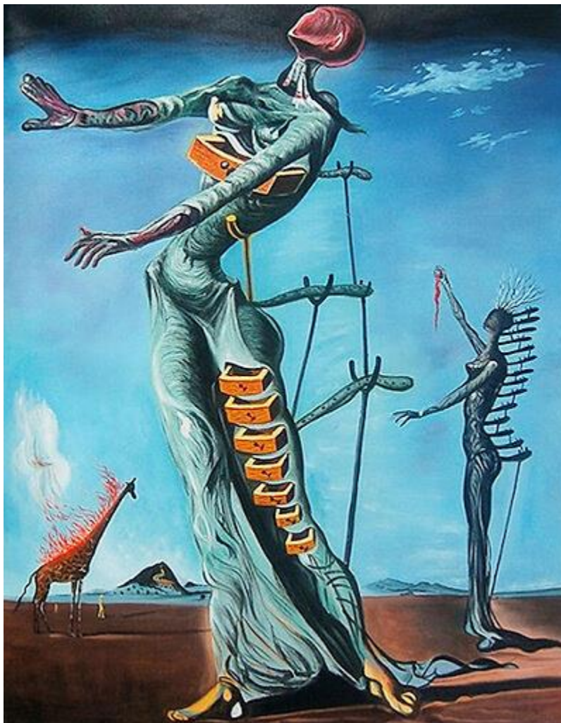
Slika 15. Goruća žirafa. Ulje na drvu, 1937.

( https://musartboutique.com/wp-content/uploads/2018/01/The-Burning-Giraffe-Salvador-Dali.jpg .03.08.2020.)