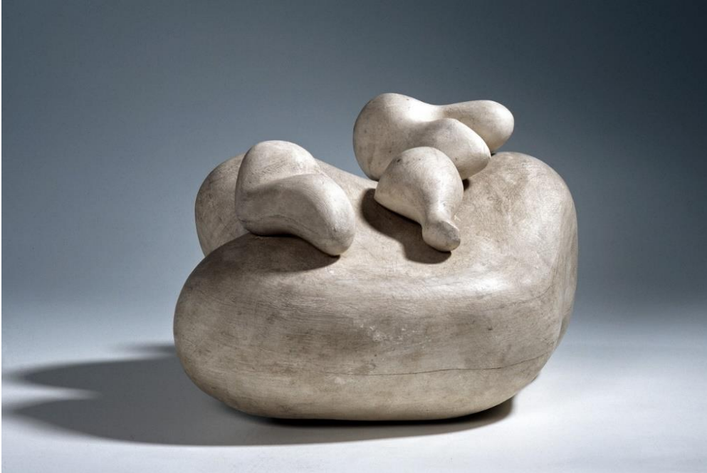
Slika 1. Glava s tri dosadna objekta. Bronca, 1930. (lijevano 1950.)

Veliki pomak u skulpturi dogodio se početkom tridesetih godina, jer se Arp posvetio glinenim i gipsanim modelima, a kasnije brončanim ili mramornim skulpturama. Važno je istaknuti da je utjecao na poznate kipare, kao što su bili: Henry Moore, Barbara Hepworth i Alexander Calder. (Arnason, 2009.)