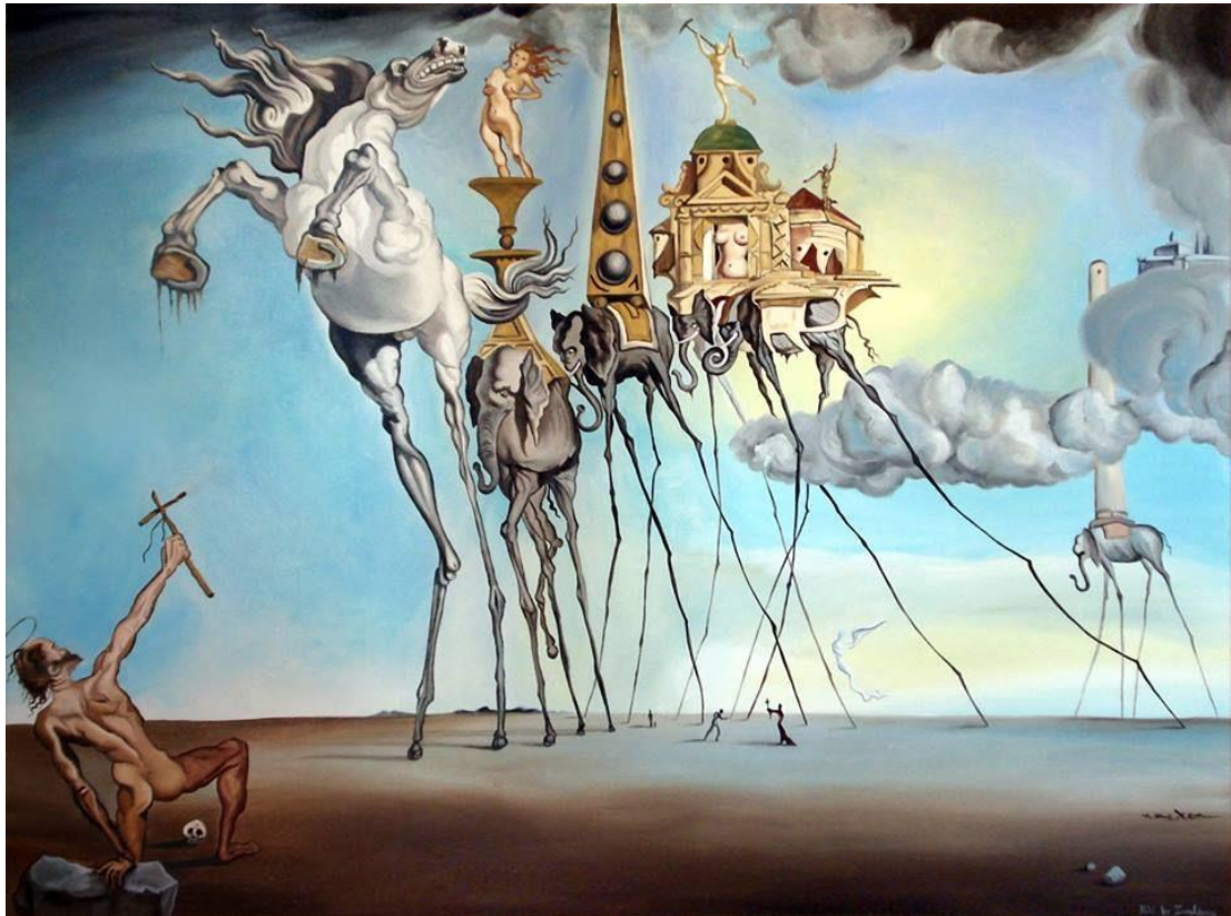
Slika 12. Iskušenje Sv. Antuna. Ulje na platnu, 1946.