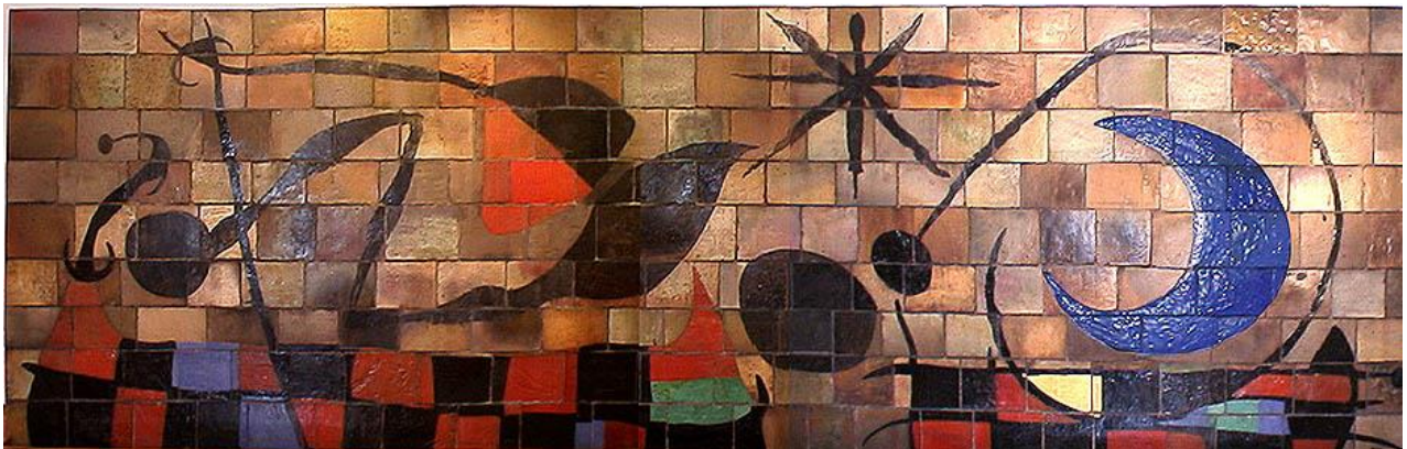
Slika 3. Zid Mjeseca. Freska, 1955. - 1958.

Joan Miro početkom 1930-ih zanimao se za različite oblike umjetničkog rada. To ga je na kraju dovelo do izrade nadrealističkih skulptura. U to vrijeme bio je sklon eksperimentiranju s različitim oblicima umjetnosti i raznim tehnikama. Neke od njih uključuju: graviranje, akvarel i pastele. Iz tog razdoblja poznata njegova djela su dvije freske koje se nalaze u Parizu na zgradi UNESCO-a pod nazivom "Zid Sunca" i "Zid Mjeseca" ( https://www.wikiart.org/en/joan-miro , 22.06.2020.)