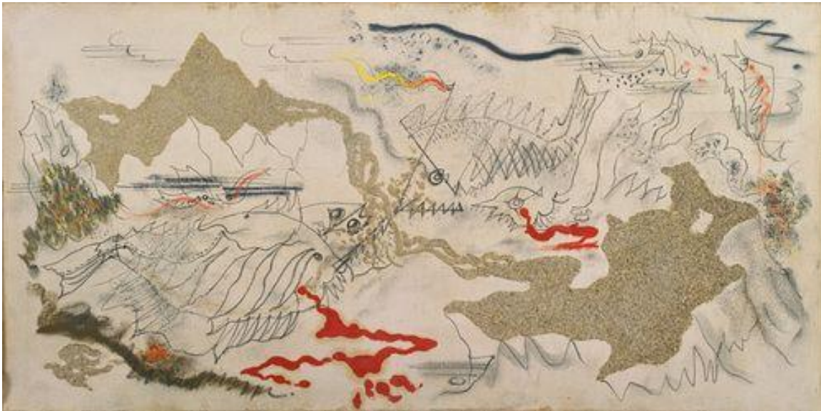
Slika 5. Bitka riba. Olovka, uljane boje, pijesak. 1926.

Primjer jedne od takvih slika je "Bitka riba" koja je nastala 1926. godine.