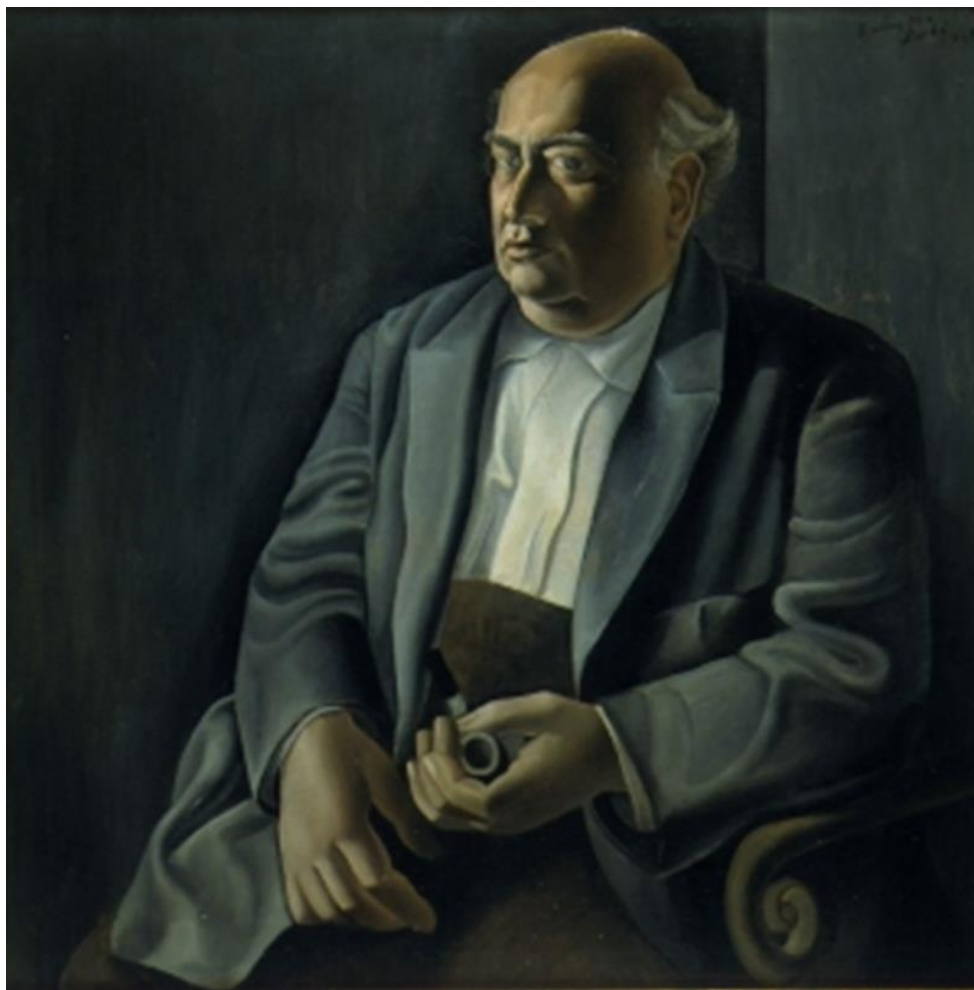
Slika 7. Portret mog oca. Ulje na platnu, 1925.

( https://upload.wikimedia.org/wikipedia/en/b/ba/Portrait_of_My_Father.jpg , 10.09.2020.)