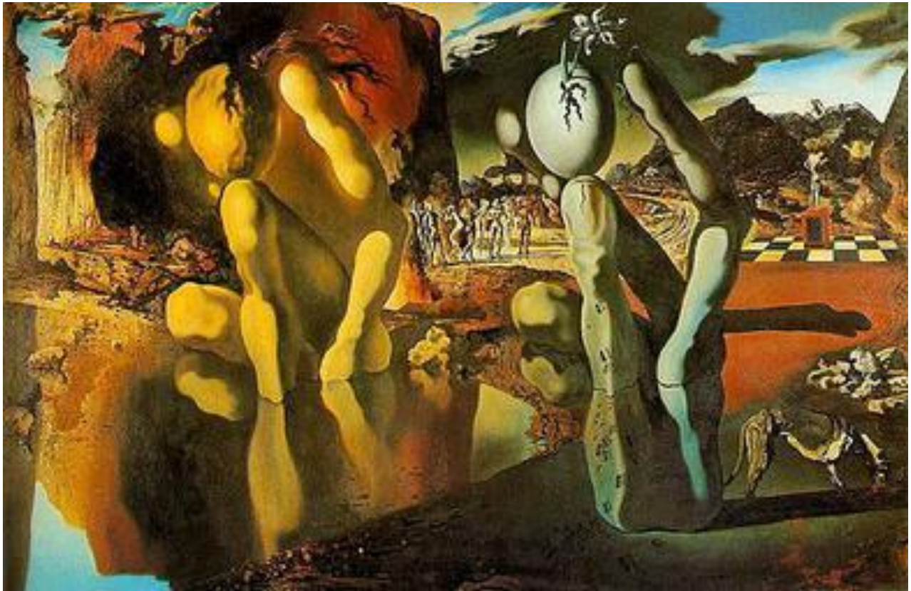
Slika 10. Metamorfoza Narcisa. Ulje na platnu, 1937.

( https://upload.wikimedia.org/wikipedia/en/2/21/Metamorphosis_of_Narcissus.jpg , 20.07.2020.)