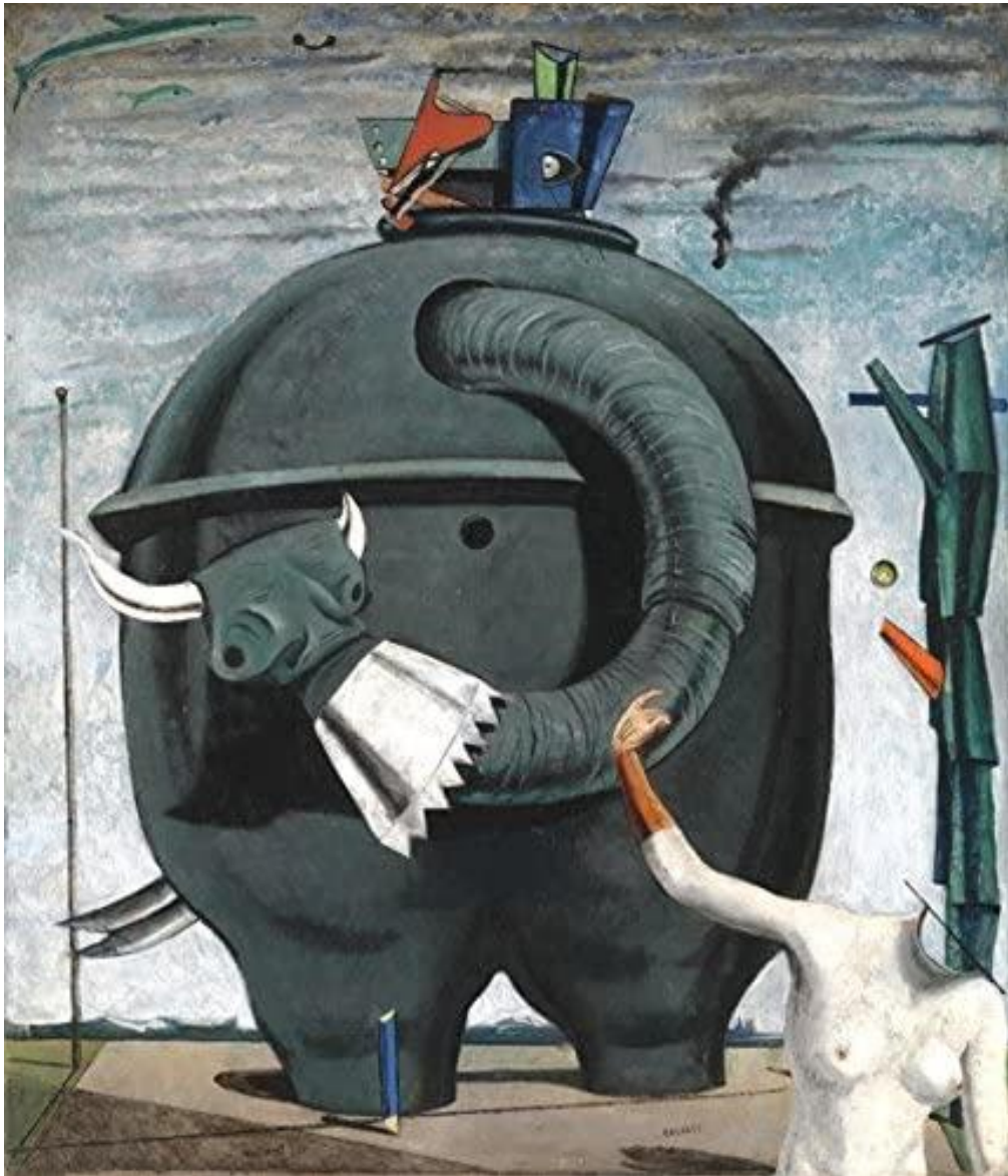
Slika 2. Slon Celebes. Ulje na platnu, 1921.

( https://images-na.ssl-images-amazon.com/images/I/511EALR2DdL.AC.jpg , 17.06.2020.)