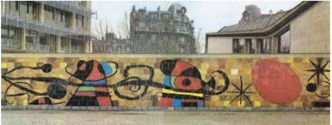
Slika 4. Zid Sunca. Freska, 1955. - 1958.

( https://hemmahoshilde.files.wordpress.com/2018/02/joanmiro6.jpg?w=745&h=281 ,