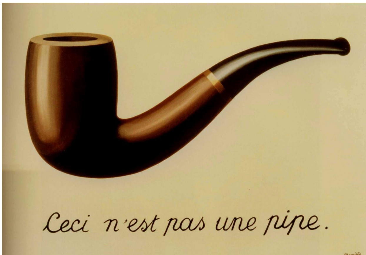
Slika 6. Izdaja. Ulje na platnu, 1929.

( https://thisaveragemoi.files.wordpress.com/2014/11/renc3a9-magritte-la-trahison-des-images-1929-la-county-museum-of-art.jpg , 10.09.2020)