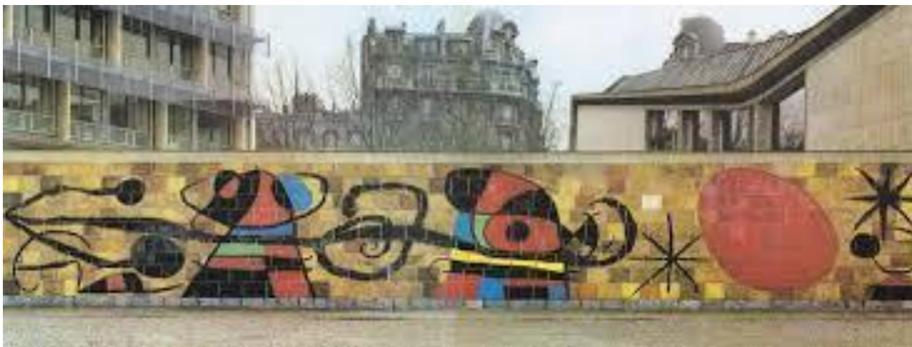
Slika 4. Zid Sunca. Freska, 1955. - 1958.

( https://hemmahoshilde.files.wordpress.com/2018/02/joanmiro6.jpg?w=745&h=281 ,