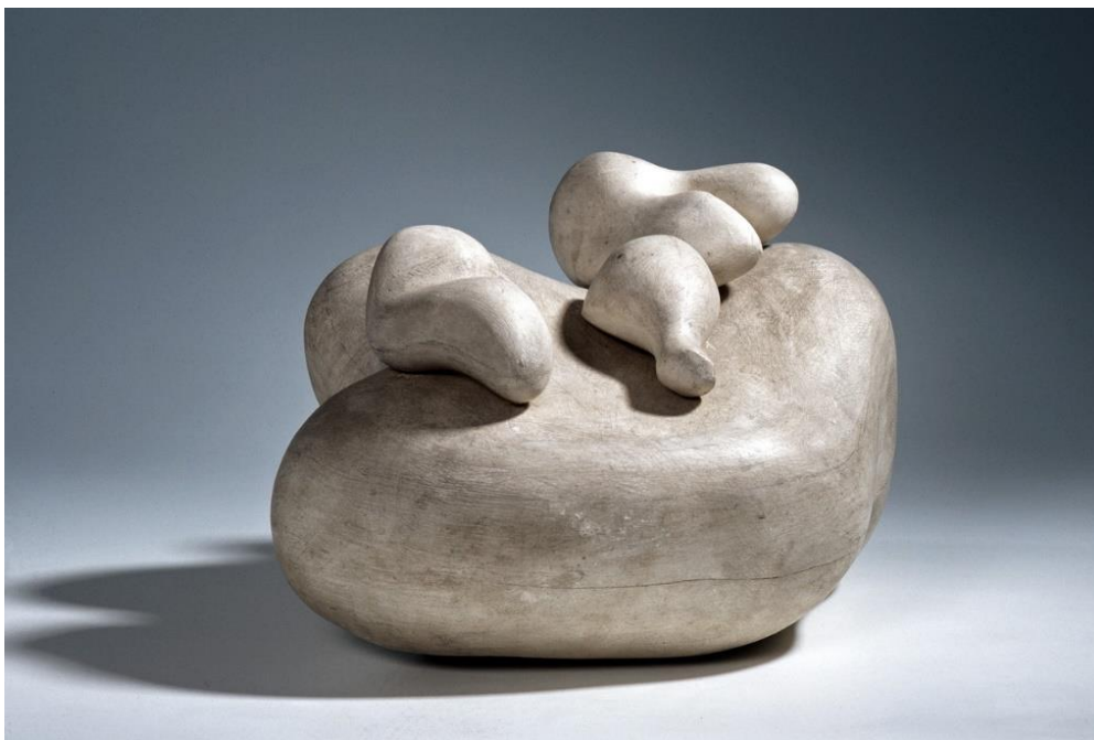
Slika 1. Glava s tri dosadna objekta. Bronca, 1930. (lijevano 1950.)