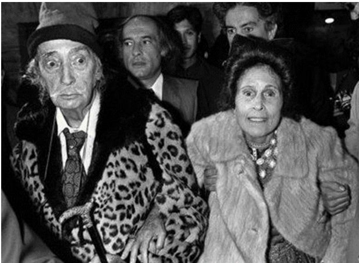
Slika 9. Salvador Dali i Gala

( https://dam-13749.kxcdn.com/wp-content/uploads/2017/02/f016f3df4ae7943ae49db871245e90eb.jpg , 19.07.2020.)