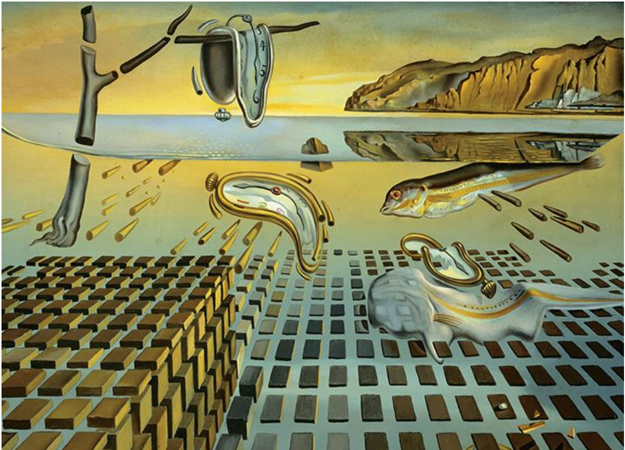
Slika 17. Dezintegracija postojanosti pamćenja. Ulje na platnu, 1954.

Slika "Dezintegracija postojanosti pamćenja" nastavak je na već spomenutu najpoznatiju Dalijevu sliku. Obje slike imaju slična glavna obilježja, ali druga slika prikazuje original u stanju raspadanja, kao što je i sam naslov otkriva. Ovo djelo naslikano je 20 godina nakon prve verzije, odnosno 1954. godine.