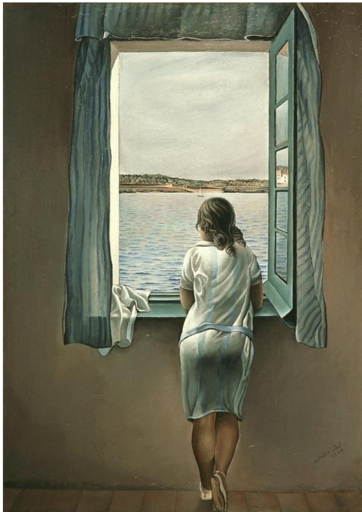
Slika 14. Djevojka koja stoji na prozoru. Ulje na platnu, 1925.

https://emad.pgsri.hr/rad/wp-content/uploads/photo-gallery/stvaralastvo/salvador-dali-woman-at-the-window-muchacha-en-la-ventana-1333532772_b.jpg , 01.08.2020.)