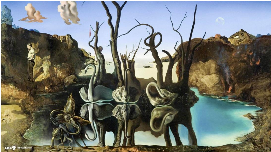
Slika 11. Labudovi koji reflektiraju slonove. Ulje na platnu, 1937.