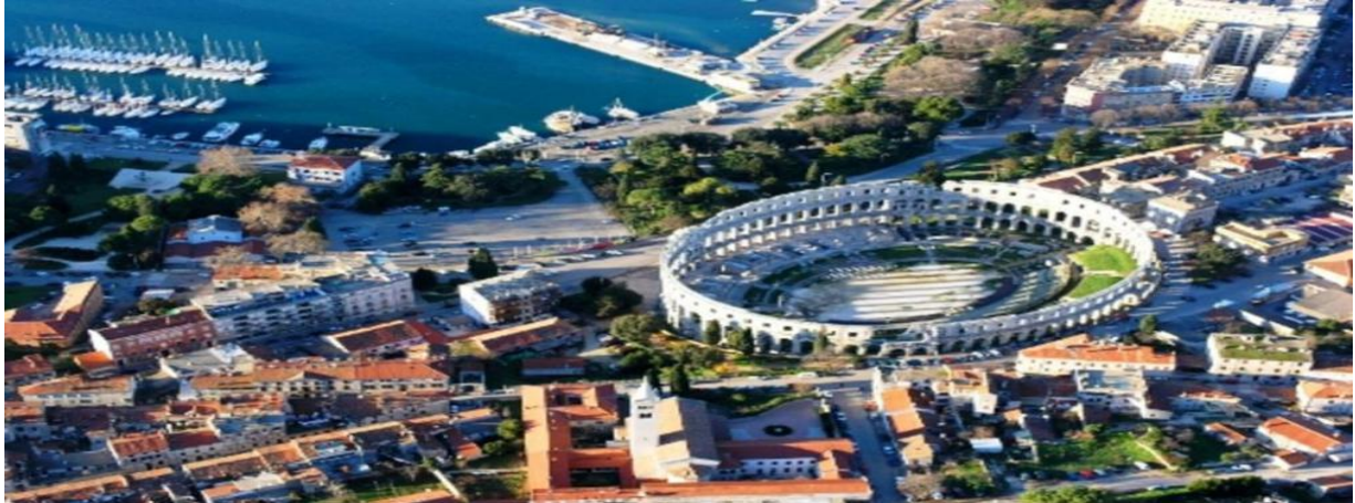
Slika 2. Pula danas

stambene prostore, vile su nastale iz "prijeke potrebe doličnih zdanja" za austro-ugarske časnike i dužnosnike. 11