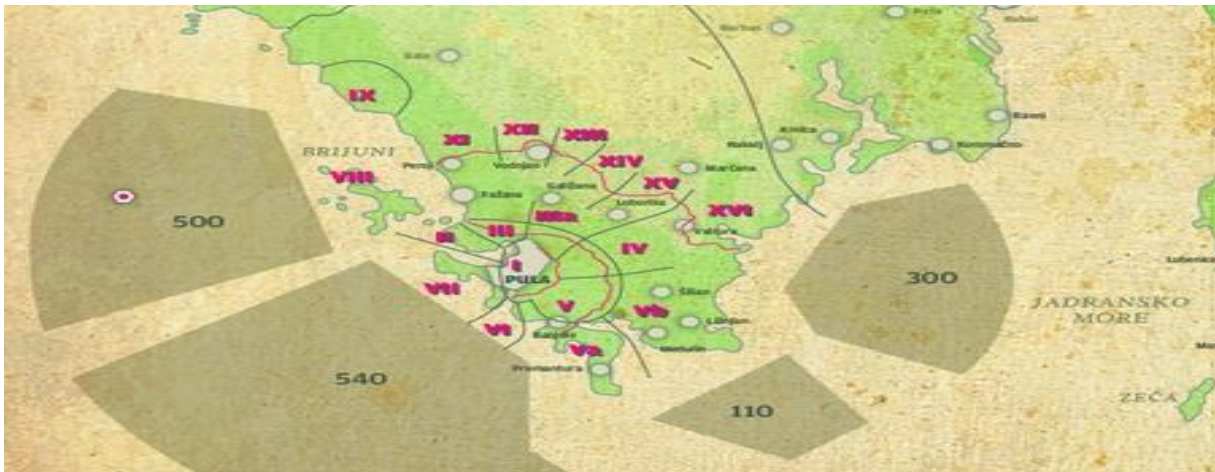
Slika 8. Pula – Fortifikacijske utvrde