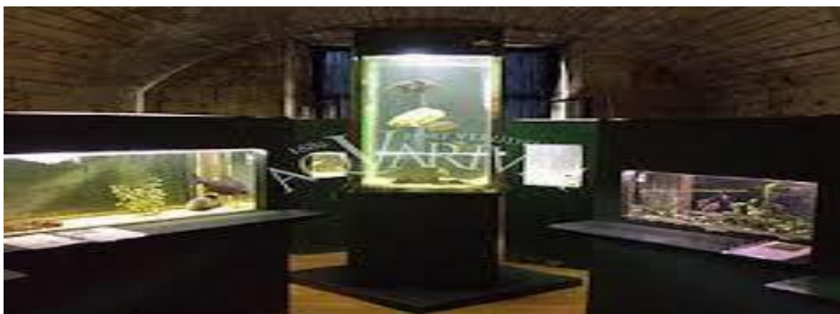
Slika 11. Aquarium Pula

Fort je 1947. preuzeo grad Pula i predao na korištenje lokalnom turističkom poduzeću. U njemu je bio smješten disko, frizerski salon, suvenirnice, trgovina, da bi kasnih 80-ih godina postao spalionica smeća. U stanju potpune zapuštenosti 2002. preuzela ga je biologinja i oceanologinja dr. Milena Mičić koja je vlastitim sredstvima krenula u postupnu revitalizaciju utvrde da bi u njoj otvorila Akvarij s referentnim centrom za liječenje morskih kornjača te školom biologije koju pohađaju mnogobrojna djeca. Da bi osigurala sredstva za početno čišćenje i postupno uređenje utvrde podigla je kredit stavljajući pod hipoteku vlastitu imovinu. Koliku potporu ima u tom projektu ilustrira podatak da je u posljednjoj raspodjeli Ministarstva kulture dobila 30 tisuća kuna, a procjenjuje se da bi samo za izradu projektne dokumentacije obnove cjelokupne utvrde trebalo 400 tisuća kuna, dok su za obnovu samu potrebni milijunski iznosi. Na raspolaganju za tako velike investicijske zahvate stoje mnogobrojni fondovi Europske unije, ali za to je potrebno imati čiste vlasničke odnose i pripremljenu konzervatorsku i projektnu dokumentaciju obnove. Bez tog preduvjeta ne može se sastaviti ni prijavnica, a realnost je takva da dio građevina čak nije ucrtan u katastarske planove. 38