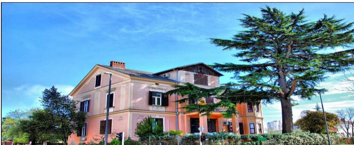
Slika 5. Villa Matilde