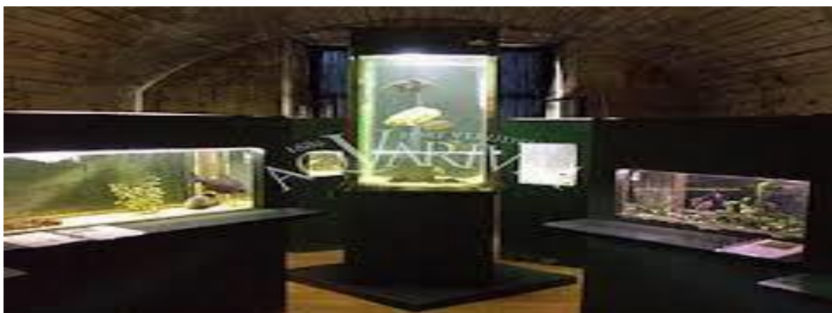
Slika 11. Aquarium Pula

Fort je 1947. preuzeo grad Pula i predao na korištenje lokalnom turističkom poduzeću. U njemu je bio smješten disko, frizerski salon, suvenirnice, trgovina, da bi kasnih 80-ih godina postao spalionica smeća. U stanju potpune zapuštenosti 2002. preuzela ga je biologinja i oceanologinja dr. Milena Mičić koja je vlastitim sredstvima krenula u postupnu revitalizaciju utvrde da bi u njoj otvorila Akvarij s referentnim centrom za liječenje morskih kornjača te školom biologije koju pohađaju mnogobrojna djeca. Da bi osigurala sredstva za početno čišćenje i postupno uređenje utvrde podigla je kredit stavljajući pod hipoteku vlastitu imovinu. Koliku potporu ima u tom projektu ilustrira podatak da je u posljednjoj raspodjeli Ministarstva kulture dobila 30 tisuća kuna, a procjenjuje se da bi samo za izradu projektne dokumentacije obnove cjelokupne utvrde trebalo 400 tisuća kuna, dok su za obnovu samu potrebni milijunski iznosi. Na raspolaganju za tako velike investicijske zahvate stoje mnogobrojni fondovi Europske unije, ali za to je potrebno imati čiste vlasničke odnose i pripremljenu konzervatorsku i projektnu dokumentaciju obnove. Bez tog preduvjeta ne može se sastaviti ni prijavnica, a realnost je takva da dio građevina čak nije ucrtan u katastarske planove. 38