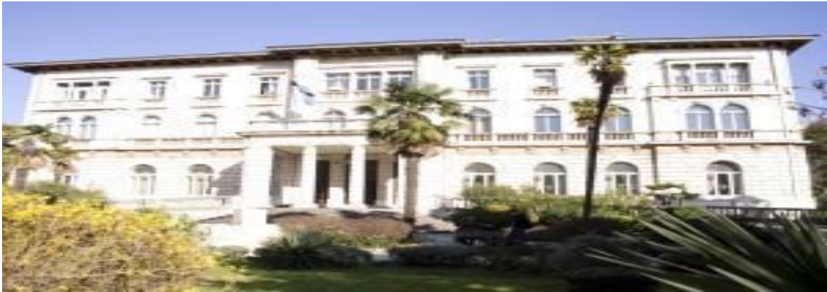
Slika 7. Marine-Kasino danas - Dom Hrvatskih branitelja

Danas ova zgrada pripada Ministarstvu obrane i nosi naziv Dom hrvatskih branitelja ili Dom oružanih snaga RH. Zgrada je otvorena posjetiteljima i u njoj se priređuju broji kulturni programi, izložbe, svečane večere, popularni Sajam knjiga, prezentacije, koncerti i predavanja. 17