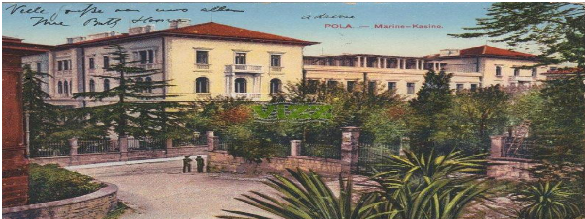
Slika 6. Marine-Kasino

Razvojem grada kao središnje ratne luke Monarhije, Marine Kasino postaje pretijesan. Javlja se potreba za novim prostorom. Zgrada je srušena u listopadu 1910. godine. Već 1913. godine završena je nova reprezentativnija zgrada na 15.000 četvornih metara koja se može vidjeti i danas. Bila je to primjereno organizirana ustanova izgrađena bez novčane pomoći države, održavana sredstvima časnika. Bečki arhitekt Ludwig Baumann projektirao je najmoderniju građevinu u gradu. U zgradi je napravljen prekrasan glavni hodnik, („Zimski vrt”), s dvostrukim kaneliranim dorskim stupovima prislonjenim na stakleni strop koji je vodio prema dvoranama predviđenim za održavanje koncerata i balova, odnosno na terasu, vrt i okolni park. Glavna dvorana imala je i pozornicu i trostrani balkon. Zgrada Marine Kasinoa bila je otvorena za svoje članove od 5, odnosno 6 sati zimi, do 02 sata poslije ponoći, prostorije su grijane, a temperatura nije smjela biti niža od 19 stupnjeva. Zgrada je imala vlastiti izvor električne energije. Ručak je posluživan od 10 do 14 sati, a večera od 19 do 01 sat poslije ponoći. Statut i Kućni red utvrđivali su ponašanje članova i sudionika zbivanja u prostoru Kasinoa.