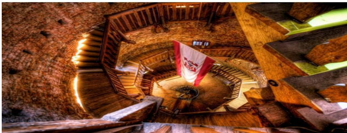
Slika 9. Tvrđava Spandau u Berlinu

Učeći od europskih primjera dobre prakse (fortifikacijski kompleks u bivšoj vojnoj helsinškoj luci, Pomorski muzej hidroaviona u Talinu, tvrđava Spandau u Berlinu, fortifikacijski sustav u Krakowu itd.) valja ponajprije istaknuti razlog i svrhu zaštite i očuvanja kulturnih dobara, odnosno njihovu kulturnu i povijesnu vrijednost: pošto pulska kompleks utvrda, kao i sva kulturna dobra, simbolički predstavlja ključne vrijednosti lokalne multikulturne povijesti i zajedničkog europskog identiteta, želimo ga očuvati u neokrnjenom i izvornom stanju kao našu vezu s prošlošću, kako bi mogli njegove vrijednosti prenositi i budućim naraštajima, uvažavajući pri tom društvene, etičke i pravne razloge uspostavljanja uvjeta da kulturna dobra prema svojoj namjeni i značenju služe potrebama pojedinca i općem interesu. 32