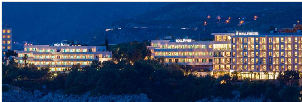
Slika 5 Importanne Hotels & Resorts

Izvor: Poslovni turizam, Importanne Hotels & Resorts , URL: https://www.poslovniturizam.com/objekt/importanne-hotels-resort/103/ (2020-8-12)