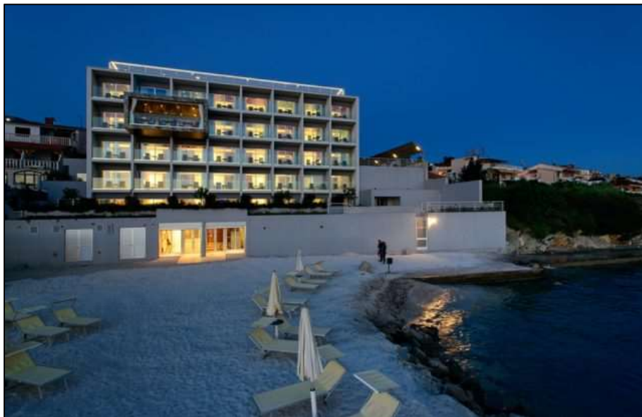
Slika 4 Eko održivi Hotel Split