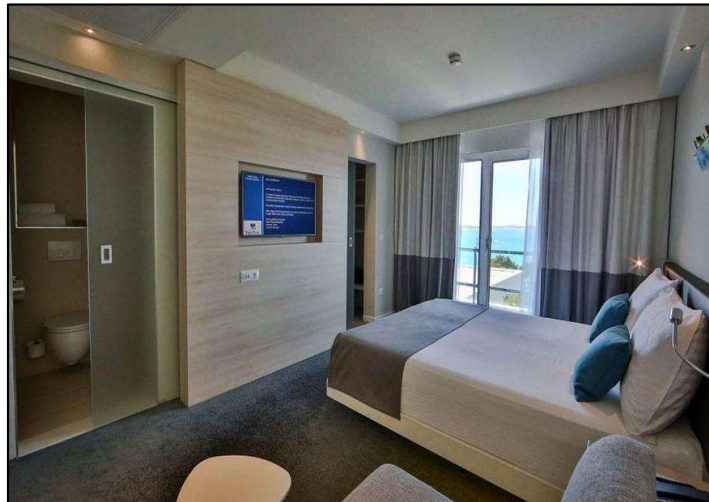
Slika 6 Personalizirani TV kanal hotela Park Plaza Belvedere