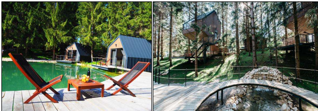
Slika 7 Plitvice Holiday Resort