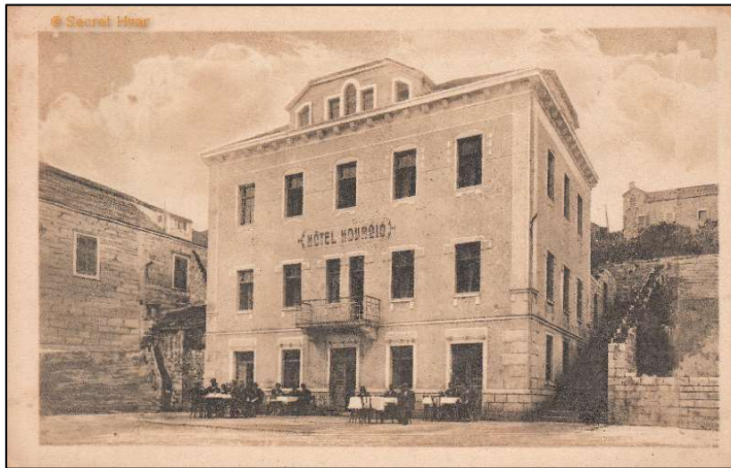
Slika 1 Prvi hotel u RH na Hvaru