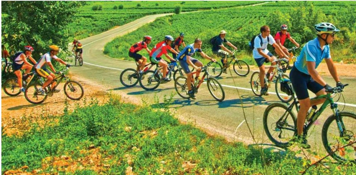
Slika 1. Prikaz turističke biciklijade