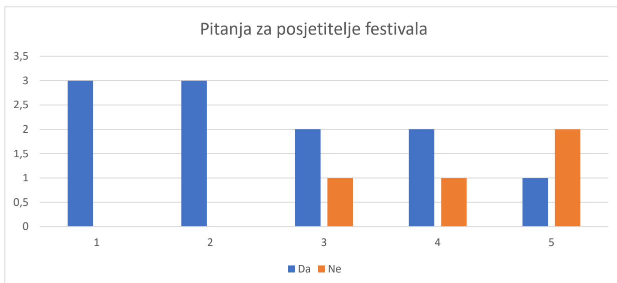
Tablica 4. Pitanja za domaće posjetitelje festivala