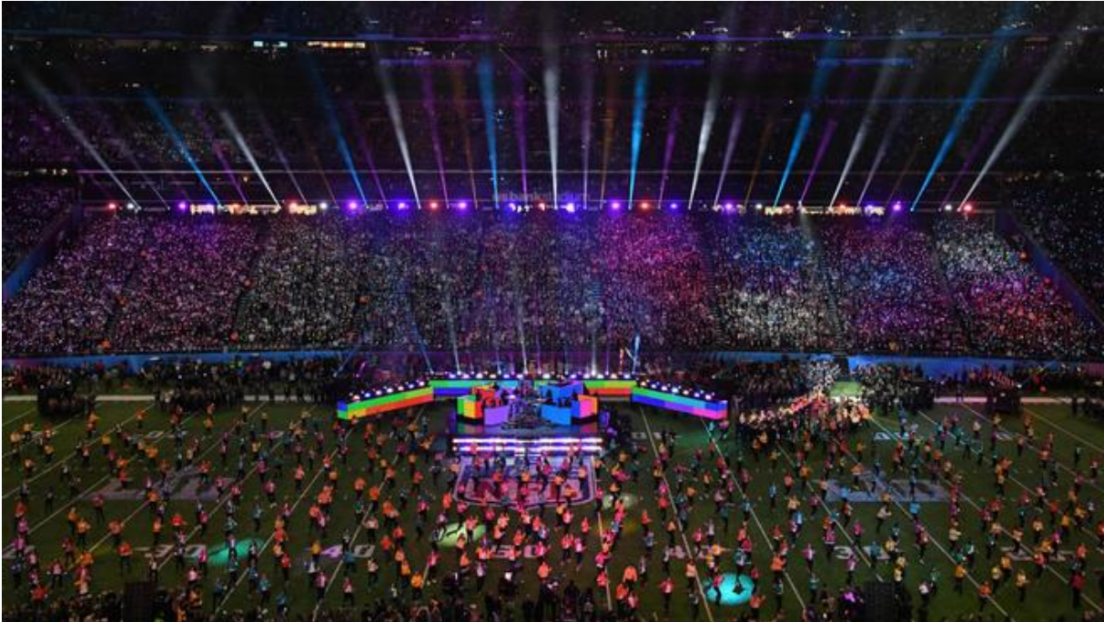
Slika 1. Super Bowl Halftime Show

Izvor: https://www.nbcsports.com/washington/redskins/2019-super-bowl-halftime-show-everything-you-need-know-about-maroon-5s-performance , Pristupljeno: 15.04.2020.