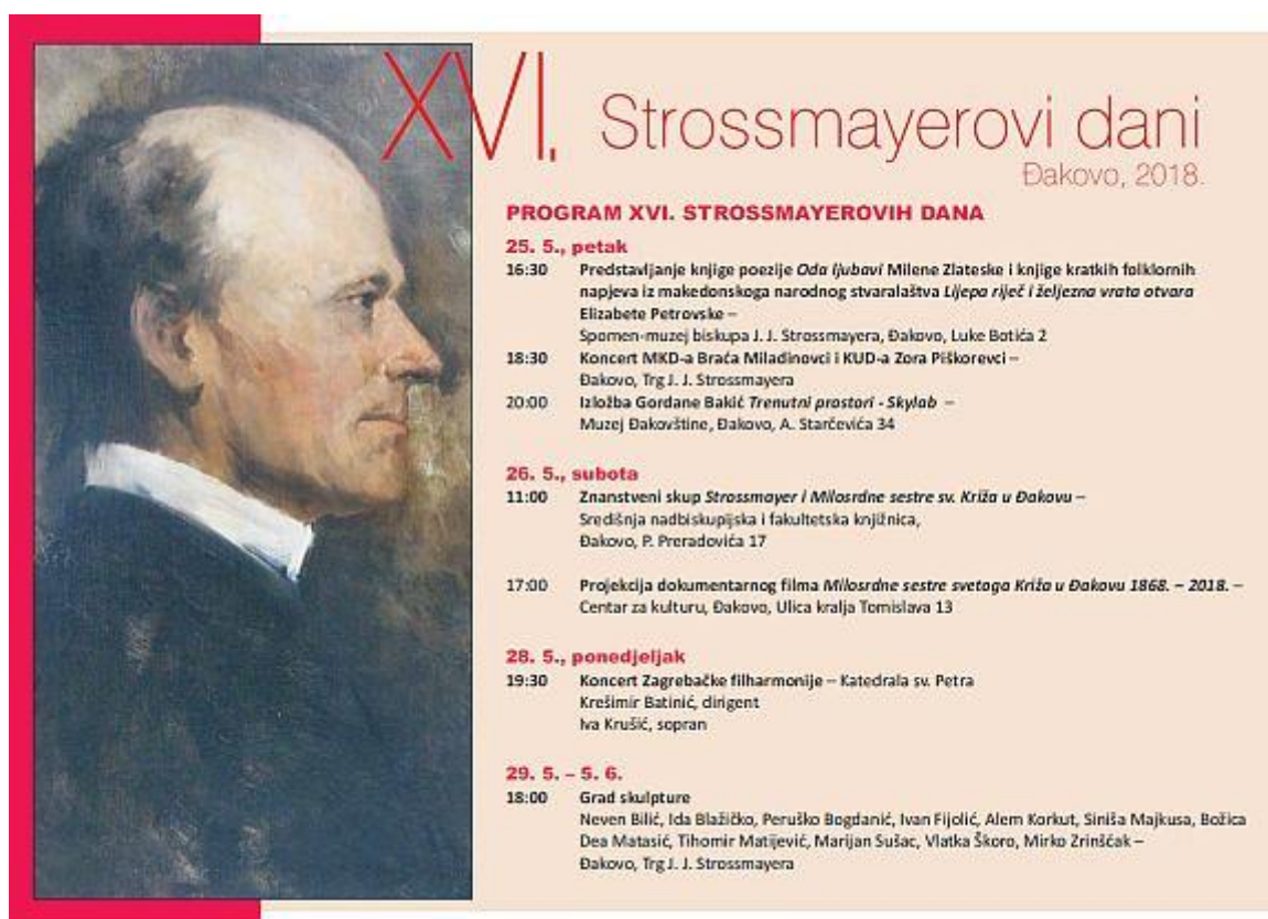
Slika 11. Program XVI. Strossmayerovih dana