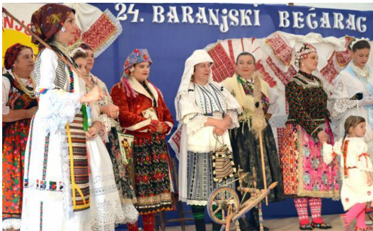
Slika 20. Manifestacija „Baranjski bećarac“