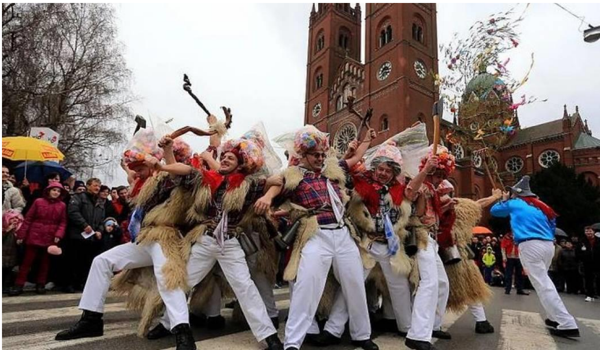
Slika 13. Đakovački bušari