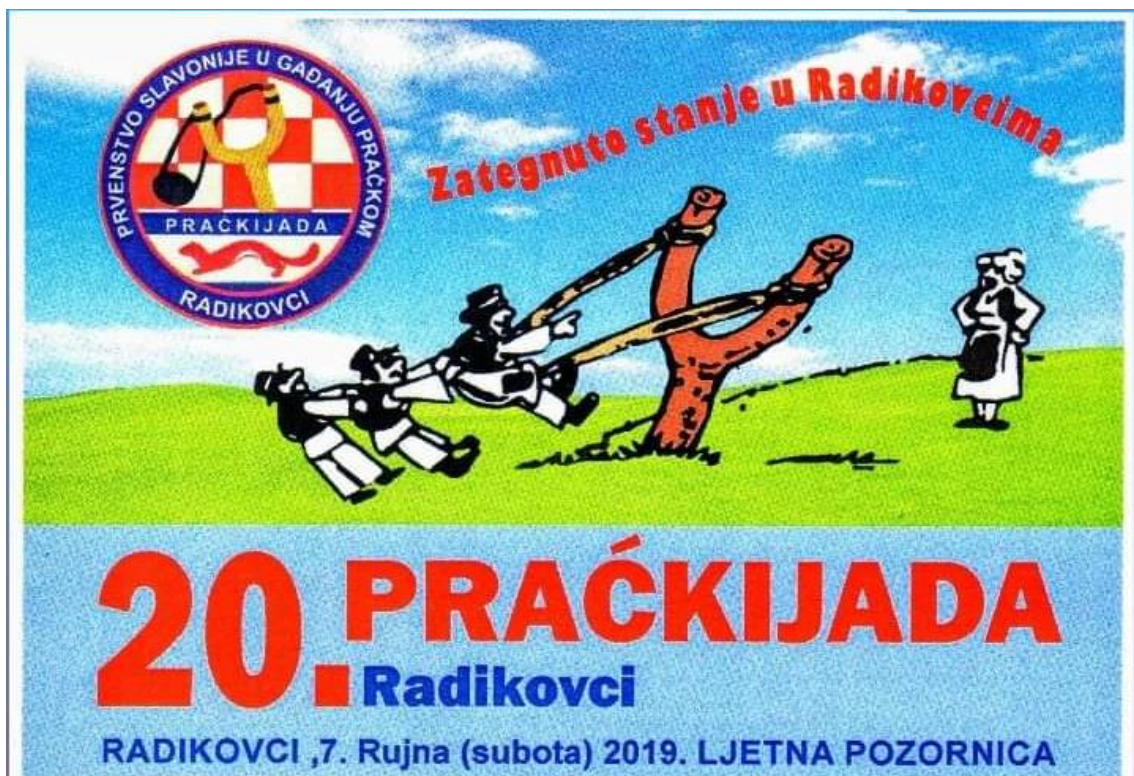
Slika 15. Promotivni plakat za „Praćkijadu“