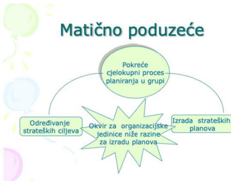
Slika 3. Postupak planiranja u poduzeću na međunarodnom tržištu