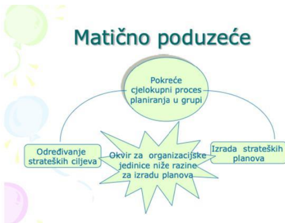
Slika 3. Postupak planiranja u poduzeću na međunarodnom tržištu