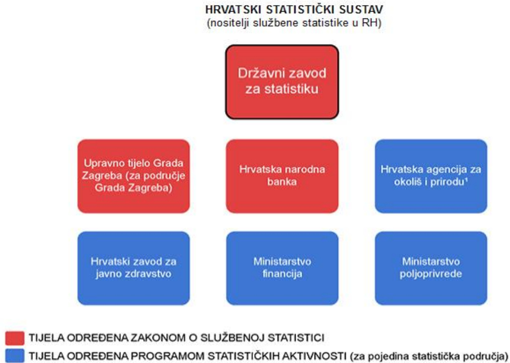
Slika 2. Hrvatski statistički sustav