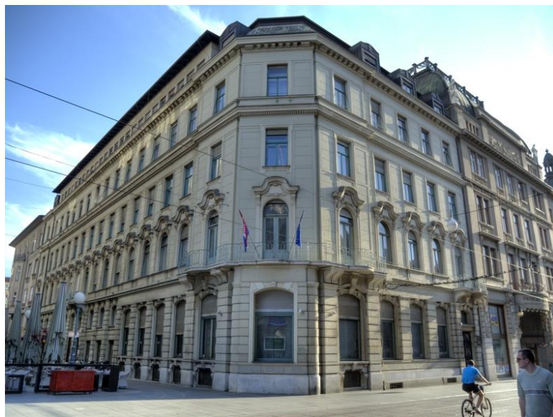
Slika 3. Državni zavod za statistiku na adresi Ilica 3, 10000 Zagreb

Njihovo osnovno pravilo je da pohranjuju i čuvaju podatke u obliku koje ne omogućuje identifikaciju statističke jedinice, a obrasci u papirnatom obliku uništavaju se nakon unosa i obrade podataka. Službene osobe koje imaju pristup podacima, potpisuju izjavu o povjerljivosti kojom se obvezuju da će postupati u skladu sa zakonom. Državni zavod za statistiku, na temelju pisanog zahtjeva, može znanstvenicima i znanstvenim organizacijama koji provode statističke analize za znanstvene svrhe omogućiti pristup onim podacima koji ne omogućuju izravnu identifikaciju statističke jedinice. 31