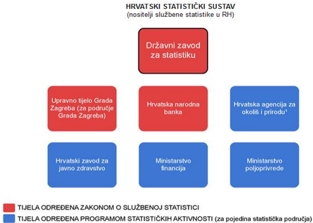
Slika 2. Hrvatski statistički sustav