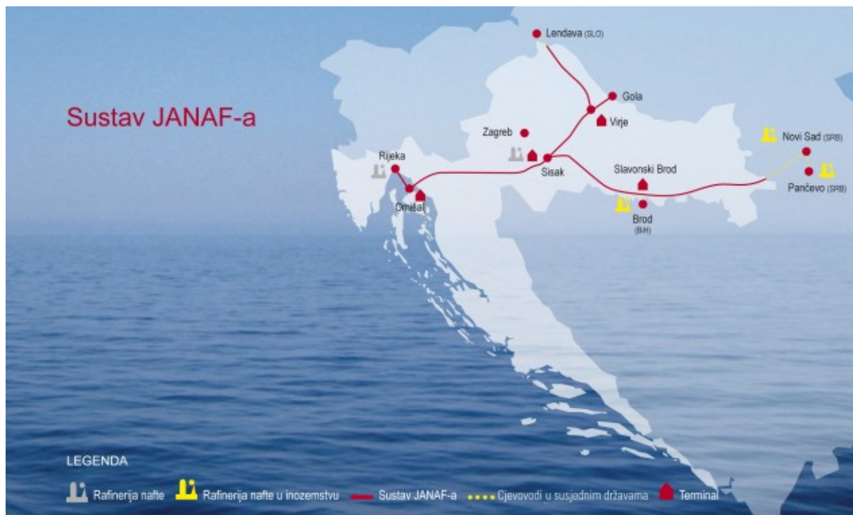
Slika 2. Sustav JANAF-a u Republici Hrvatskoj, izvor: JANAF, http://www.janaf.hr .

JANAF ima ukupno kapaciteta za skladištenje nafte 1,54 milijuna m 3 i 202.000 m 3 za skladištenje naftnih derivata.