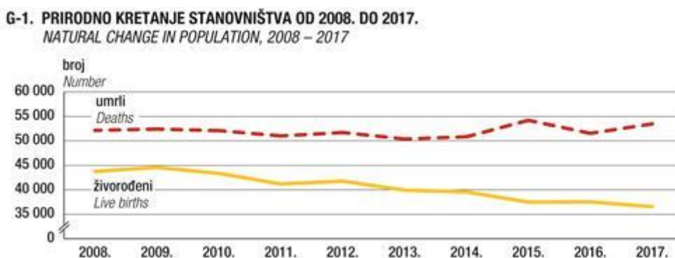
Slika 1.: Prirodno kretanje stanovništva RH od 2008-2017.godine

Izvor: DZS (2017.), Prirodno kretanje stanovništva RH od 2008-2017. Godine, Državni zavod za statistiku. Zagreb: https://www.dzs.hr/Hrv_Eng/publication/2018/07-01-01_01_2018.htm , (05.08.2018)