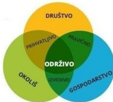
Slika 1. Slikovni prikaz održivog razvoja