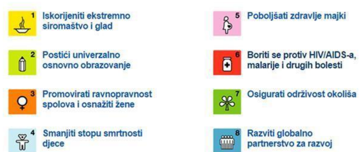
Slika 2. Osam glavnih ciljeva „Milenijske deklaracije“