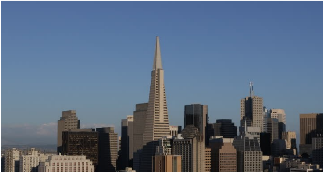
Slika 11. San Francisco