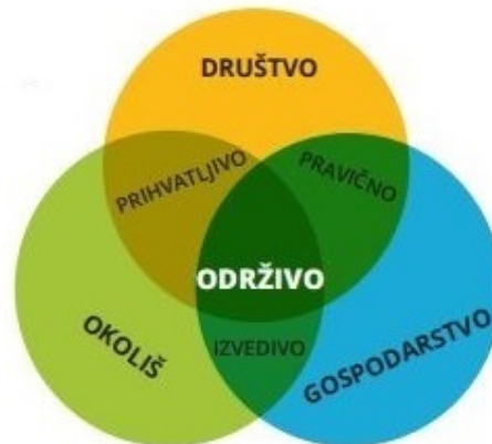
Slika 1. Slikovni prikaz održivog razvoja