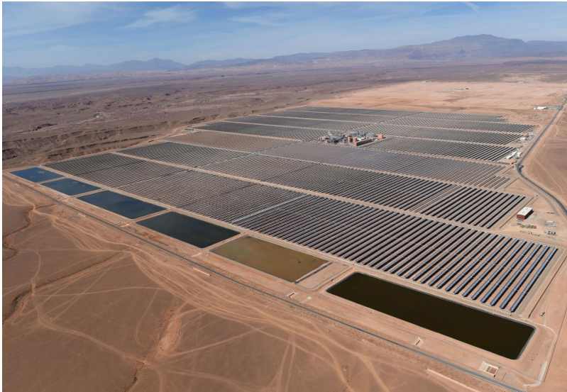
Slika 10. Solarni kompleksi Quarzazate