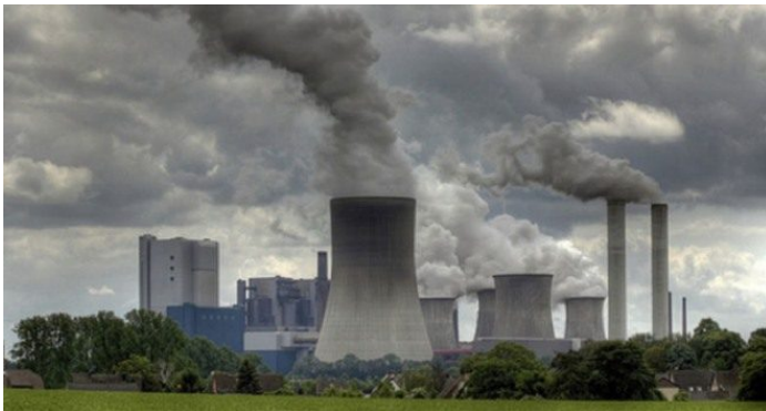
Slika 8. Termoelektrana Ugljevik u Bosni i Hercegovini

Prikaz jednog primjera zagađivača u našem bliskom susjedstvu.