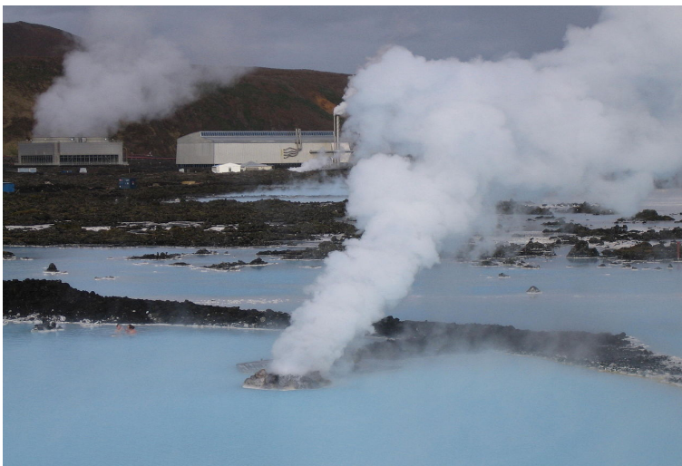
Slika 12. Geotermalna energija u Reykjaviku