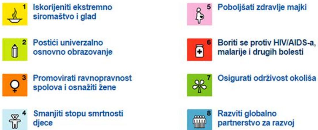
Slika 3. Osam glavnih ciljeva „Milenijske deklaracije“