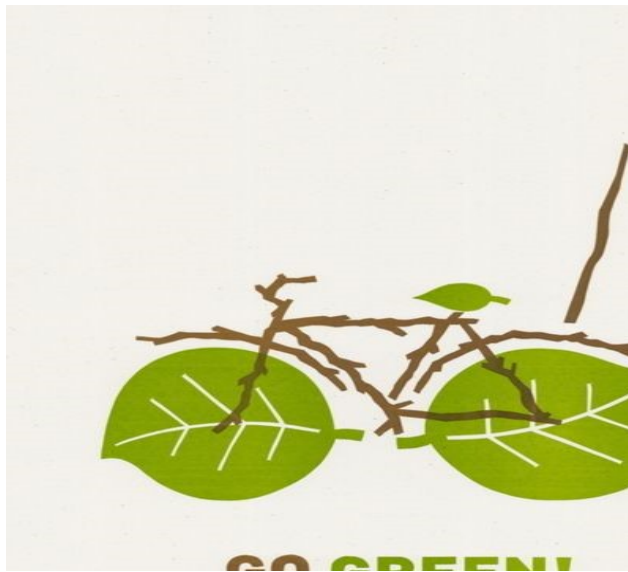
Slika 6. Logo Hamburga kao ekološkog grada