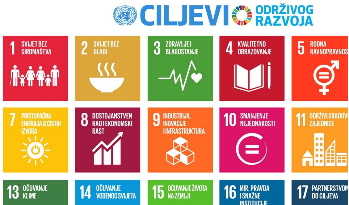
Slika 4. Ciljevi Programa za održivi razvoj 2030