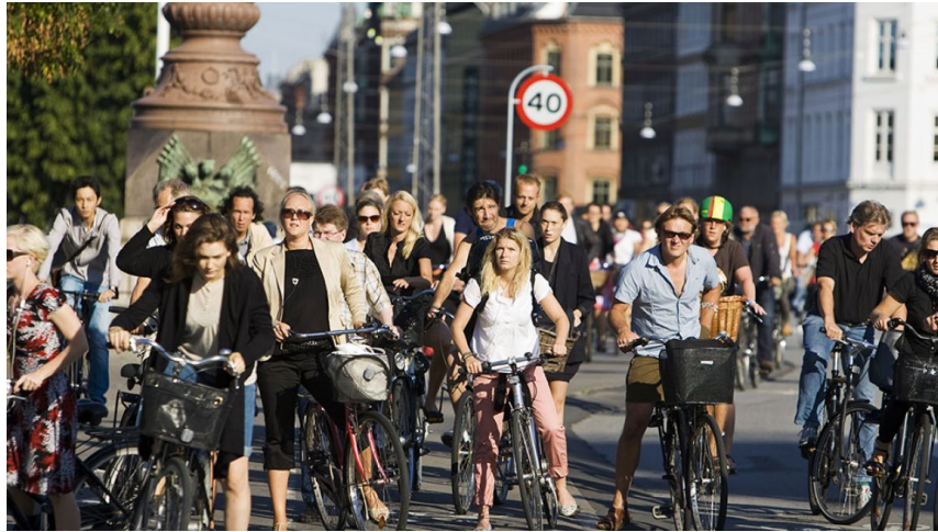
Slika 11. Copenhagen by bike