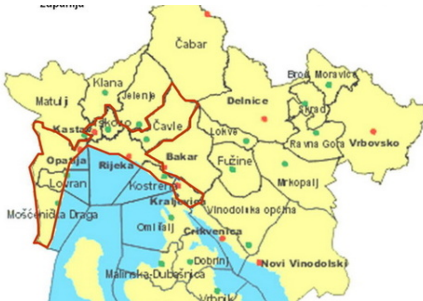
Slika 15. Prikaz urbane aglomeracije Rijeka