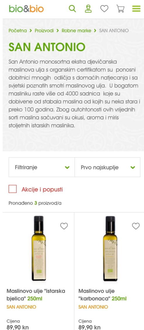
Slika 10 Ponuda monosortnih ulja uljare San Antonio na Bio&Bio webshopu