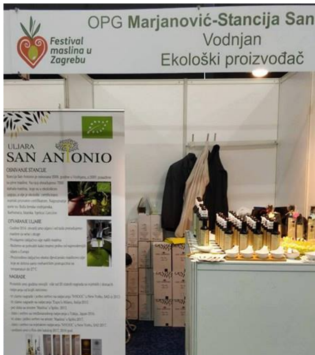
Slika 13 Degustacija na festivalu maslina u Zagrebu