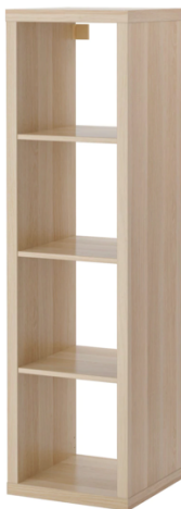
Slika 1 Polica iz Ikeinog asortimana