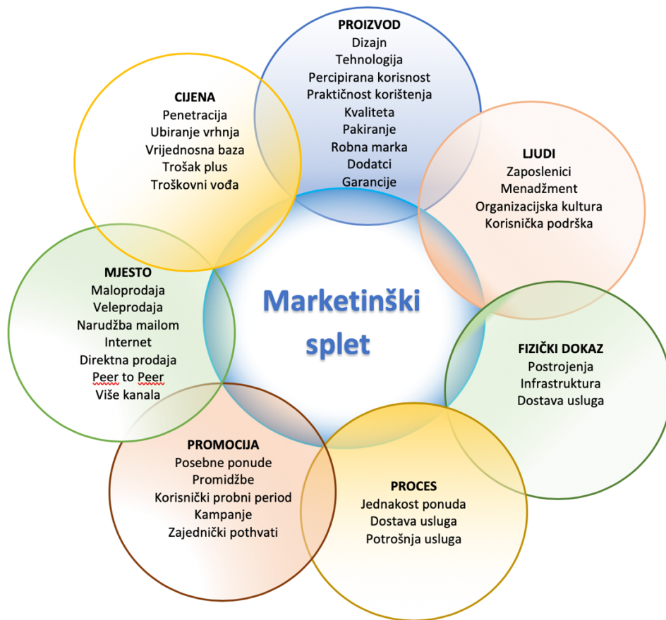
Slika 3 7P marketinškog spleta