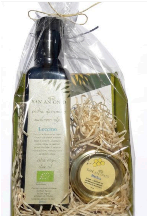
Slika 21 Poklon paket uljare San Antonio