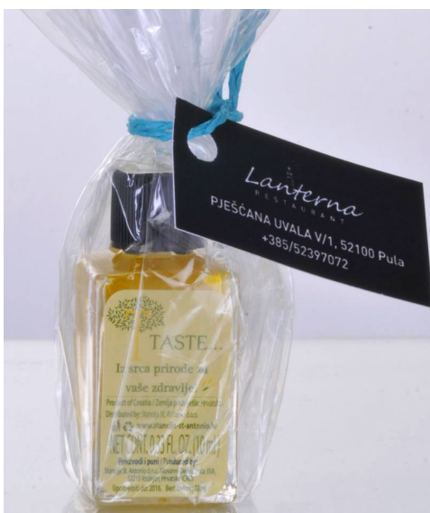
Slika 20 Poklon paketić za jedan restoran