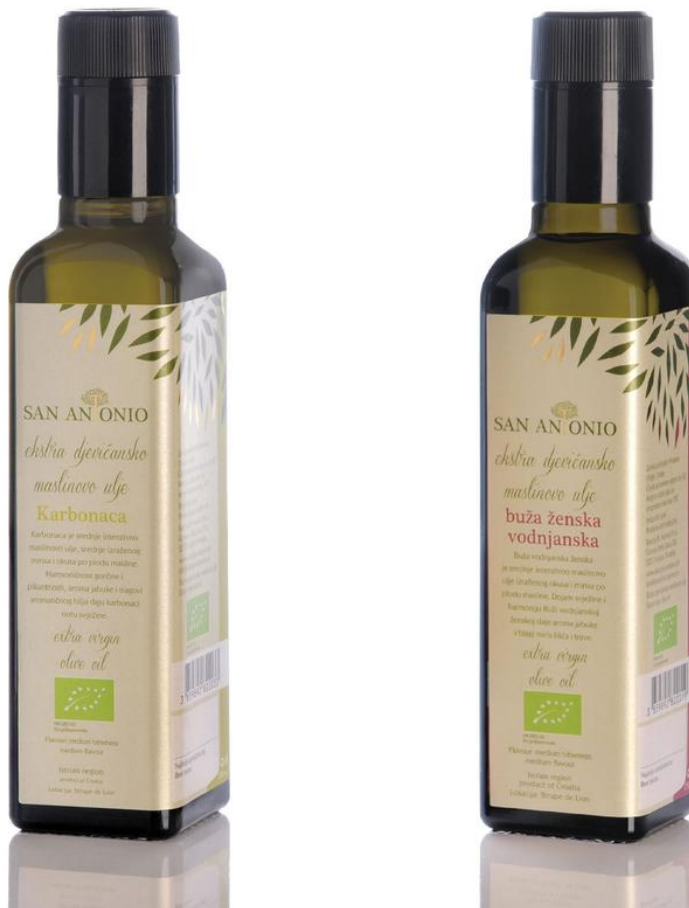
Slika 8 Monosortno ulje uljare „San Antonio“