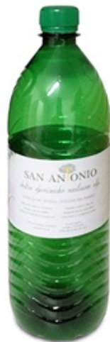
Slika 14 Plastična ambalaža zapremnine 1L