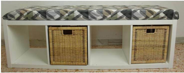
Slika 2 Prikaz prenamjene Ikeine police