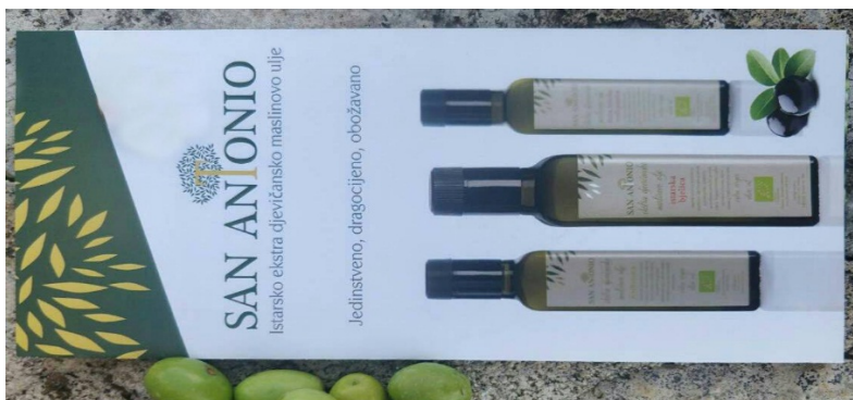
Slika 11 Promotivni letak uljare San Antonio