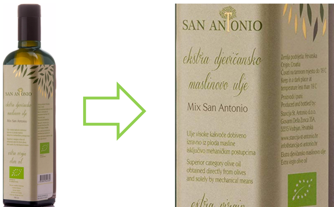
Slika 15 Staklena ambalaža višesortnog ulja