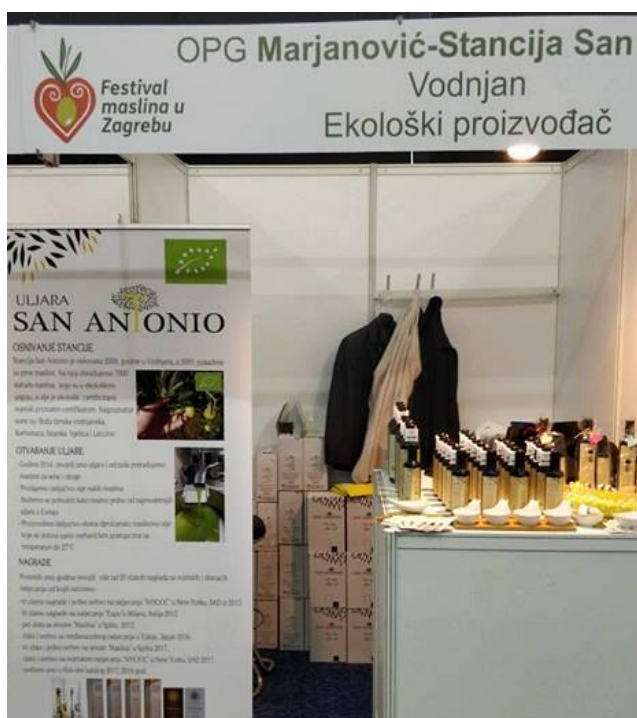
Slika 13 Degustacija na festivalu maslina u Zagrebu