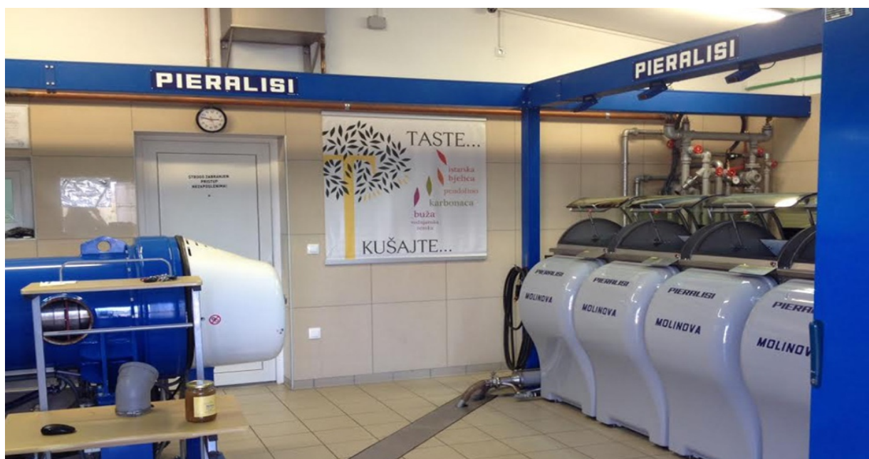
Slika 4 Uljara San Antonio