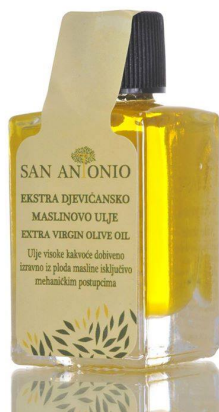
Slika 16 Bočica zapremnine 0.01L