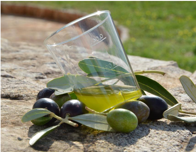
Slika 6 Maslinovo ulje nakon filtracije