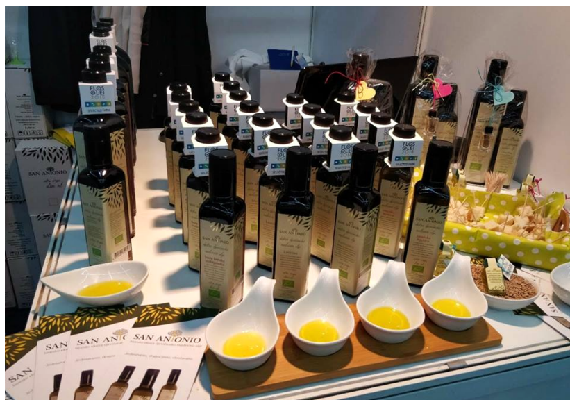
Slika 18 Degustacija ulja na festivalu maslina u Zagrebu