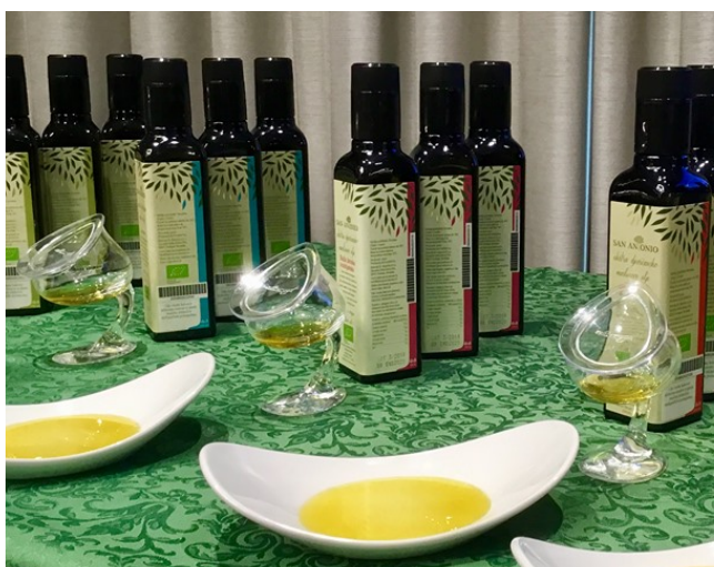
Slika 12 Mala akademija maslinovog ulja u Srbiji