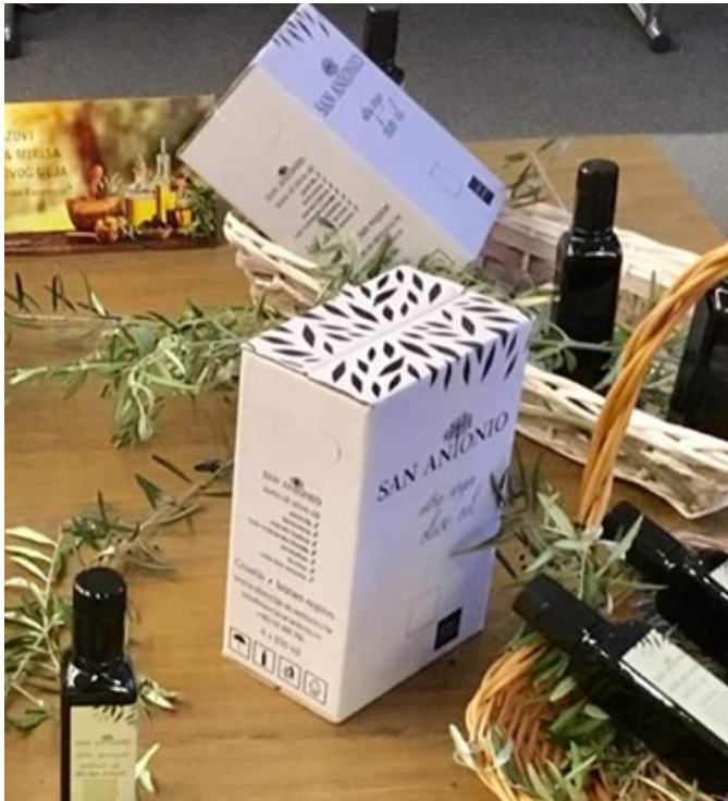
Slika 9 Kartonske kutije namijenjene za veću kupnju i dostavu