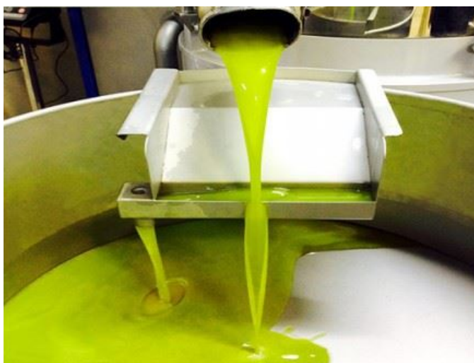
Slika 5 Svježe prerađeno maslinovo ulje