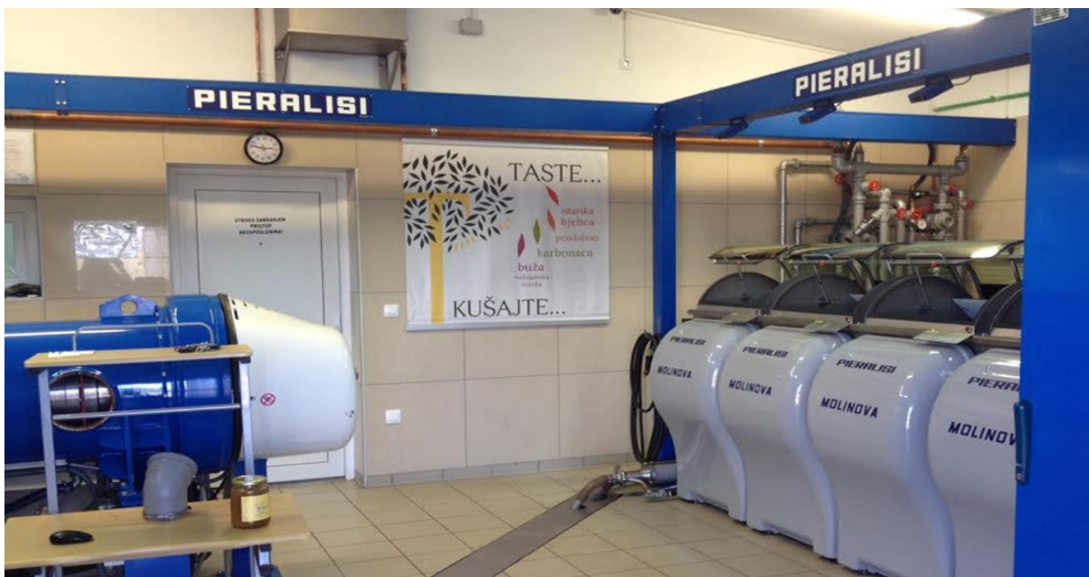
Slika 4 Uljara San Antonio