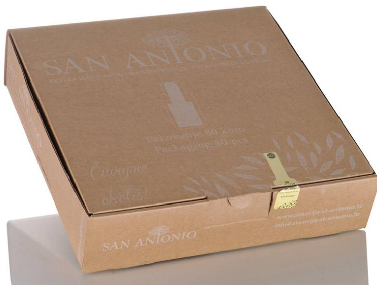
Slika 17 Set bočica u kutiji od recikliranog materijala