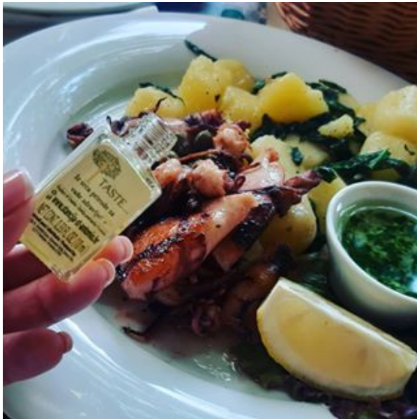
Slika 19 Ponuda mini bočice mix-a u restoranu