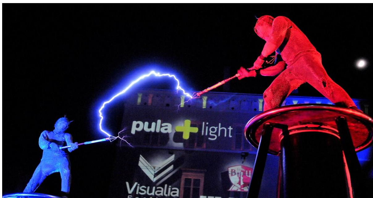
Slika br.7: Visualia

Šesta godina održavanja festivala dokaz je njegove vrijednosti i potencijala za razvoj konkurentnosti i jačanje prepoznatljivog destinacijskog imidža koji Pula predstavlja i kao grad svjetla, jer je Visualia 2016. godine uvršten u kalendar svjetskih svjetlosnih festivala. 26