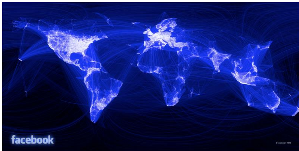
Slika 2: veza između ljudi na facebooku