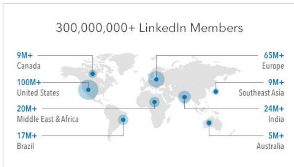
Slika 1. Korisnici društveno poslovne mreže LinkedIn u svijetu