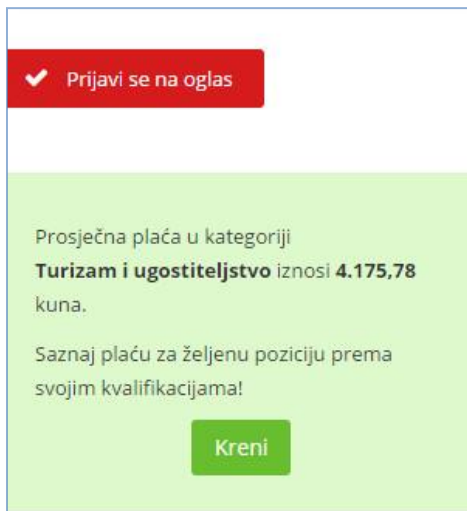
Slika 4: Izgled prijave na oglas ponuđenog posla prijava na oglas