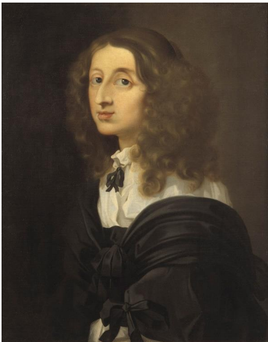
Slika 5. Portet Kristine Švedske