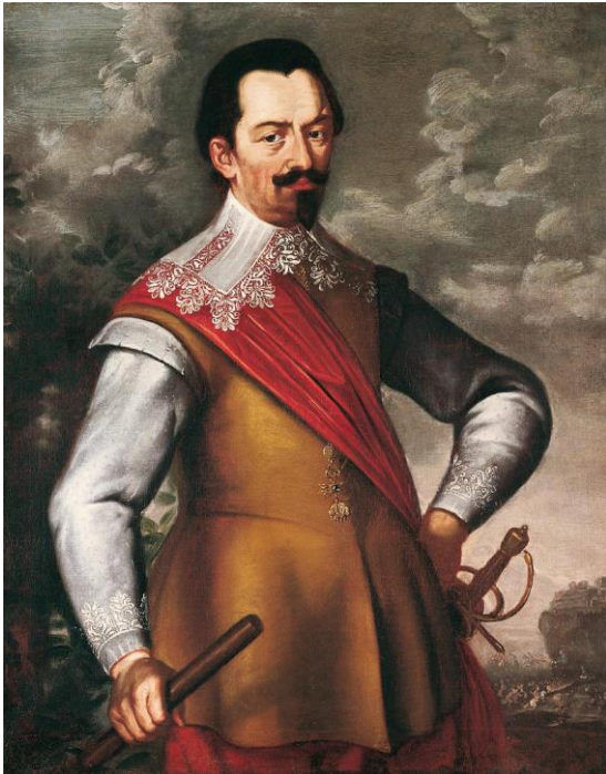
Slika 4. Portret Albrehta von Wallensteina