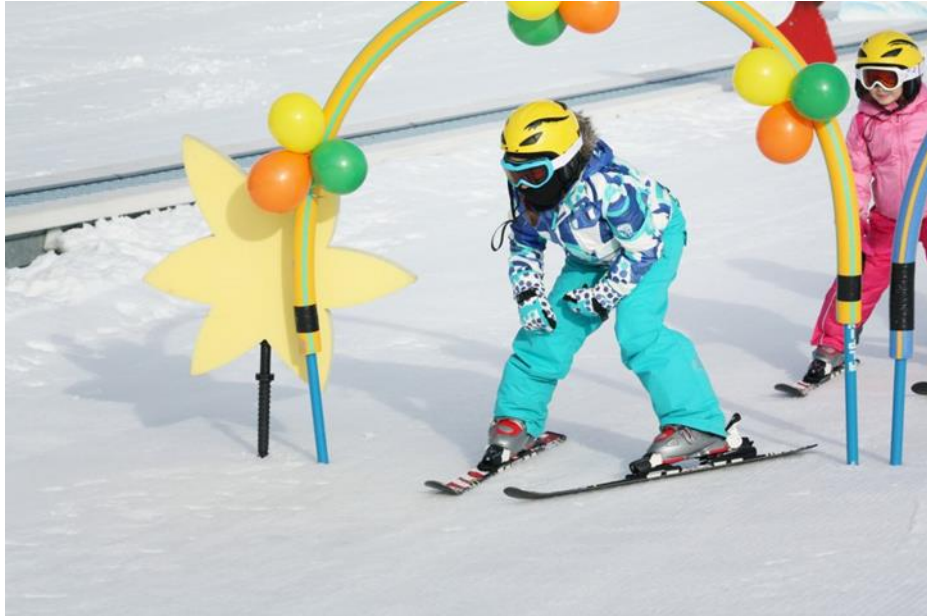
Slika 18. Izvođenje plužnih zavoja s rukama oslonjenim na koljena