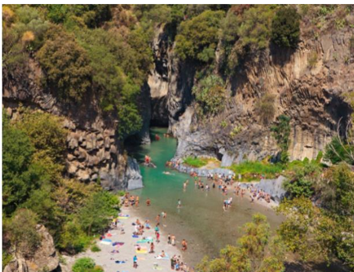
Slika 3. Kanjon rijeke Alcantare