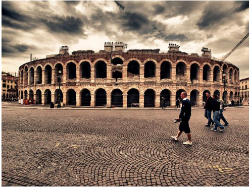
Slika 10. Arena u Veroni