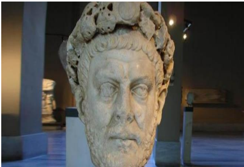
Slika 5. Car Dioklecijan