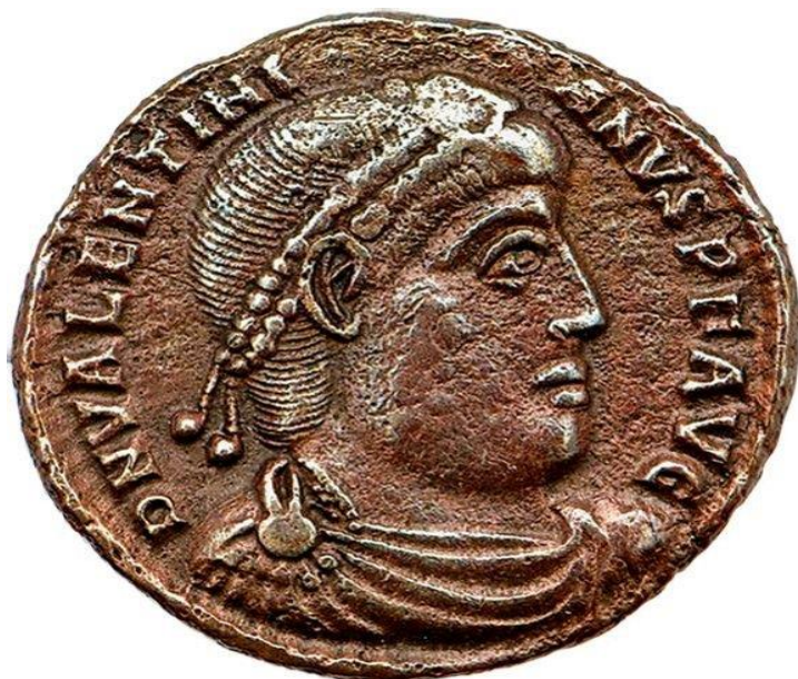
Slika 6. Car Valentinijan