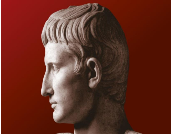
Slika 3. Car August