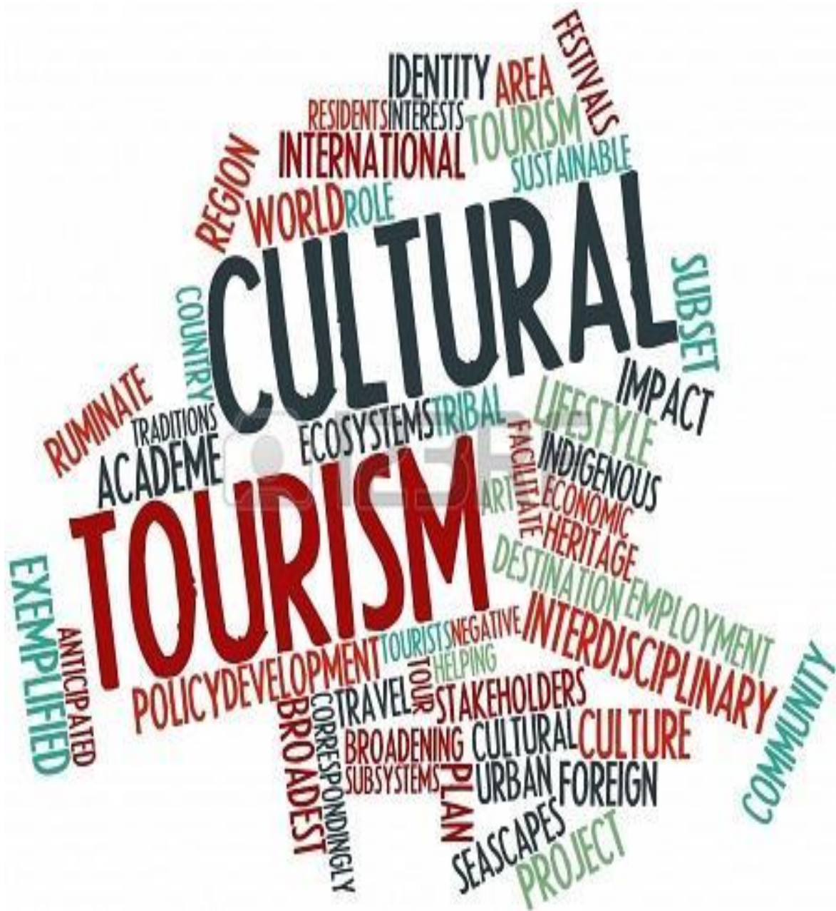
Slika 1. Kulturni turizam