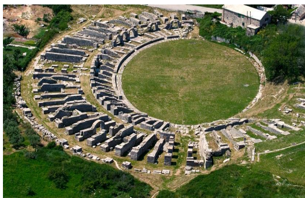
Slika 8. Ostaci amfiteatra u Solinu