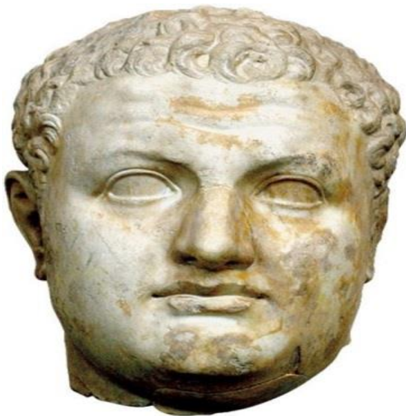
Slika 4. Car Vespazijan