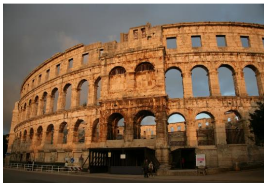
Slika 9. Amfiteatar u Puli