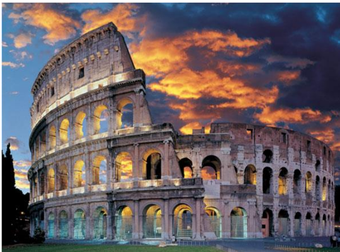
Slika 11. Kolosej u Rimu