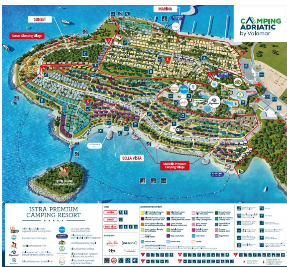
Slika 11. Mapa kampa Istra Premium Camping Resort