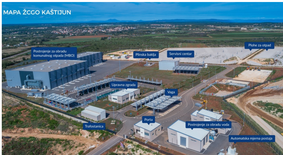
Slika 7: Mapa ŽCGO "Kaštijun" d.o.o.