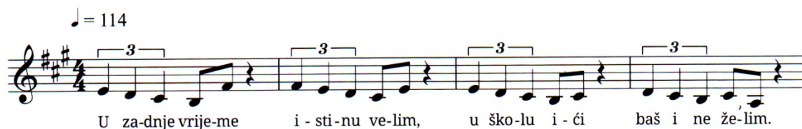
Primjer 88. Pjesma Spasimo igru , t. 1-4

napisana u 4/4 mjeri. S obzirom na opseg pjesme, od tona a do tona d2, pjesmu mogu pjevati učenici od četvrtog razreda nadalje. Tempo pjesme je Allegro.