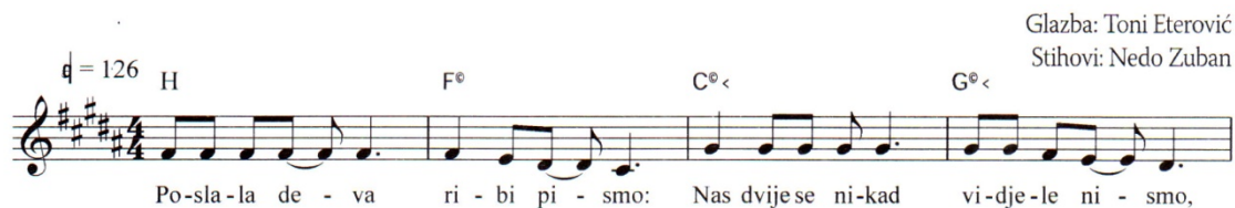
Primjer 10. Pjesma Devino pismo , t. 1-4