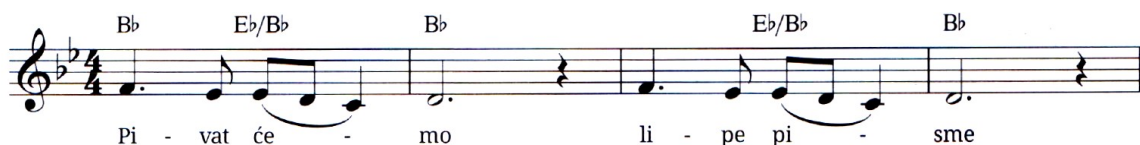
Primjer 103. Pjesma Svi veselo kite jelke , t. 1-4