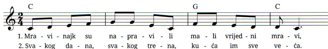
Primjer 89. Pjesma Mravi , t. 1-4