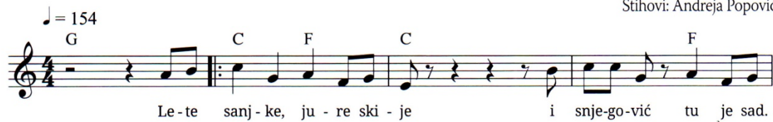
Primjer 101. Pjesma Bijela sreća , t. 1-4

Glazba: Toni Eterović Stihovi: Andreja Popović