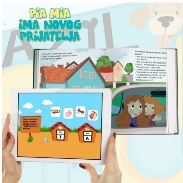
Slika 2 Slikovnica Pia Mia

Interaktivna slikovnica Pia Mia prikazana je na slici 2. Slikovnica Pia Mia 13