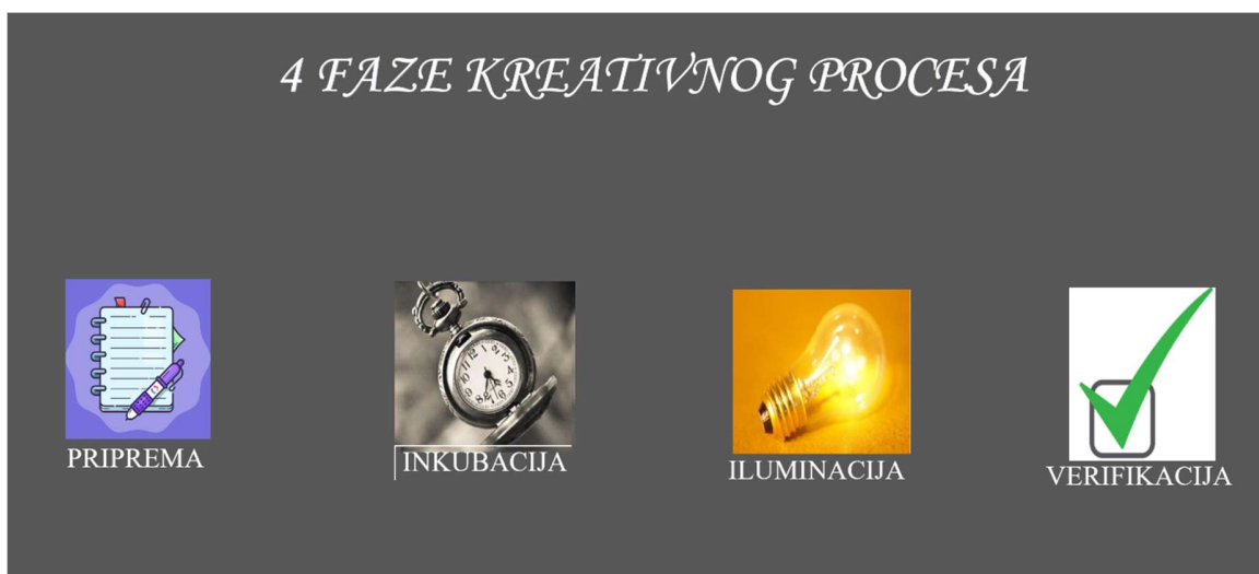
Slika 1. Faze kreativnog procesa

Četvrta faza: se naziva fazom verifikacije. U njoj se rješenje problema odnosno ideja oblikuje na način da se može na njoj dalje raditi i komunicirati ideju s okruženjem.