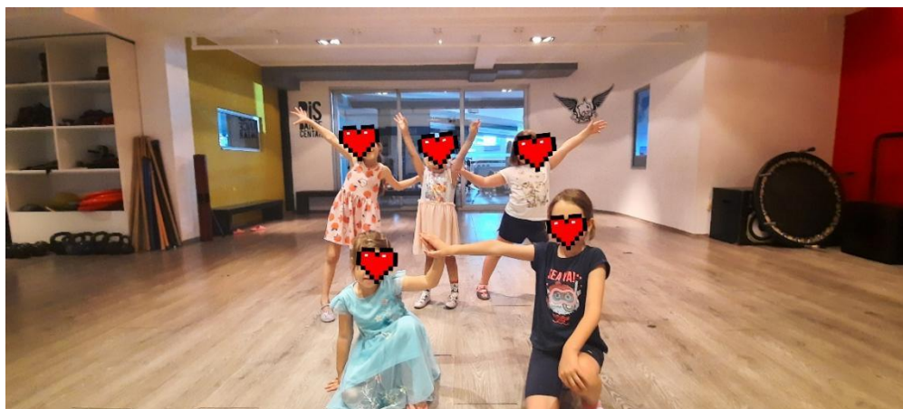
Slika 4. Plesna skupina RiS dance centar – RiSići (4-6. god)