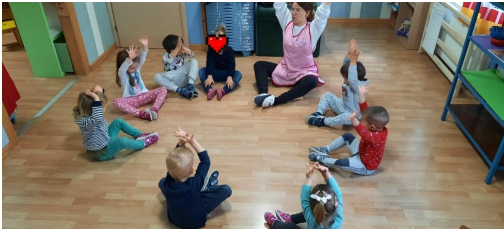
Slika 10. Provođenje plesne aktivnosti u vrtiću

Voditelj plesnog odgoja mora sam potaknuti djecu na pokret, zatim na ples koji odgovara njegovoj dobi, te stupnju složenosti pokreta. Jednostavni plesni elementi se uvode u rad s djecom predškolske dobi na njima pristupačan način, a može započeti od njihove treće godine života. Prilikom rada važno je poznavati psihofizičke osobine, njihove sklonosti i mogućnosti. (Virant, 2011),