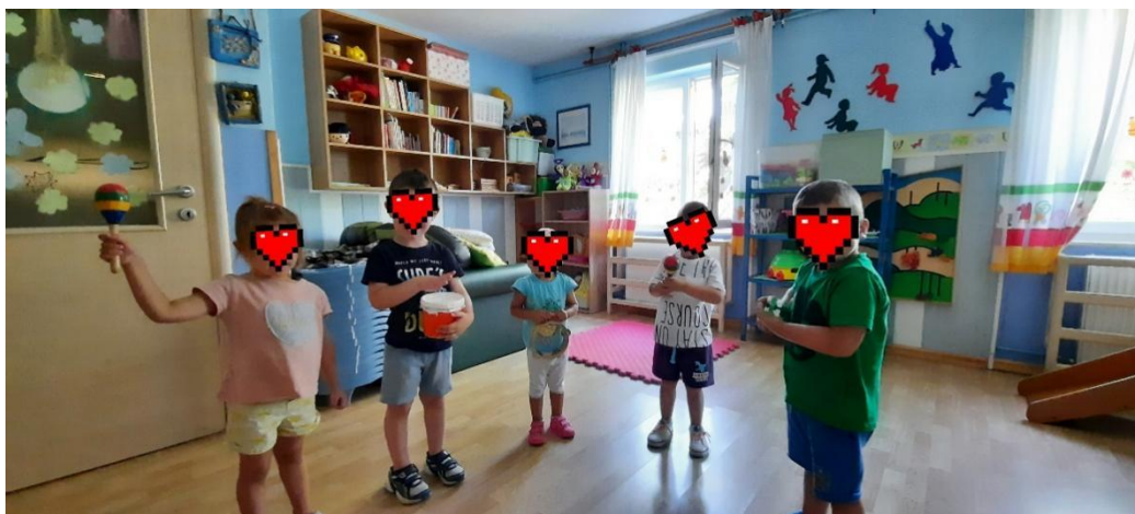
Slika 9. Mali orkestar