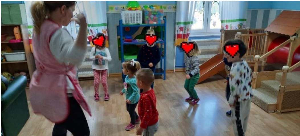
Slika 8. Izvođenje vlastitog talenta u praksi – djeca plešu