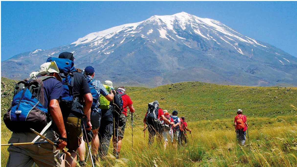
Slika 1. Prikaz ekspedicije planinarskog turizma