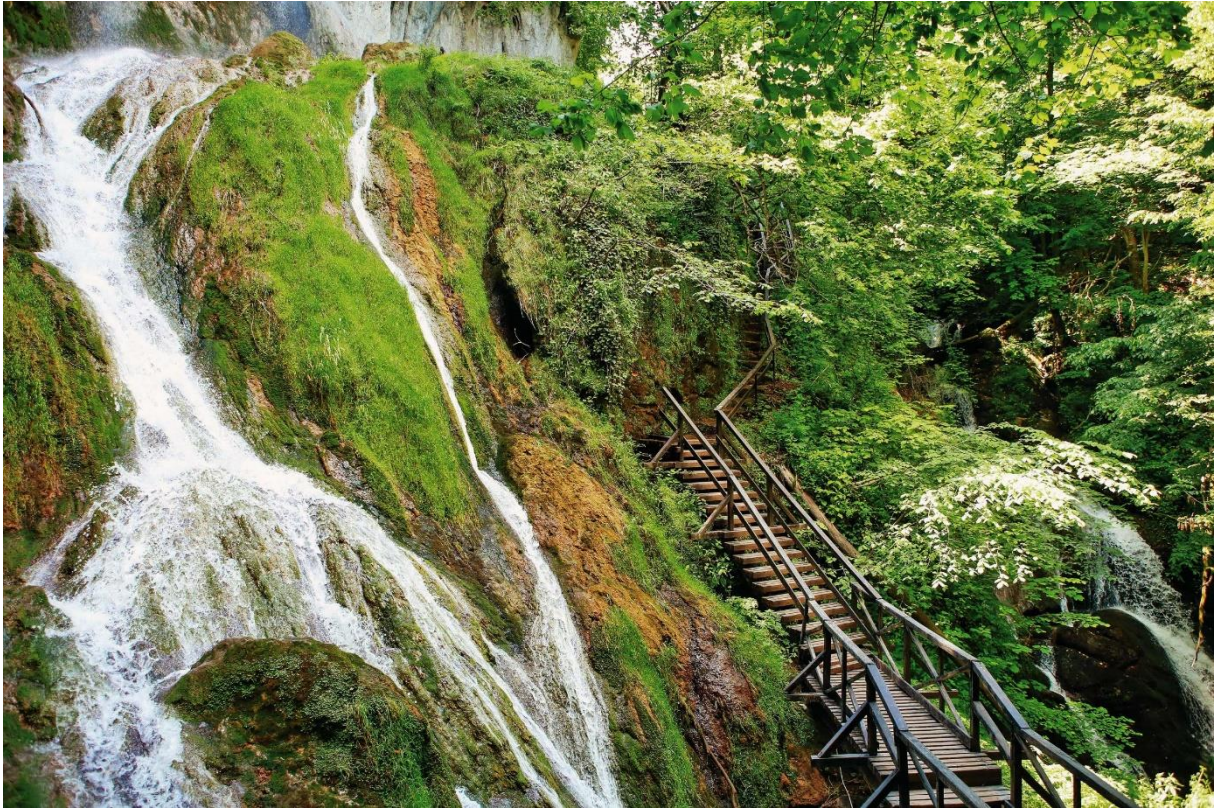
Slika 4. Ljepote planina i prirodnih izvora parka Prirode Papuk