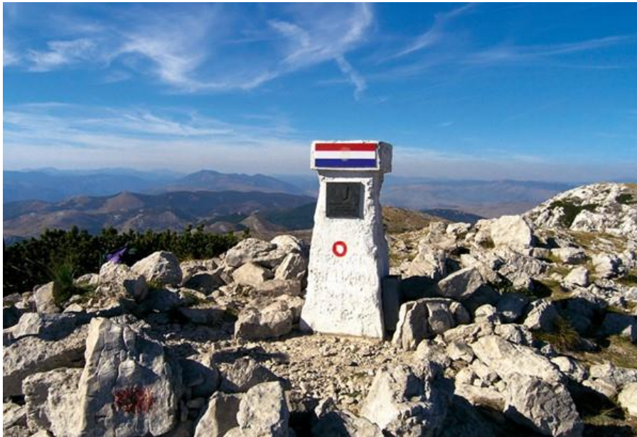
Slika 2. Planinarski žig na najvišem vrhu Dinare