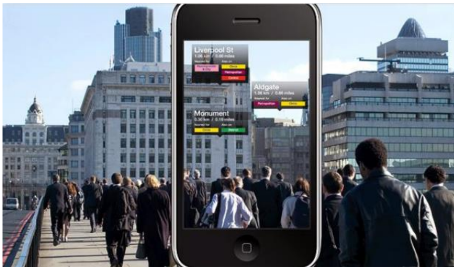
Slika 9. Aplikacija Nearest Tube