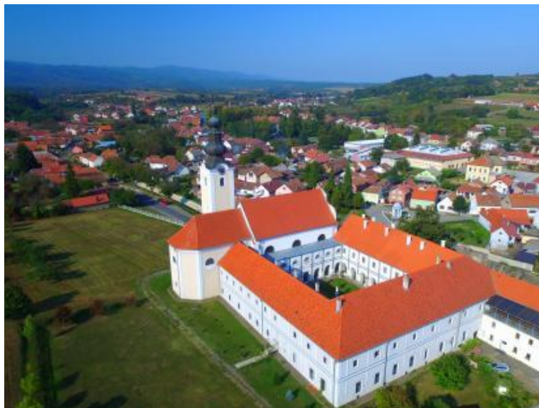
Slika 3. Franjevački samostan Cernik