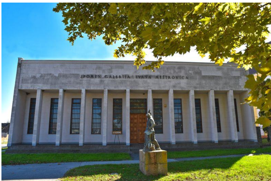
Slika 6. Spomen galerija Ivana Meštrovića