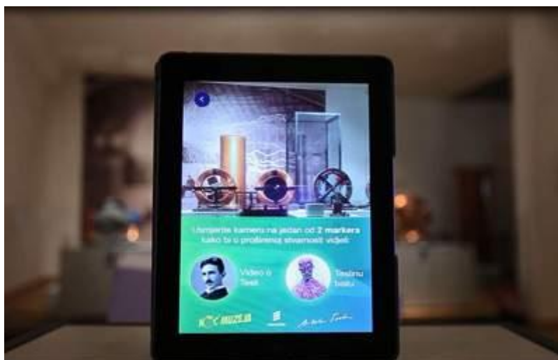
Slika 8. Proširena stvarnost u muzeju