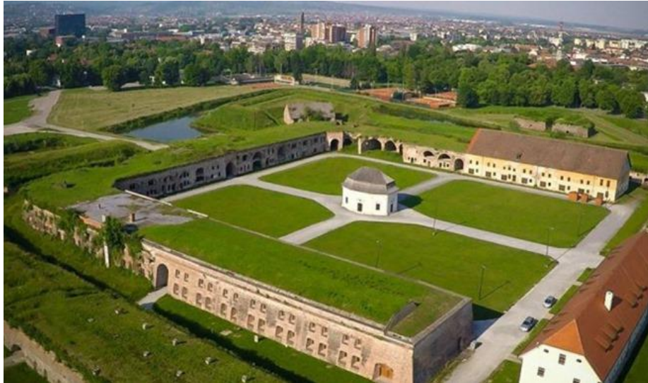
Slika 5. Tvrđava u Slavonskom Brodu