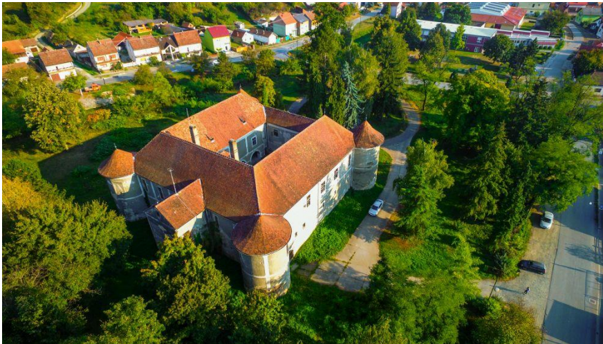
Slika 4. Kulmerov dvorac