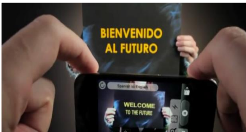
Slika 10. Aplikacija Word Lens

Izvor: 10 AR best practices in tourism, file:///C:/Users/COMP/Downloads/10-AR-Best-Practices-in-Tourism.pdf (11.07.2021.)