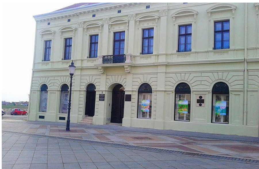
Slika 7. Dom Ivane Brlić Mažuranić