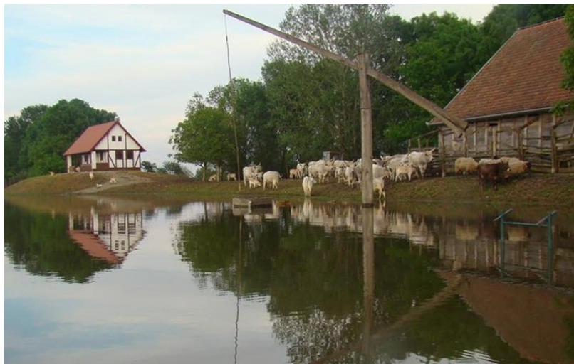
Slika 2. Gajna Oprisavci

Ovaj tipični slavonski prisavski pašnjak oplemenjen močvarnom florom i faunom, koji ima status zaštićenog krajolika, se nalazi istočno od Slavanskog Broda, kod sela Oprisavci i Poljanci. Na Gajni se nalazi više aluvijalnih depresija u kojima se zbog proljetno-jesenskih poplava zadržava voda čime se obnavlja vodeni biljni i životinjski svijet bara, što tehnički pospješuje postojanje lateralnog kanala koji Gajnu presijeca u zapadnom dijelu te vodu skupljenu na Dilj gori odvodi u Savu odnosno u bare Gajne.