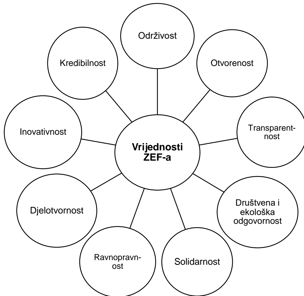
Grafikon 3. Temeljne vrijednosti Zadruga za etičko financiranje

Izvr: vlastita izrada prema podacima dostupnim na: https://zef.hr/hr/o-nama/o-zef-u (pristupljeno: 23.5.2021.)