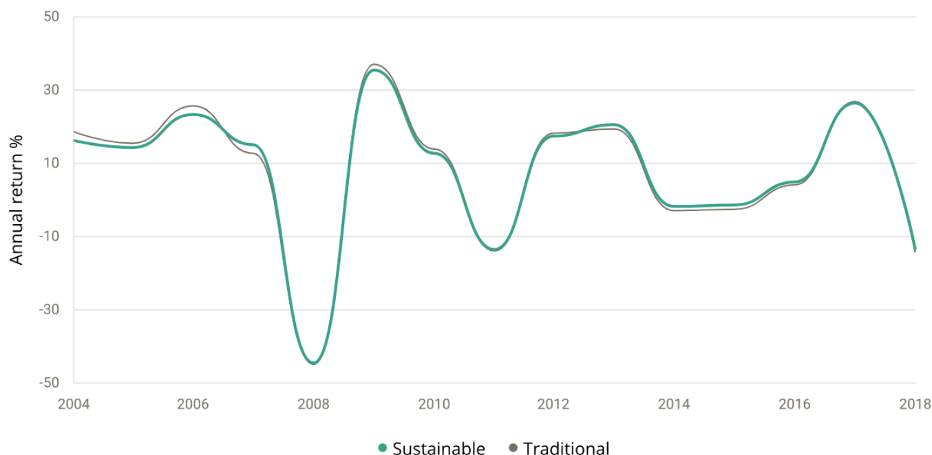
Grafikon 1. Usporedba povrata fondova u tradicionalnih i održivih banaka