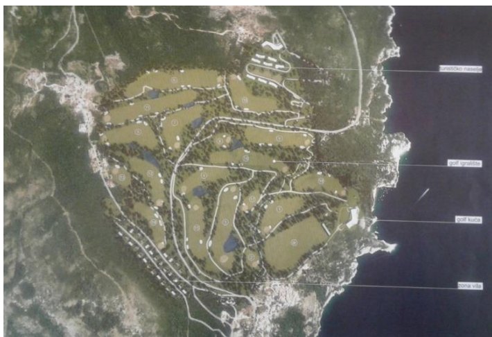
Slika 7.: Golf resort Brseč