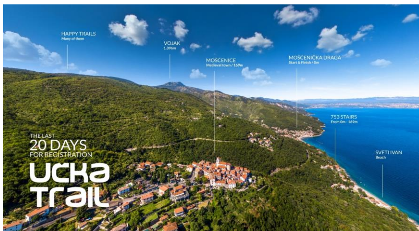
Slika 6.: Promotivni plakat Učka Trail, 2019

planinarskom stazom iz Brseča, šumskom cestom iz sela Zagore ili iz Sv. Jelene. Uživati u svim blagodatima Parka prirode Učka atrakcija je pogleda i uzdaha. 42