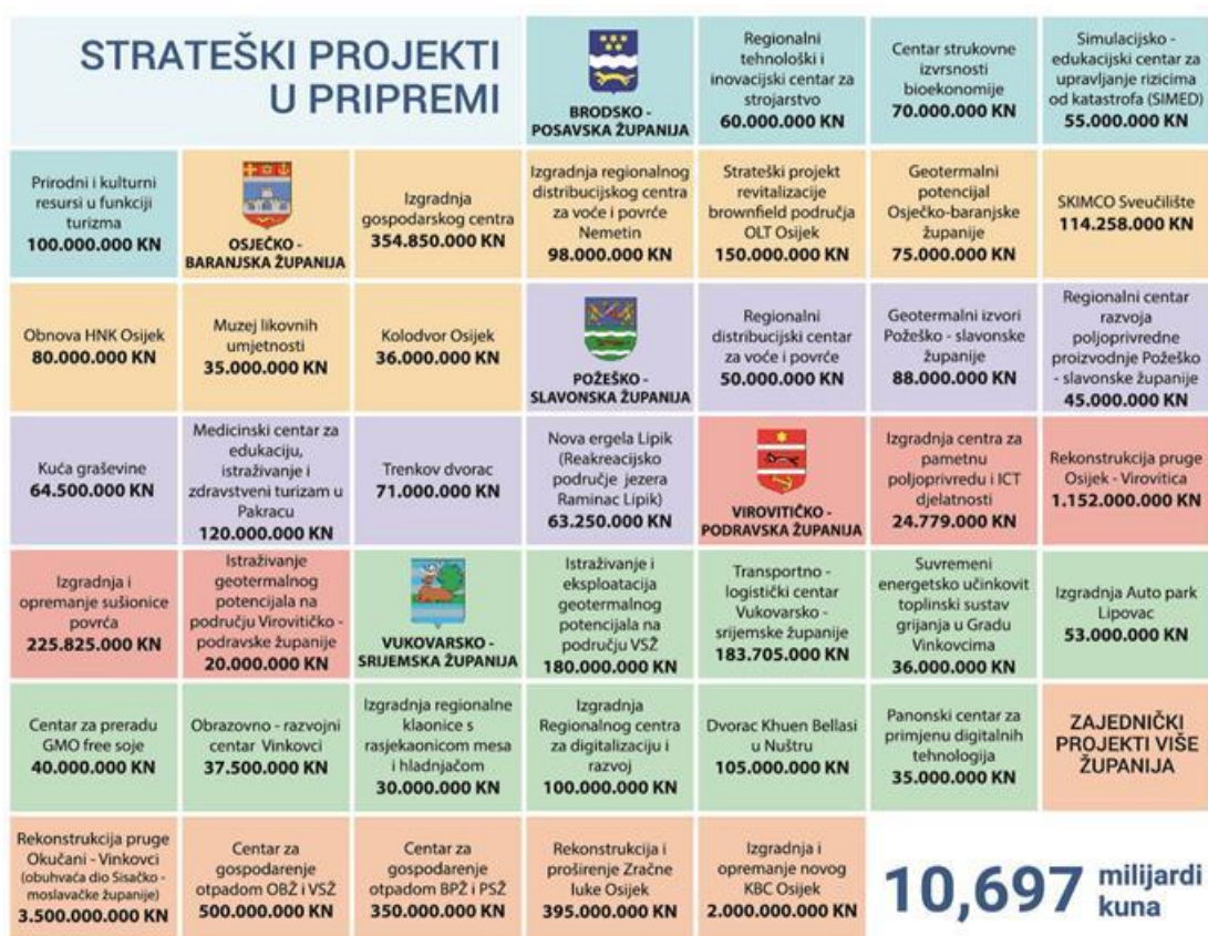
Slika 4. Strateški projekti u pripremi