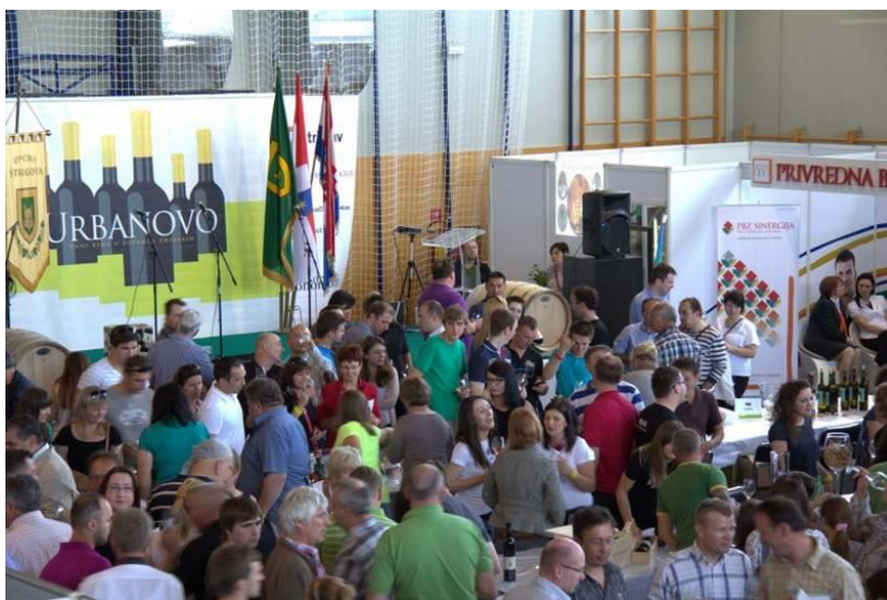
Slika 15: Urbanovo

Prema tome, uz stalni porast izlagača i posjetitelja, Urbanovo danas uz partnerstva i suradnju s drugim županijama i vinskim regijama Hrvatske (dosada Zadarska, Istarska, Primorsko-goranska, Osječko-baranjska i Zagrebačka) označava manifestaciju od državnog karaktera i značaja. Pomoću stranih ulagača iz Slovenije, Austrije i Mađarske manifestacija širi svoj utjecaj preko granica Hrvatske.