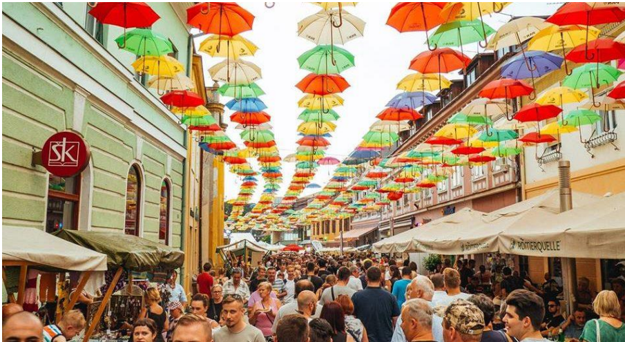
Slika 14: Porcijunkolovo

moгу sudjelovati u edukativnim radionicama starih zanata, streličarstvu i uličnim glazbenim nastupima. Primjer toga može biti atraktivna prezentacija mlaćenja žita, Kulturno umjetničkog društva Mačkovec, ručno mlaćenje požetog žita i odvajanje zrnja od klasja. Posjetitelji mogu vidjeti, s jedne strane težak, zahtjevan i dug postupak, a s druge uživanje u druženju, radu i povezanosti među susjedima kojeg danas rijetko ima.