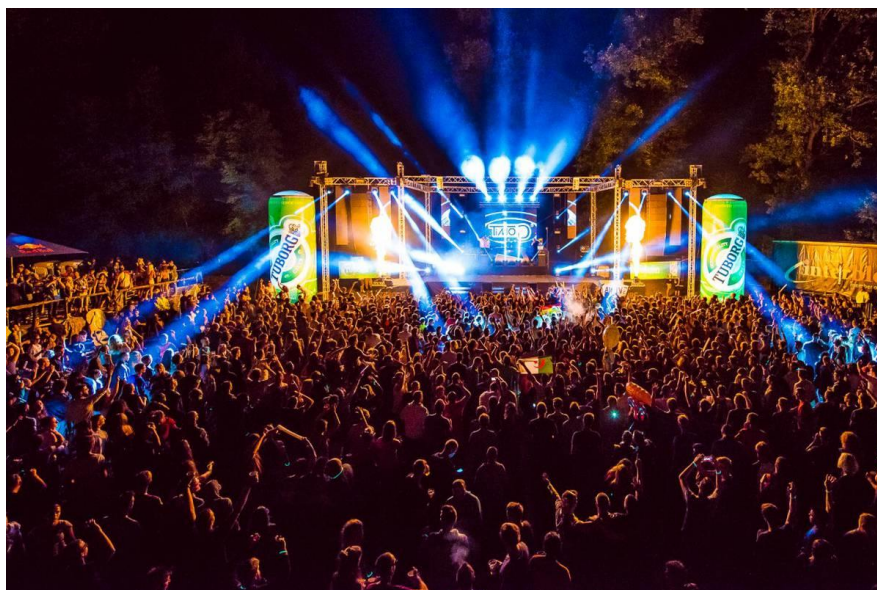
Slika 16: Forestland