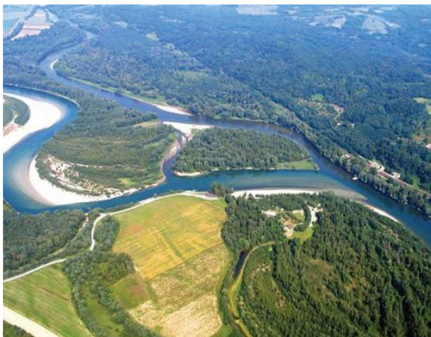
Slika 3: Regionalni park Mura – Drava

Kada se govori o zaštićenom području, Međimurje ih ima nekoliko. Najvažniji je prirodni zaštićeni prostor Regionalni park Mura – Drava. Zbog svoje visoke biološke raznolikosti i bogate prirodne baštine, park je dio UNESCO-va rezervata biosfere od 2012. godine. 66