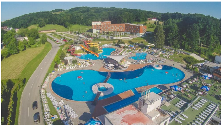
Slika 9: LifeClass Terme Sveti Martin

kvalitetnu uslugu i zadovoljstvo gosta kao „Prvi Healthness resort u Europi“. 79 Danas Resort ima ponudu Apartmana Regina sa 120 apartmana. Od 2009. Resort nudi smještaj u Hotelu četiri zvjezdice „Terme Sveti Martin“ sa kapacitetom od 320 ležajeva, od njih 151 su moderno opremljeni i 6 suite-a. Resort, osim opuštanja i aktivnog odmora, nudi kongres i team building uz autohtoni gurmanski doživljaj te prekrasnu zelenu prirodu. Smješten je u zaštićenoj prirodi gornjeg Međimurja, u blizini urbanih središta, događaja, festivala i znamenitosti.