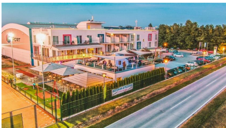
Slika 13: Hotel Panorama

Hotel Panorama*** se nazali uz najveće akumulacijsko jezero u Hrvatskoj. Otvoren je cijele godine koji pruža sve što je potrebno za aktivan odmor, opuštanje te gastronomski užitak. Uz hotel otvoren je i sportsko-rekreacijski centar DG Sport koji nudi sportske sadržaje za goste hotela i posjetitelje. Hotel je orijentiran na obitelj, sport te najmlađima nudi dječje igralište uz ljetnu terasu hotela. Cilj im je postati mjesto susreta za sve generacije. 83