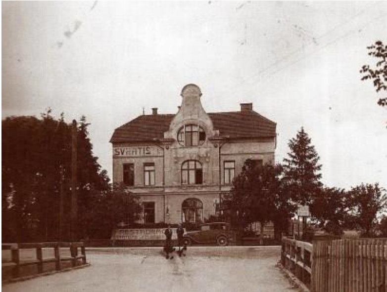
Slika 5: Hotel Bahnhof u Čakovcu

prvom katu bili stanovi te u prizemlju trgovina. Sve do 1990. godine, zgrada hotela bila je neiskorištena i u lošem stanju, kada je srušena i postala ugostiteljski objekt Royal koji je pružao usluge noćenja te bio diskoklub. 74