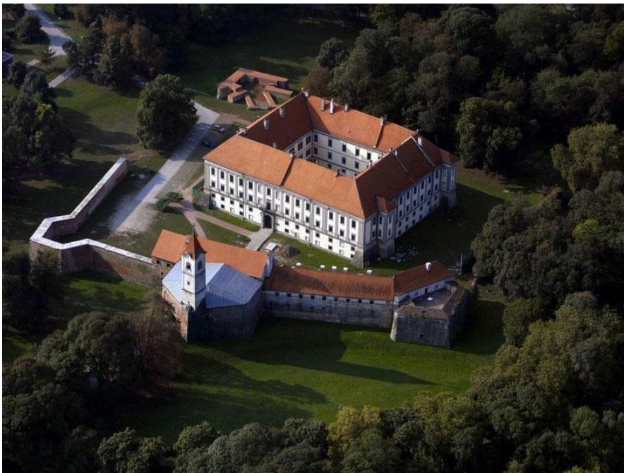
Slika 4: Stari grad Zrinskih u Čakovcu

Nadalje, potrebno je spomenuti i kulturnu baštinu. Ministarstvo kulture, u svom registru kulturne baštine, zabilježilo je, 2017. godine, 67 materijalnih kulturnih baština. Od toga nacionalno najznačajnije su tri lokacije Stari grad u Čakovcu, kapela sv. Jelene u Šenkovcu te crkva sv. Jeronima u Štrigovi, zatim 54 zaštićena kulturna dobra od kojih su dva pokretna Muzej Međimurja u Čakovcu i Muzej Croata insulanus u Prelogu, te deset preventivno zaštićena kulturna dobra. 68