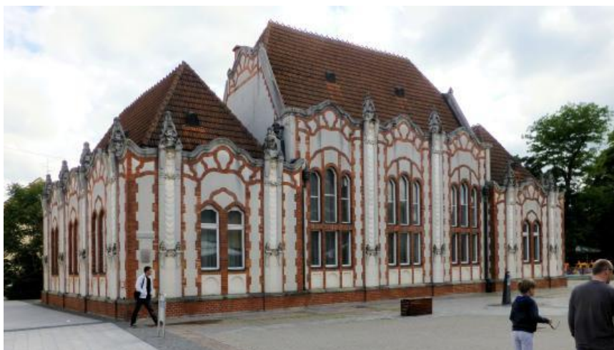
Slika 7: Prvi trgovački kazino, danas zgrada Sindikata, u Čakovcu