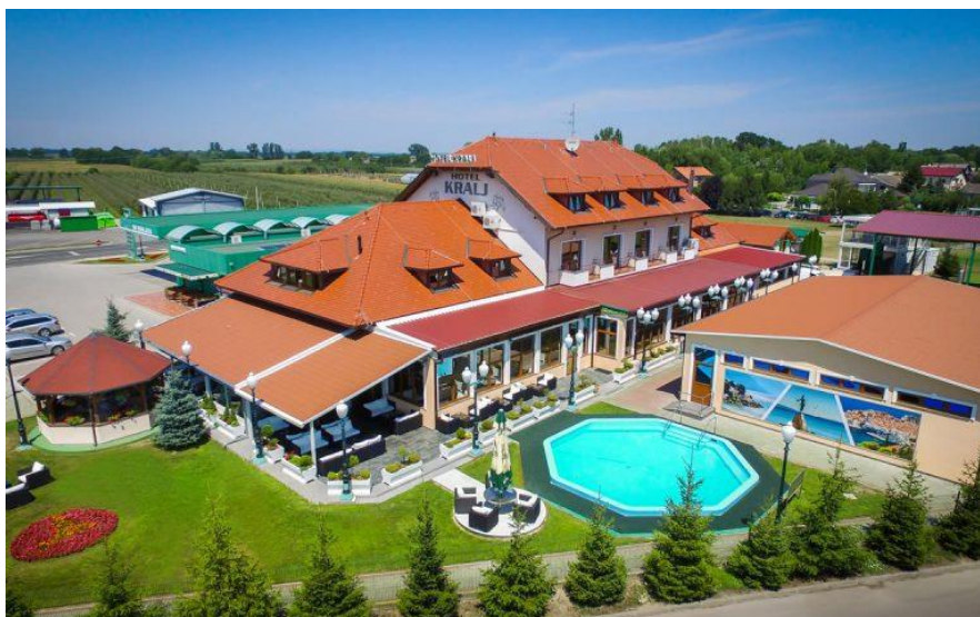
Slika 11: Hotel Kralj u Donjem Kraljevcu