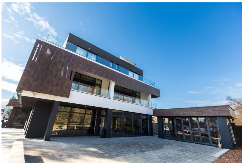
Slika 10: Business & City break Hotel Castellum**** u Čakovcu

Izvor 10: http://www.visitmedimurje.com/images/Castellum.jpg (23.07.2021.)