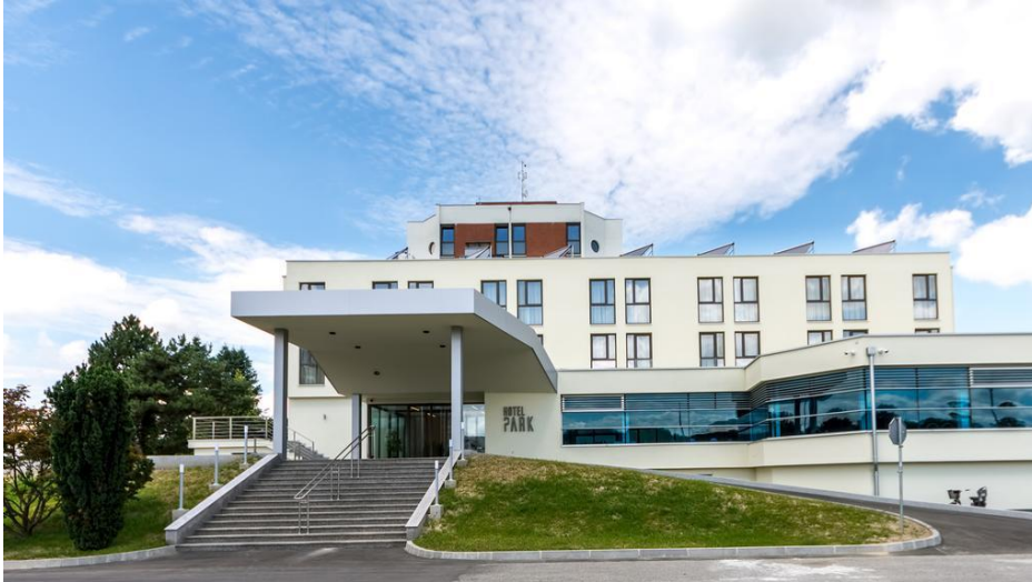
Slika 6: Hotel Park u Čakovcu

barom, frizerskim salonom i praonicom roblja. Nalazi se u blizini Starog grada Zrinski i centra Čakovca. Isto tako, mjesto je održavanja različitih manifestacija, svadbenih svečanosti, seminara i savjetovanja, maturalnih večeri te drugih kulturno-zabavnih priredbi. 76