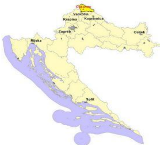
Slika 1: Položaj Međimurske županije u Hrvatskoj