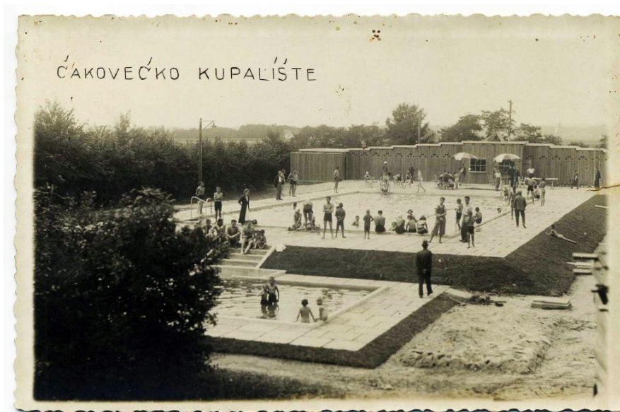
Slika 8: Čakovečko kupalište