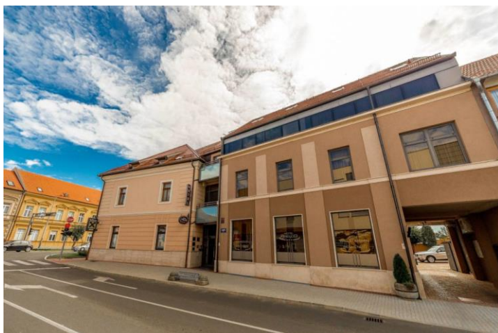
Slika 12: Hotel Prelog