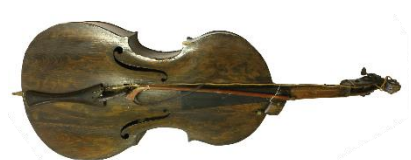
Slika 9. Bajs i gudalo

Bajs je glazbalo koje zvuk proizvodi gudalom. Prema Marušić (2021) bajs: „ima dvije žice od govedih crijeva, ugođene u kvintama. Od ostalih se gudačkih glazbala razlikuje po obliku i ulozi konjića . Funkciju dušice kod bajsa ima produženi dio jedne strane konjića, tj. nožica koja se spušta kroz četvrtasti otvor na glasnjači i seže do dna trupa. S obzirom na veličinu i stranu produžene nožice razlikuju se bajsevi oblika viola da gamba s produženom nožicom na desnoj strani te bajsevi oblika violončela, s produženom nožicom na lijevoj strani.“