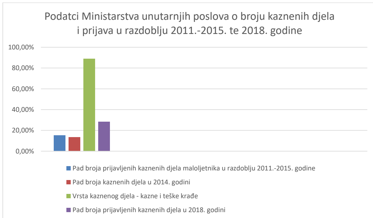
Grafikon 2. Podatci Ministarstva unutarnjih poslova o broju kaznenih djela i prijava u razdoblju 2011.-2015. te 2018. godine. Vlastita izrada.