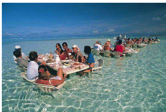
Slika 20. Bora Bora, Francuska Polinezija

U novije vrijeme kombiniraju se restorani sa svojom gastronomskom ponudom i užici boravljenja u vodi na pješčanoj plaži. Taj novi aspekt turističke ponude se može konzumirati na Bora Bori u Francuskoj Polineziji (gost može objedovati napola uronjen u Bora Bora's Ocean Restaurant ), odmaralištu Jumeirah Dhevanafushi na Maldivima (posjetitelju nudi mogućnost sjedenja u pješčanoj sofi ) i na plaži Michanwi Pingwe u Zanzibaru (gost može objedovati na vrhu stijene u restoranu Rock koji je okružen morem) (TravelRepublic, 2016).