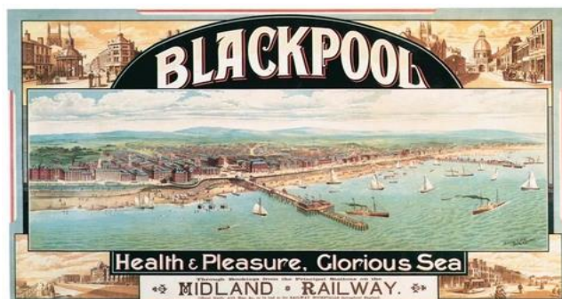
Slika 1. Blackpool

doba (1901. – 1910.), ljetovališta su postala javno dostupna i vrlo popularna (Taylor, 2017). Zakonski akti, kao što su Zakon o tvornicama iz 1850. (dopuštanje slobodnih subotnjih popodneva radnicima) i Zakon o državnim praznicima iz 1871. (opće odobravanje slobodnih dana), omogućuju slobodno vrijeme ostaloj radnoj snazi te poboljšavaju njihove životne uvjete. Sredinom 19. stoljeća plaža kao lijek, namijenjen aristokratskoj eliti, industrijalizacijom i boljim prometnim povezivanjem zamijenjena je plažom užitka i razonode. Godine 1850. engleski grad Blackpool se etablirao kao odmaralište za sve klase (Inglis, 2000: 50). Od mjesta hidroterapije plaža se pretvara u mjesto dokolice, rekreacije i relaksacije da bi na kraju postala mjesto za odmor od posla i svakodnevice.