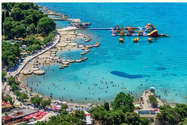
Slika 12. Plava plaža, Vodice

Velik broj plaža na hrvatskom Jadranu prikladan je za cijelu obitelj. No ipak, postoje neke plaže koja su zbog svojih ljepota i ponuda u prednosti. Tako se ističu Zlatni rat, Zaton kraj Zadra, Kraljičina plaža (Nin), plaže okolo Opatije i Crikvenice, Bačvice (Split) itd. Plaže koje su pogodne za djecu i neplivače nalaze se u Loparu, Medulinu, Omišu i dr. Naturističke plaže najviše se nalaze u Istri i Kvarnerskom zaljevu. Naturističke plaže graniče izravno s naturističkim kampovima (Koversada između Poreča i Rovinja te Bunculuka u Baškoj na Krku). Na mnogim mjestima nalaze se podijeljene plaže (naturističke i obične). Dobar primjer je Zlatni rat i plaža Borik na Lošinju (Best of Croatia, 2021).