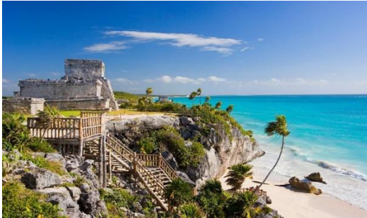
Slika 22. Ruševine Maja, Tulum, Meksiko

Svaka plaža ima svoju vlastitu povijest, pa tako ima i Tulum u Meksiku gdje se mogu istražiti drevne ruševine Maja. Istaknute su još i plaže na Malti (olupine brodova iz Drugog svjetskog rata), plaža s ruševinama Olympos u Antaliji (Turska), drevni kipovi Uskršnjih otoka u Čileu, Isla de Tabarca u Španjolskoj (nekad utočište gusara) i Cornwall u Engleskoj (istraživanje spilja koje su nekad bile poznato mjesto krijumčara čaja, rakije, džina, ruma i duhana) (TravelRepublic, 2016).