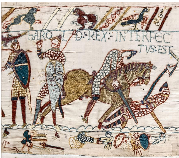
Slika 2. Prikaz Haroldove smrti na tapiseriji iz Bayeuxa. (Dostupno na: https://www.bayeuxmuseum.com/en/the-bayeux-tapestry/discover-the-bayeux-tapestry )