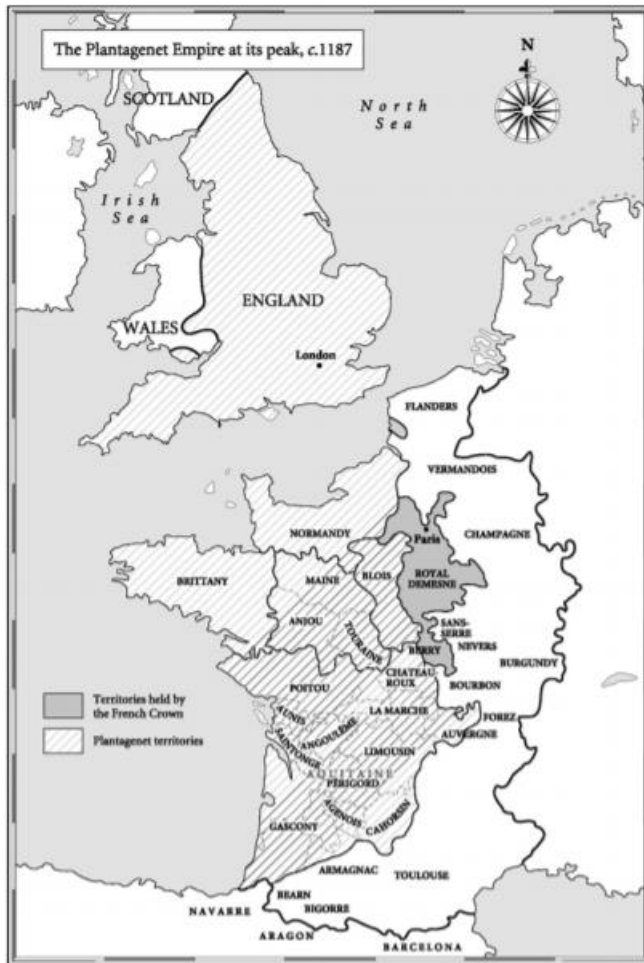
Slika 3. Područje nad kojim je vladao engleski kralj 1187. (Jones, Dan, The Plantagenets – The Kings Who Made England )