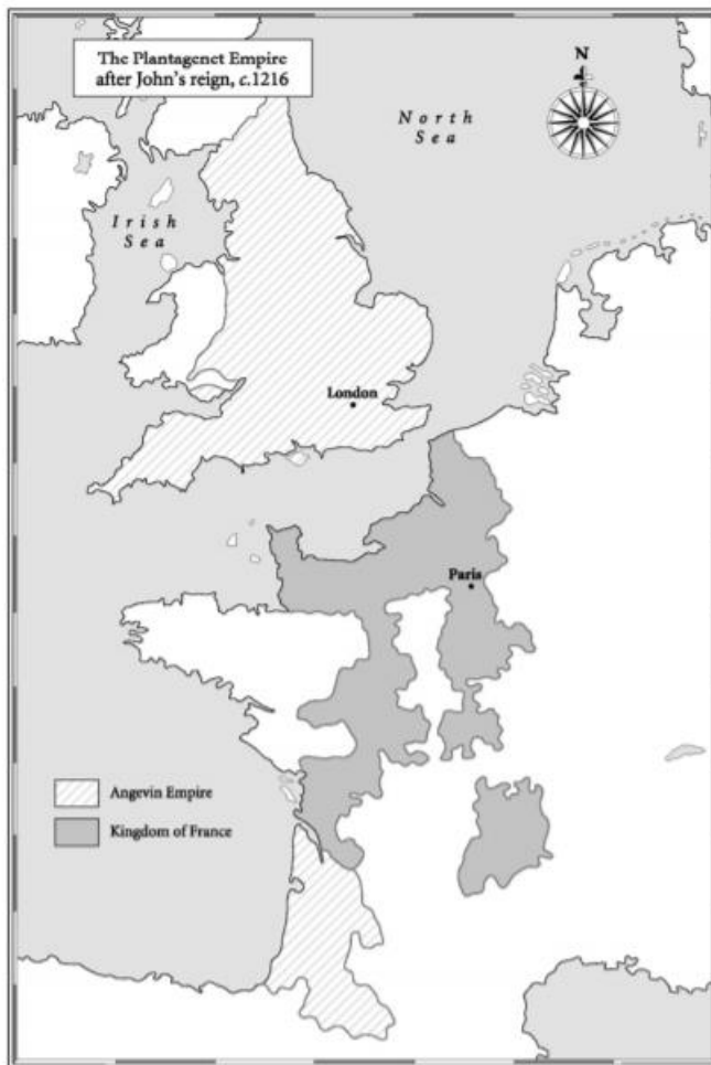
Slika 4. Područje nad kojim je vladao engleski kralj 1216. (Jones, Dan, The Plantagenets – The Kings Who Made England )