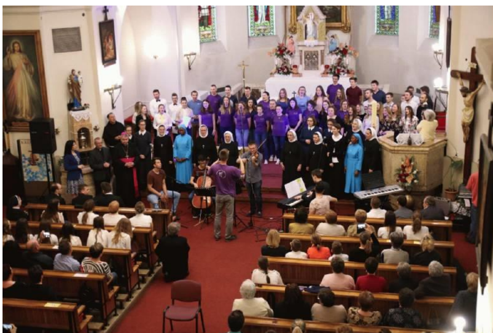
Slika 12. Festival Dobrog Pastira u Đurđevcu 2018. godine.

s obzirom na to da koncert putuje Biskupijom, realizaciji doprinose i župe domaćini. U koncertu uz zborove i sastave mladih redovito nastupaju solisti iz župnih i samostanskih zajednica te gosti izvođači. Osim koncerta, u sklopu Festivala slavi se sveta misa, a nerijetko se održavaju i predavanja, o čemu govori Igréc, u obliku svjedočanstva osoba koje su posvećene Bogu te laika koji Božje djelovanje prepoznaju u vlastitim životima 31 . Putovanje Festivala Dobrog Pastira pokazalo se pozitivnim među crkvenim zajednicama jer se događaj sa svim svojim pobožnim namjerama svake godine predstavlja drugoj župnoj zajednici te osobama koje vrlo vjerojatno ne bi bile na Festivalu da se nije održao u njihovoj matičnoj crkvi.