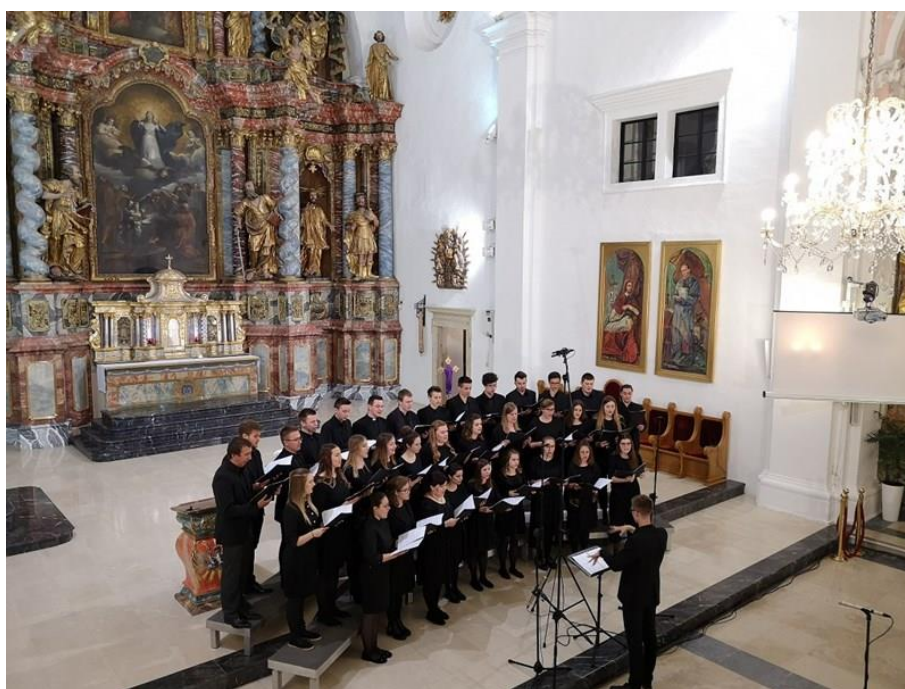
Slika 9. Zbor mladih Varaždinske biskupije u varaždinskoj katedrali 2019. godine.

Zbor mladih Varaždinske biskupije (Slika 9.), ujedno i prvi biskupijski zbor mladih u Hrvatskoj, osnovan je 2005. godine na inicijativu vlč. Damjana Korena, tadašnjeg predstojnika biskupijskog Ureda za pastoral mladih i njegovih suradnika. On ne nosi titulu katedralnog zbora, djeluje kao dio Ureda za pastoral mladih, a njegova djelatnost vrlo često se odnosi i na sudjelovanje u katedralnim svečanostima. Zbor čine srednjoškolci, studenti i radnička mladež koja je aktivna u vlastitim župama širom Biskupije, a u zboru se okupljaju da bi animirali