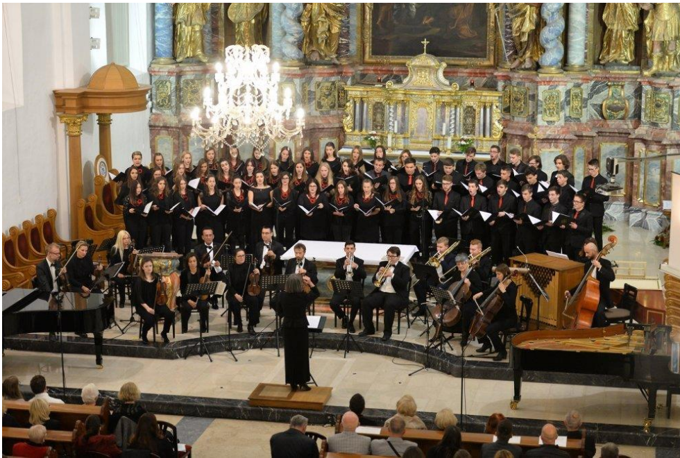
Slika 10. Mješoviti zbor učenika Glazbene škole u Varaždinu u varaždinskoj katedrali na Varaždinskim baroknim večerima 2018. godine.

dvoranama i dvorcima. Barokne večeri doduše nisu namijenjene susretima zborova, već svim izvođačima barokne glazbe među koje ubrajamo i izvođače s varaždinskog područja. Tako Maričić govori o redovitom sudjelovanju varaždinskih instrumentalnih ansambala, kulturno-umjetničkih društava, amaterskih zborova, te školskih zborova osnovnih i srednjih škola, a posebno o višegodišnjem sudjelovanju Djevojačkog i Mješovitog zbora Glazbene škole u Varaždinu (Slika 10.). 20