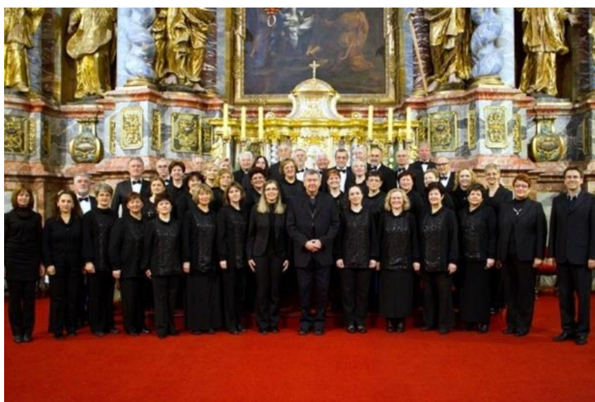
Slika 6. Zbor varaždinske katedrale Chorus liturgicus u varaždinskoj katedrali 2012. godine.