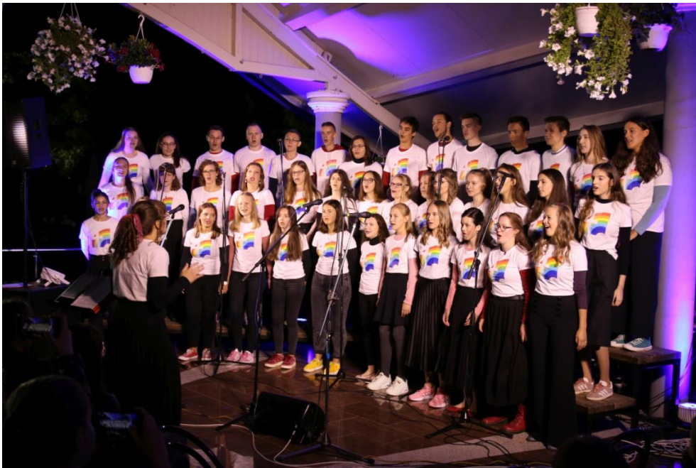
Slika 14. Festival duhovne glazbe Duga u Ludbregu 2021. godine.