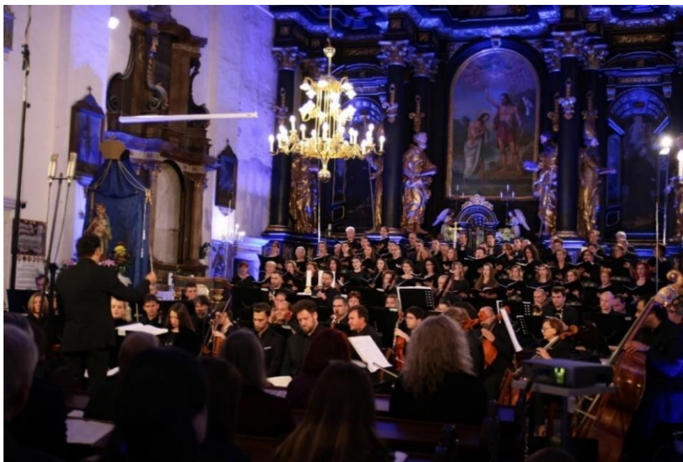
Slika 7. Mješoviti pjevački zbor Chorus angelicus u varaždinskoj katedrali 2019. godine.

da posljednjih godina zbor nastupa u okolici i regiji te u inozemstvu (Austrija, Mađarska, Izrael). 12 Chorus angelicus pjeva raznolik repertoar, a većinom su to djela glazbeno-umjetničkih velikana poput Monteverdija, Händela, Bacha, Vivaldija, Mendelssohna, Brucknera, Beethovena, Ruttera, Ramireza i Orffa. S obzirom na to da je voditelj zbora maestro Igrec izrazito plodonosan varaždinski skladatelj koji se vrlo često orijentira na skladanje zbornih djela, Chorus angelicus nerijetko izvodi i praizvodi upravo njegovo zbornsko stvaralaštvo. Zbor je 2016. godine u sklopu Varaždinskih baroknih večeri dobio Nagradu Ivan Lukačić za najviši izvođački domet ansambla za izvedbu Bachovog oratorija Muka po Ivanu . Prilikom izvođenja većih koncerata zbor najčešće surađuje s Varaždinskim komornim orkestrom, a uz njih nastupaju i mnogi poznati vokalni solisti. 13 Višegodišnje djelovanje zbora, kao i neki od najvećih projekata zabilježeni su na osam nosača zvuka: W. A. Mozart: Requiem (2009.), Velika nam djela učini Gospodin (2009.), Božić u varaždinskoj katedrali (2009.), Anđelko Igrec: Kyrie (2009.), Anđelko Igrec: Psalmi (2013.), Pjesme štovanja i hvale (2014.), Chorus angelicus - 20 godina (2019.) i Anđelko Igrec: Glasi veseli (2021.). 14