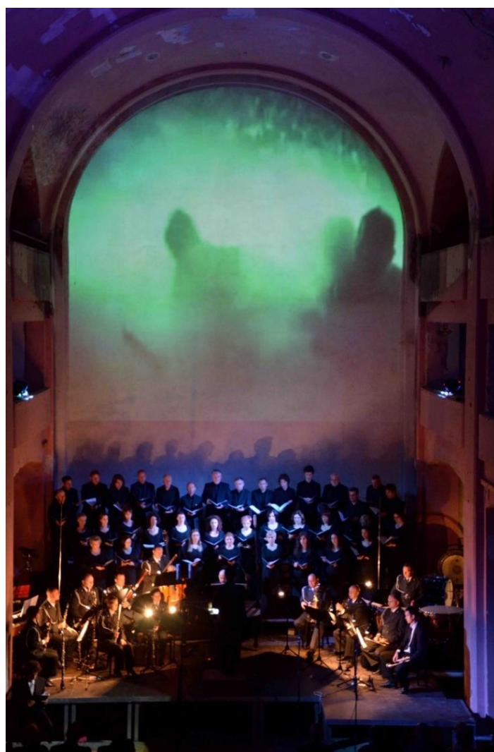
Slika 16. Izvedba oratorija Kralj David u bivšoj varaždinskoj sinagogi 2013. godine.