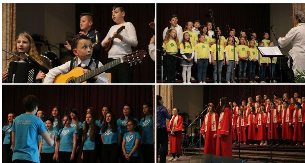
Slika 13. Zlatna harfa u Čakovcu 2019. godine.

natjecateljskog karaktera, no ubrzo se preoblikovao u susret dječjih zborova. Prvotni cilj odnosio se na promoviranje i oživljavanje u ono vrijeme nove hrvatske liturgijske pjesmarice Pjevajte Gospodu pjesmu novu (Zagreb, 1983.), koja je „priređena prema zahtjevima obnovljene liturgije, uz stroge književne, teološke i glazbene kriterije.“ 33 Redovitim održavanjem prošireni su i unaprijeđeni ciljevi zajedno s temeljnim zadaćama, pa tako Čirko opisuje cilj dječjeg zborskog pjevanja koji se temelji na čuvanju i širenju bogate liturgijske baštine, na uvježbavanju, njegovanju te stvaranju zdravih duhovnih popijevaka koje se mogu koristiti u bogoslužju, ali i u veselim slavljinama izvan njega. 34 Također napominje da Zlatnu harfu podržavaju biskupske konferencije i Vijeće franjevačkih zajednica te da Festival odobrava institut za crkvenu glazbu Katoličkog bogoslovnog fakulteta u Zagrebu. 35