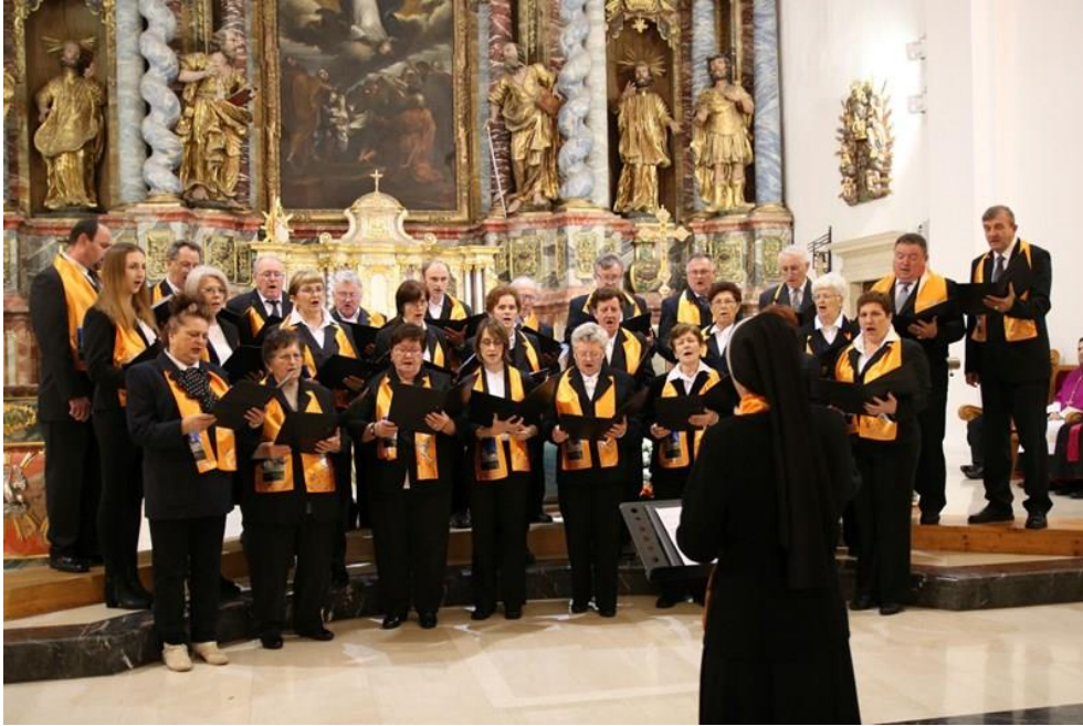
Slika 11. Festival svete Cecilije u varaždinskoj katedrali 2018. godine.