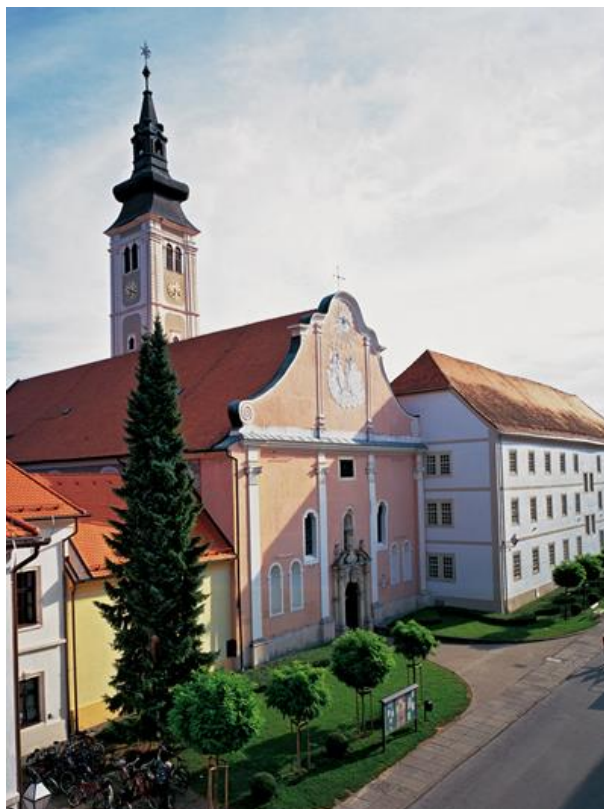
Slika 2. Katedrala Uznesenja Blažene Djevice Marije na Nebo.

U međuvremenu je osnovano još administrativnih crkvenih jedinica, vidljivih na karti Varaždinske biskupije (Slika 3.) pa danas Biskupija ima 105 župa raspoređenih u 12 dekanata: Bednjanski, Čakovečki, Đurđevački, Istočnovaraždinski, Ivanečki, Koprivnički, Ludbreški, Preloški, Štrigovski, Varaždinskotoplički, Virovski i Zapadnovaraždinski. Biskupiju od 2017. godine čine i tri arhiđakonata: Varaždinsko-zagorski, Međimurski i Podravski. 2 Spomenuti arhiđakonati, odnosno regije, simbolično su unijete u grb Varaždinske biskupije (Slika 4.) u obliku ljiljana koji se nalaze uz Dravu, najveću rijeku koja teče Biskupijom. Na grbu, štitastog oblika, nalaze se još dvije cjeline: dio grba mons. Marka Culeja, koji čine bijeli križ s inicijalima M. (Maria) i C. (Croatia) na plavoj podlozi, te dio grba grada Varaždina na kojem se nalaze crvene i bijele grede. 3