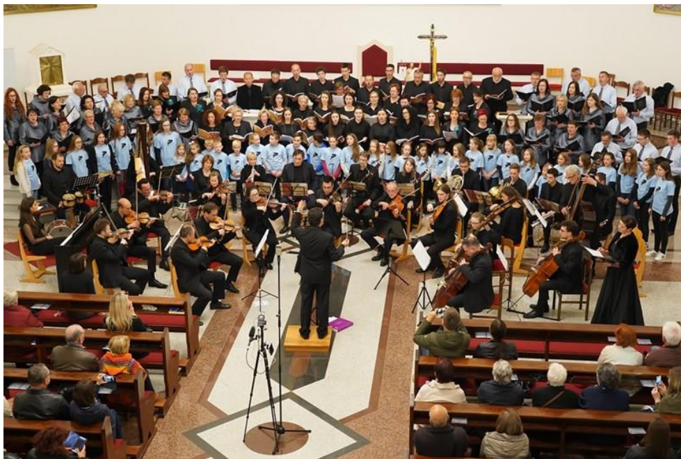
Slika 15. Koncert za Marijine obroke u Crkvi sv. Antuna Padovanskog u Čakovcu 2019. godine.

Godine 2015. održana su dva koncerta: prvi tradicionalno u Varaždinu, a nekoliko dana kasnije isti program je izveden u čakovečkoj Crkvi sv. Antuna Padovanskog. Dvostruki koncert u Varaždinu i Čakovcu (Slika 15.) ponovno se dogodio i 2019. godine.