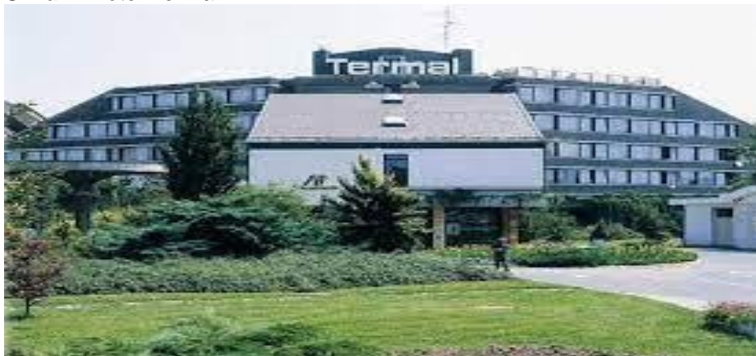
Slika 4. Hotel Termal