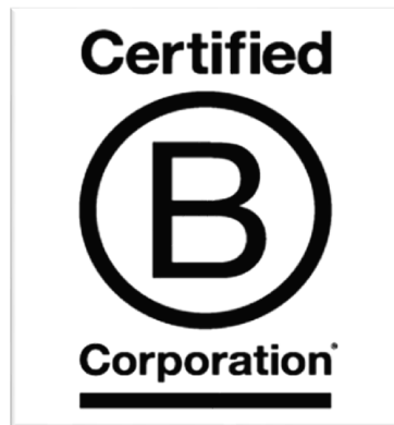
Slika 1. Oznaka certificirane B korporacije

vrijednosti i težnje zajednice B korporacija ugrađene su u Deklaraciju o međuovisnosti B korporacija koja se zaključno potpisuje kako bi kompanija službeno mogla dobiti svoj B Corp. certifikat. 4 Svoju prepoznatljivost mogu istaknuti i pomoću oznake koja izdvaja certificirane B korporacije od drugih. Ona je prikazana na slici broj 1.