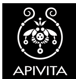
Slika 3. Logo Apivita

Apivita je certificirana B korporacija iz Grčke koja stvara prirodnu kozmetiku od prirodno dobivenih sastojaka. Njihova priča krenula je 1979. godine u Ateni gdje su dva mlada farmaceuta bila vrlo strastvena u promatranju svijeta pčela. Upravo zbog toga njihovo ime Apivita i označava „život pčele“, a također su tu priču nastavili i kroz logo na kojem se vidi kako dvije pčele u u saću čuvaju med, što se može vidjeti na slici broj 3.