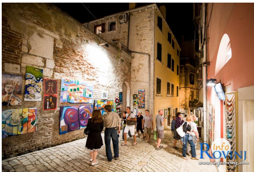
Slika 10. Izložba na otvorenome u ulici Grisia

umjetnici, ali i amateri i djeca. Smatra se da je izložba Grisia nastala zahvaljujući posjeti 120 američkih turista koji su 1966. doputovali iz Venecije u Rovinj brodom „Liburnija“. Turisti, razgledavajući Rovinj, zainteresirali su se za umjetnička djela rovinjskih autora te su kupili mnogo njihovih radova. Naime, Rovinj je već stoljećima poznat kao Grad umjetnika , s obzirom na to da veliki broj stanovnika čine slikari, kipari i drugi ljubitelji umjetnosti. Rovinjski umjetnici, ali i umjetnici iz drugih istarskih gradova, bili su potaknuti interesom američkih turista pa je 1967. organizirana prva Grisia , koja s vremenom postaje najpoznatija istarska izložba na otvorenome. Izložbu čine raznovrsna umjetnička djela, koja se izlažu na kućama i zidovima u ulici Grisia (sl. 10). Izložba je najtecateljskog karaktera, a sudjeluju u njoj ne samo rovinjci već i autori iz čitave Hrvatske te iz drugih država. 44 Grisia pridonosi promicanju rovinjske kulturne baštine i umjetnosti kao takve, a osim toga čini značajni dio turističke atrakcijske osnove Rovinja.