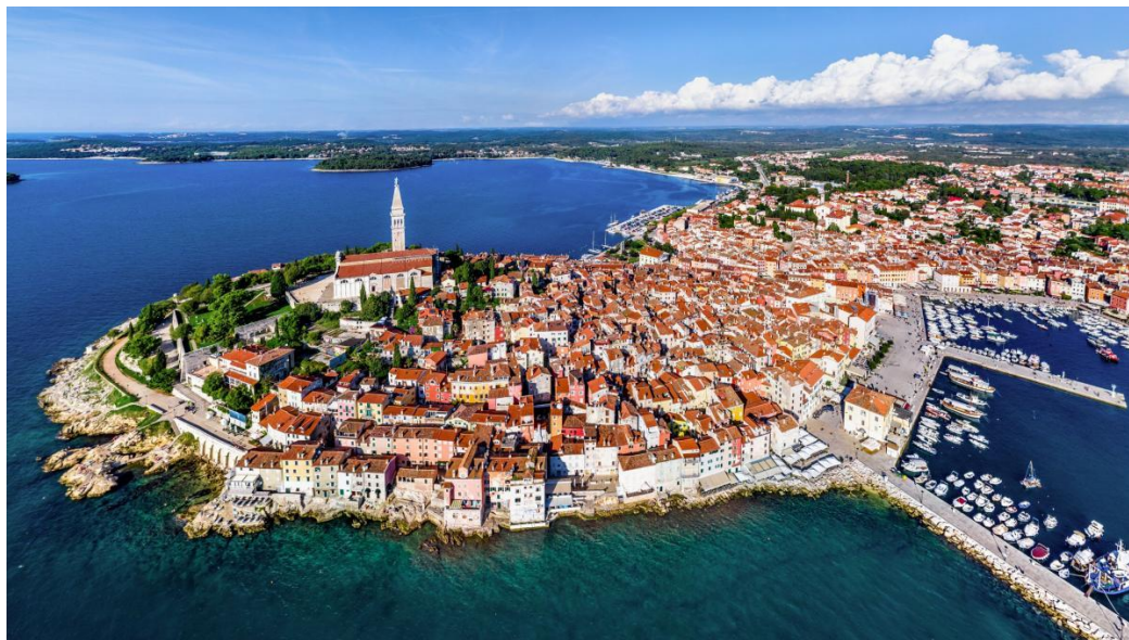
Slika 1. Panorama grada Rovinja

bogato kulturno-povijesno nasljeđe te predstavlja značajnu turističku destinaciju. Prema statističkim podacima u gradu živi preko 14.000 stanovnika. 2