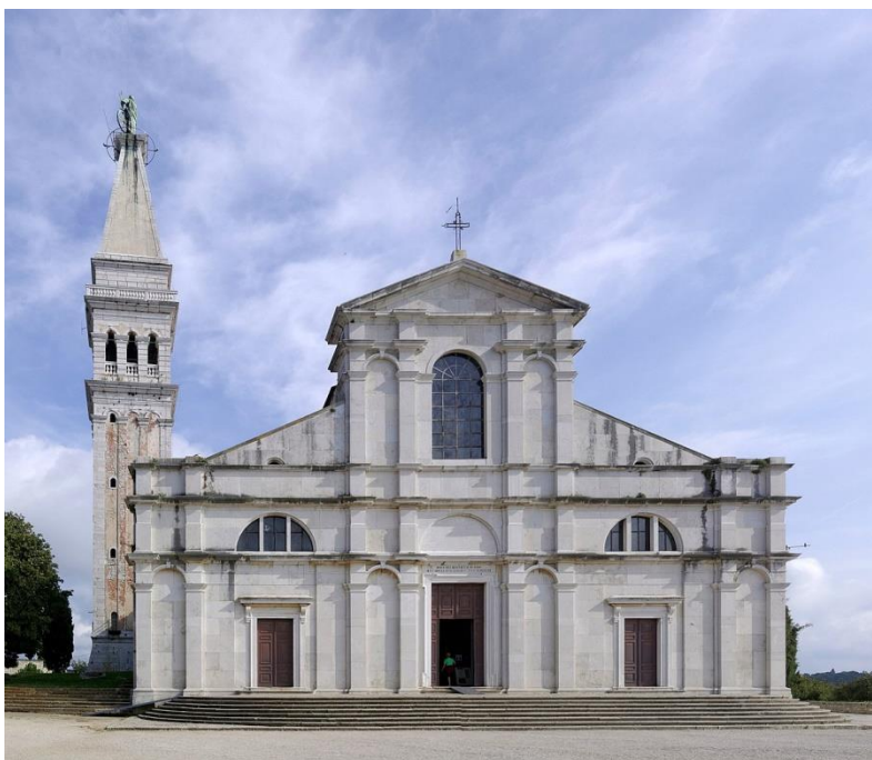
Slika 5. Zvonik i pročelje crkve sv. Eufemije