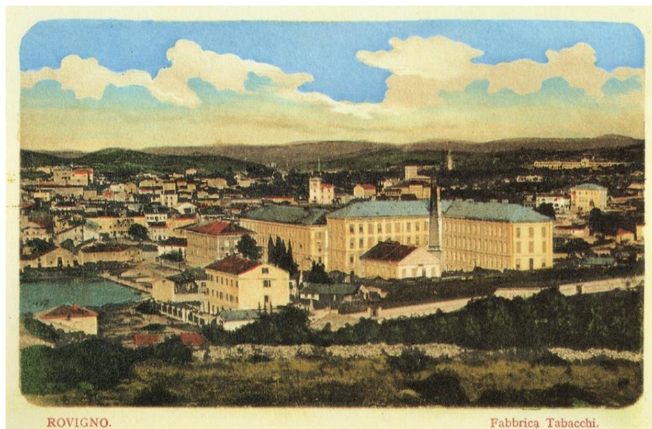
Slika 9. Tvornica duhana krajem XIX. stoljeća

ih godina XX. stoljeća postala vodeći hrvatski proizvođač i izvoznik cigareta. Proizvodnja uključuje marke cigareta Ronhill, Walter Wolf, Largo, Kolumbo, York i MC. U Kanfanaru je 2007. otvorena nova tvornica, a Hrvatska gospodarska komora – Županijska komora Pula dodijelila je tvornici Zlatnu plaketu za najuspješniju istarsku kompaniju. 42 Tvornica duhana, kao i ostali industrijski objekti s prijelaza XIX. i XX. stoljeća, predstavljaju značajan dio rovinjskog kulturnog identiteta. U Tvornici duhana bile su 1877. zaposlene 722 radnice. Krajem XIX. stoljeća su se rovinjske radnice u tvornici duhana i u tvornici sardina uključile u gospodarski i društveni život Rovinja. Tzv. tabakine i sardeline su postale dio rovinjske društvene stvarnosti pored ribara, pomorca, brodotsara i drugih društvenih slojeva. 43