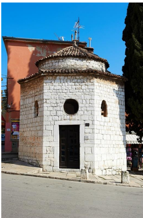
Slika 7. Crkva Presvetoga Trojstva