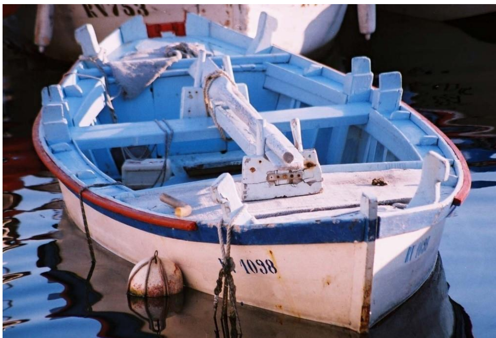
Slika 11. Batana viërta