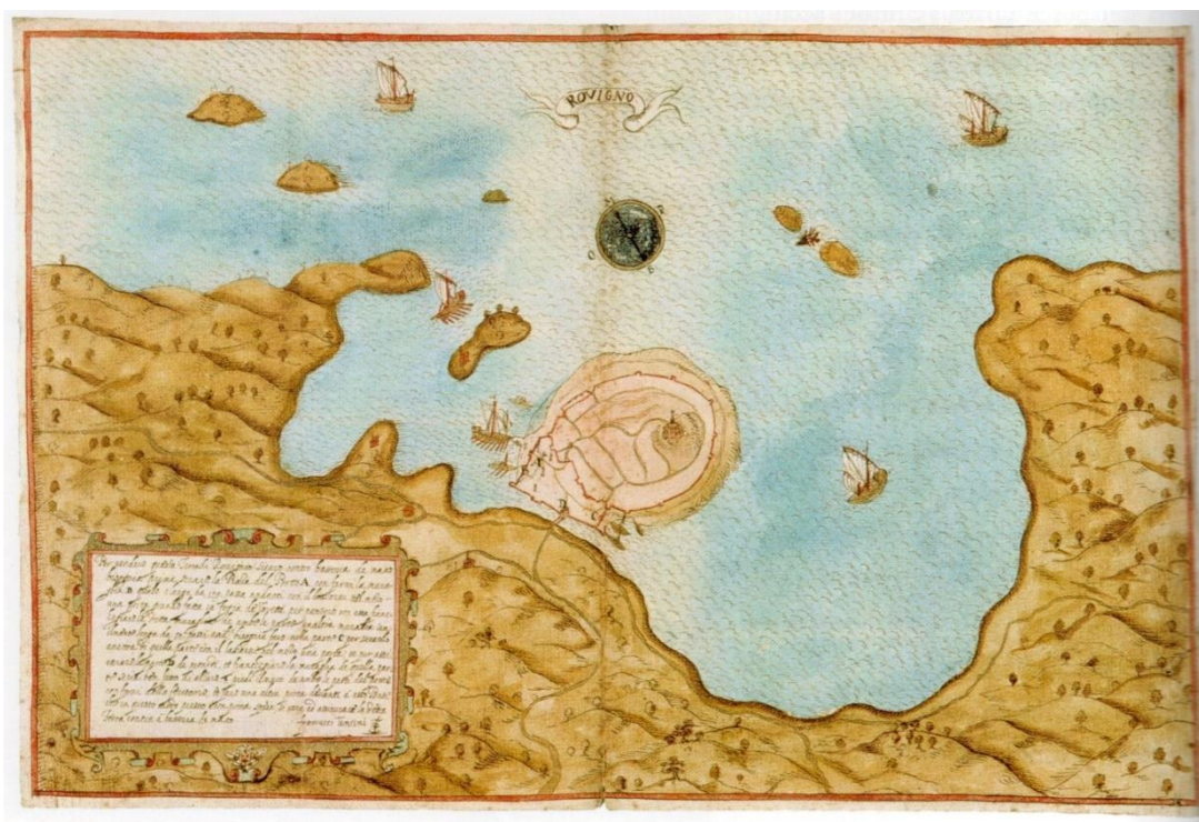
Slika 2. Rovinj 1619.

VIII. stoljeća. U periodu brojnih napada Slavena, Neretljana i Saracena, tadašnji Castrum Rubini postaje Ruigno, Ruginio ili Ruvigno. Rovinj pada pod bizantinsku vlast, kasnije pod vlast Longobarda te pod franačku vladavinu, a 966. je pripojen Porečkoj biskupiji. U razdoblju vladavine Mlečana stanovništvo Rovinja dijeli se na plemiće i pučane, nobili et popolani , a uz ribare i ratare javljaju se trgovci i mornari te se razvijaju brojni zanati. U ovom razdoblju Genova opusje tošila Rovinj te otela tijelo sv. Eufemije, koje je vraćeno tek 1401. U srednjem vijeku je Rovinj također doživio epidemiju kuge te pustošenje od strane uskoka 1579. i 1599. Unatoč tome, u tom se razdoblju povećava broj stanovnika Rovinja. Izbjeglice iz središnje Istre, Bosne, Dalmacije, Grčke i Albanije bježe pred turskim napadima i nastanjuju se u Rovinju. Starogradska jezgra se širi, a kuće se grade tijesno, jedna uz drugu. 5 Bitno je naglasiti da je Rovinj sve do XVIII. stoljeća bio otok, odijeljen od kopna uskom prevlakom (sl. 2).