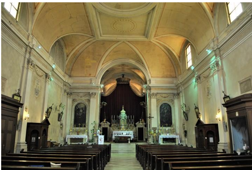
Slika 6. Unutrašnjost crkve sv. Franje

Majke Božje , uljana slika na drvu izrađena u bizantinskom stilu. Slika potječe iz XII. Stoljeća, a autor je nepoznat. Što se tiče crkve, ona je posvećena sv. Franji Asiškom i predstavlja prostranu baroknu građevinu (sl. 6). Iza glavnog oltara nalazi se polukružni kor za redovnike. Crkvene orgulje potječu iz 1882., a njihov autor je Eduard Kunad iz Ljubljane. Na lijevoj strani, pored glavnog oltara, nalazi se ulaz u samostan i sakristiju, a na desnoj strani je ulaz u kapelu Bezgrešnog Začeca. U sakristiji se nalazi mramorni kip Svetog Jeronima iz XVII. stoljeća, izrađen u baroknom stilu. U crkvenoj lađi nalaze se dva oltara, od kojih je jedan posvećen sv. Petru iz Alcantare, a drugi Raspeću Isusovu. Oltarna slika naslovljena Majka Božja sa svecima potječe iz XVI. stoljeća, a autor je Giuseppe Ventura. Djelo prikazuje Bezgrešnu Gospu kojoj se klanjaju sv. Petar Alcantara i sv. Antun Padovanski. S desne strane na oltaru nalazi se Raspeti Isus sa svecima . Slika prikazuje sv. Franju, sv. Diega i sv. Bernardina podno Isusovog križa. Mogući autor je Palma Mlađi. Ispred ulaza u crkvu nalazi se kameni križ, posvećen župskim misijama održanim 1801. 21