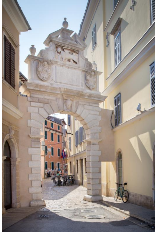
Slika 8. Balbijevo luk