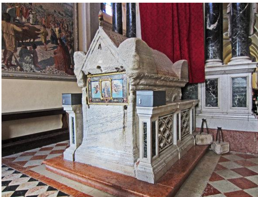
Slika 4. Sarkofag s tijelom sv. Eufemije

lavovi razderali. Međutim, lavovi je nisu napali, već su se od nje okrenuli. Prema nekim predajama je svetica umrla od ugriza jednog lava, a prema drugim verzijama umrla je od krvnikova mača. Datumom Eufemijinog mučeništva smatra se 16. rujna 304. godine nakon Krista. Njezino tijelo pokopano je u Kalcedonu, a na njezinom je grobu nakon Milanskog edikta 313. godine sagrađena crkva. Kult svete Eufemije proširilo se u Europi, sve do Hrvatske. O tome svjedoči prikaz svete u trijumfalnom luku Eufrazijeve bazilike iz ranog VI. stoljeća. Nakon perzijskog osvajanja, sarkofag s ostacima svete Eufemije prenesen je iz Kalcedona u Carigrad. Kršćani su 800. godine sarkofag odnijeli iz Carigrada jer je tamo tada vladao car Nicefor koji se protivio štovanju svete. Prema predaji je sarkofag jedne olujne noći tajanstveno nestao iz grada. Na taj način nastaje legenda prema kojoj je sarkofag doplovio do Rovinja i od tada ostaje sačuvan u crkvi svete Eufemije, postajući simbolom Rovinja, zajedno s legendom 13 (sl. 4).