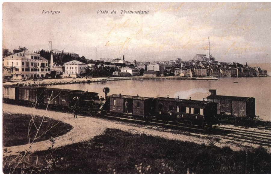
Slika 3. Željeznička pruga Rovinj-Kanfanar

Hrvatske u okviru države Jugoslavije, sve do ostamostaljenja Republike Hrvatske 1991. 9