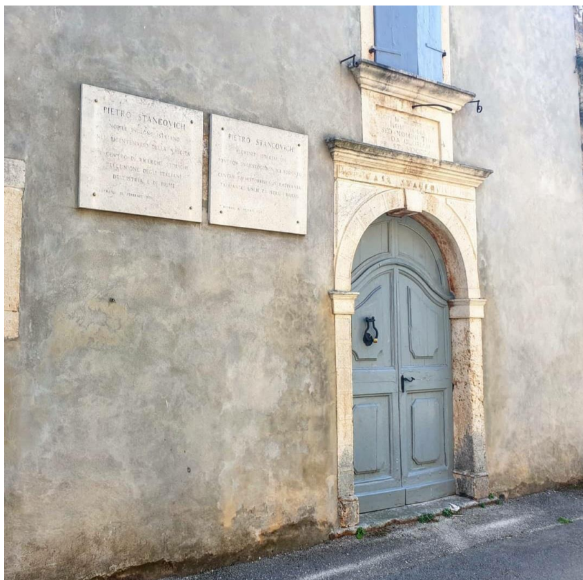
Slika 8. Kuća Petra Stankovića u Barbanu