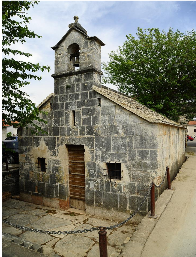
Slika 3. Crkva sv. Antona Pustinjaka, Barban

na zidovima i na stropu vide se prizori iz života sv. Antuna Pustinjaka. Crkva sadrži mnogo grafita, a najstariji je iz 1429., pisan glagoljicom.“ 9