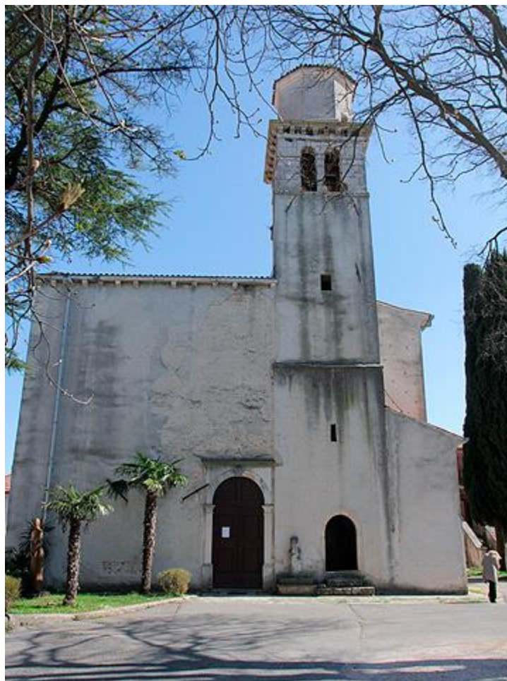
Slika 1. Crkva sv. Nikole, Barban