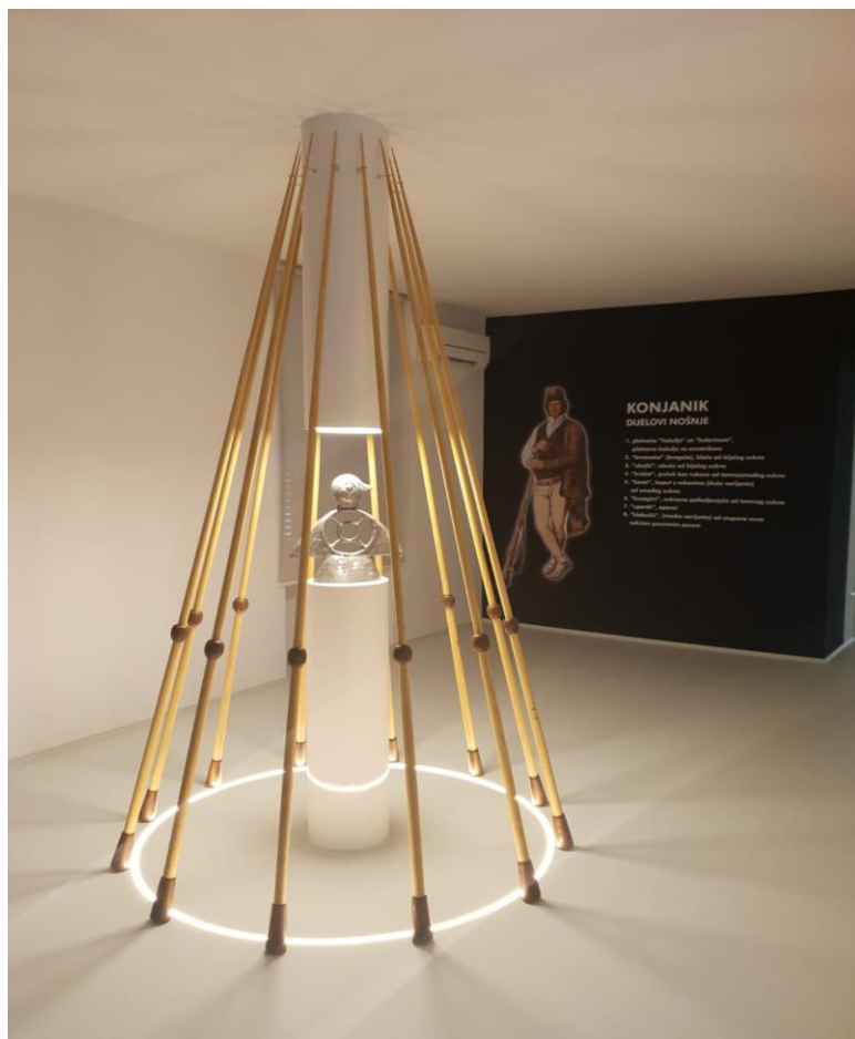
Slika 12. Multimedijalni Centar Barban

Prostor je podijeljen u nekoliko dijelova od kojih se najviše istaknuo dugačak hodnik koji podsjeća na trkaću stazu strukturiranu prstenovima, koji je dodatno popraćen zvučnim i svjetlosnim efektima (sl. 13) te je na taj način stvorena dodatna napetost konjanika pri gađanju prstenca. U drugim dvoranama prezentira se Trka kroz samu povijest, njezini slavodobitnici, vitica i koplja, tradicionalna narodna nošnja, a prikazuju se i raznovrsni kratki edukativni filmovi snimani u posebnim tehnikama kao što je 3D mapping . Osim navedenog, posjetitelji imaju mogućnost iskusiti virtualnu stvarnost, odnosno staviti na glavu 3D naočale, primiti koplje u ruke te iskušati se u gađanju prstenca.