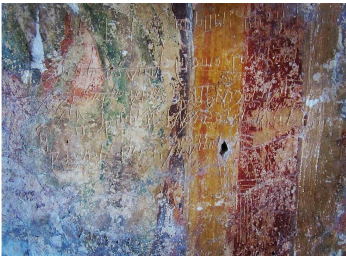
Slika 5. Glagoljski grafit

„Barban je bila jedna od župa u Istri u kojoj je postojala živa glagoljaška tradicija, a to može potvrditi izrazito hrvatsko etničko obilježje još od vremena prvog doseljenja. Najstariji glagoljički grafit potječe iz 1429.“ 11 Iz grafita navodi se povijest malih, običnih ljudi, povijest ljudske svakodnevice. Nadalje, glagoljaši se pritom lakše hvataju pisarskog alata u trenucima kada su potišteni osobnim brigama, pri čemu brojni glagoljaši bilježe svoje tjeskobe, prouzročene upravo ratnim nevoljama, gladi, epidemijama i elementarnim nepogodama. Većina njih nije znala pisati pa je tako svatko svoju želju, misao i predodžbu izrazio crtežima.