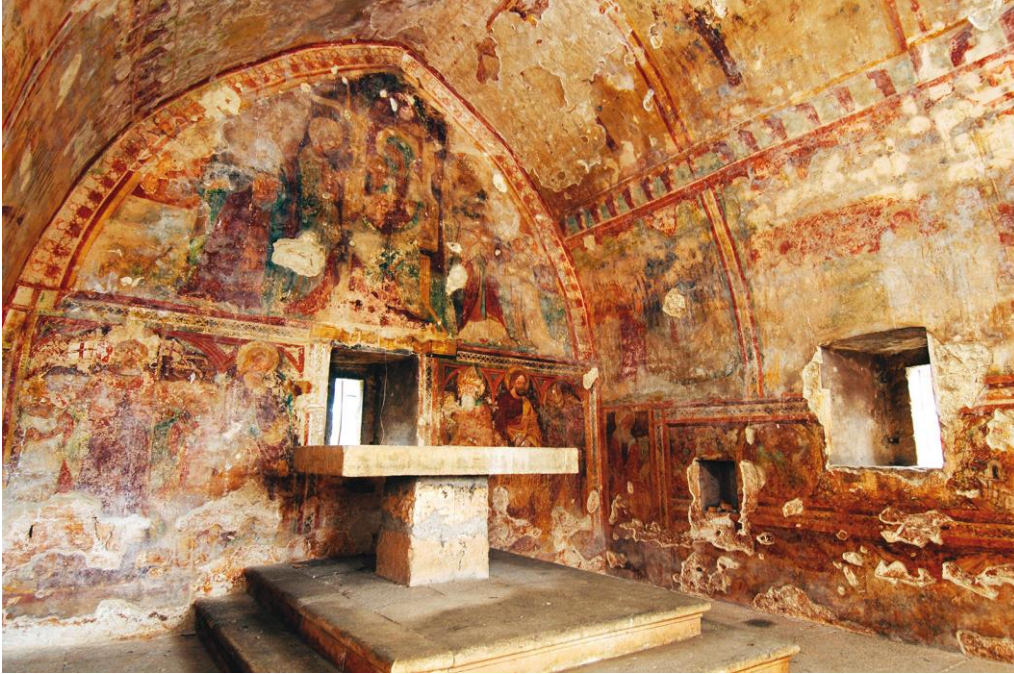
Slika 4. Freske u crkvi sv. Antuna Pustinjaka

se na gornjem dijelu istočnog zida, a prikazuje Bogorodicu s Djetetom, na trećentističkom prijestolju, okruženu svecima i donatorom, barbanskim kanonikom, koji kleči s desne strane.“ 10