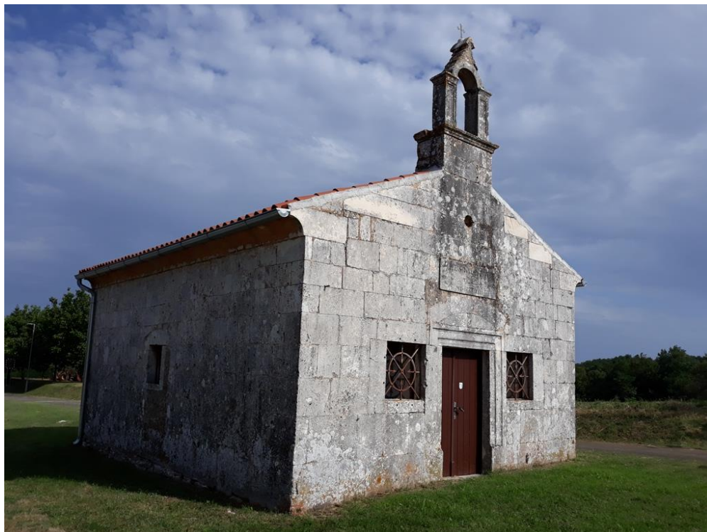
Slika 6. Crkva Majke Božje od Oranice, Barban

„od oranice“ nije se prevodio ni u dokumentima na latinskom jeziku pa se danas koristi izraz „na ravnici“. Također, crkva se spominje i pod nazivom Gospe Karmelske, kada je na njezinu svetkovinu, 16. srpnja, iz župne crkve polazila procesija te se tamo održala misa u čast Gospe od Karmela.“ 12