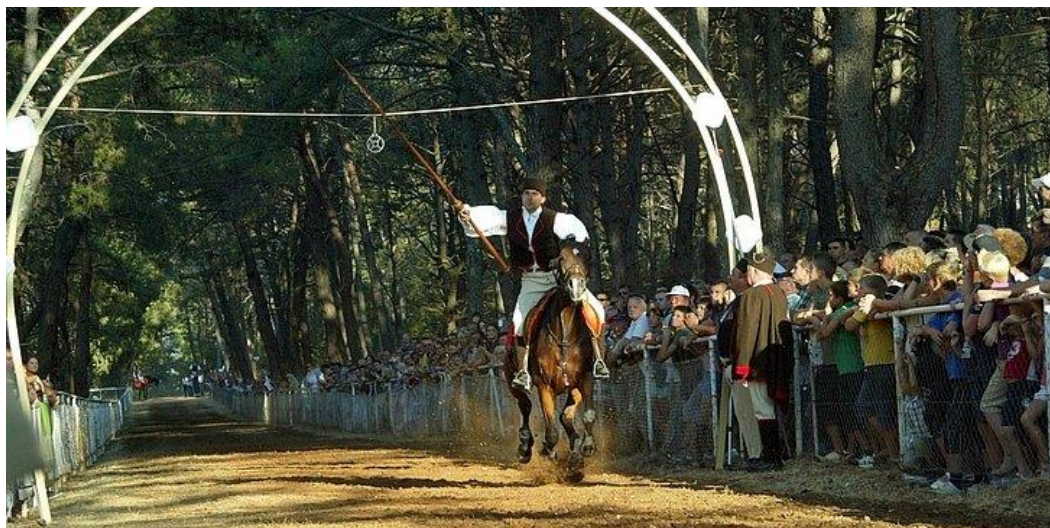
Slika 10. Trka na prstenac, Barban