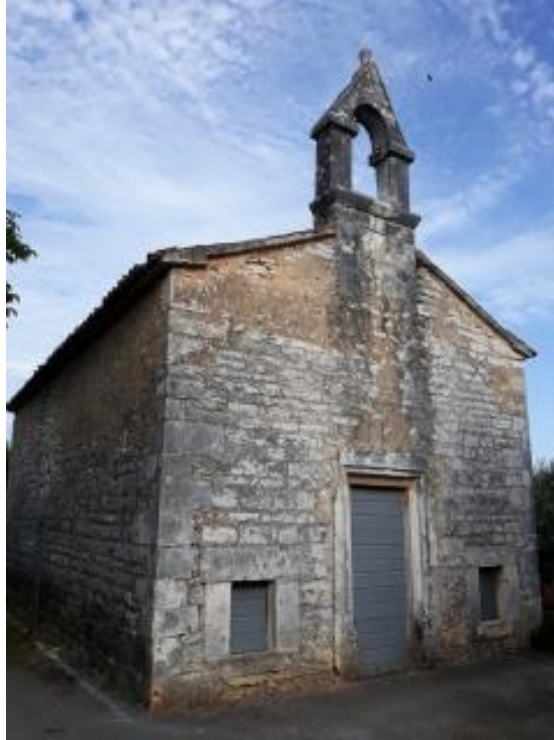
Slika 2. Crkva sv. Jakova, Barban

nakon smrti odnijeli tijelo na ukop u Španjolsku. Njemu u čast nastalo je veliko svetište sv. Jakova u Camposteli.“ 8