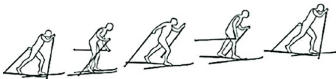
Slika 6. Dvotaktni dijagonalni korak

Osnovni korak i korak koji se najčešće koristi u različitim okolnostima na stazi jest upravo dvotaktni dijagonalni korak. Vrlo je učinkovit na ravnom terenu ili laganom usponu, na slaboj ili srednjoj brzini klizne podloge. Ciklus kretanja čine dva odraza sa suprotnim ekstremitetima - ruka i noga. U jednom ciklusu, dužina kretanja, odnosno klizanja skiji je od tri do osam metara, a vrijeme trajanja ciklusa je od jedne do dvije sekunde.