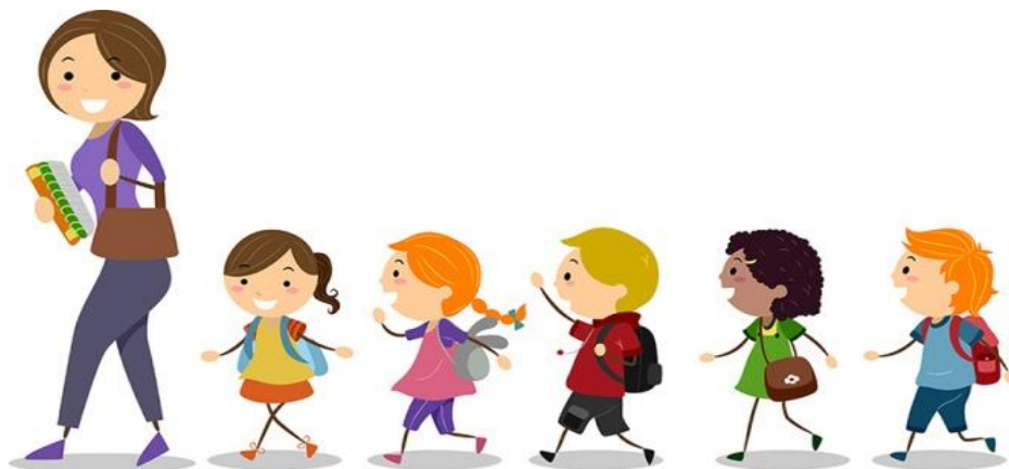
Slika 9. Šetnja

Svrha je šetnje kao kineziološke aktivnosti omogućiti djeci organizirani boravak i kretanje na svježem zraku, u unaprijed određenoj postavi, pri čemu djeca umjereno aktiviraju lokomotorni, dišni i krvožilni sustav. U dječjim vrtićima koji nemaju dvorišta, vanjska dječja igrališta ili druge otvorene prostore za igru, šetnja je osobito bitna organizacijska kineziološka aktivnost (Petrić, 2019).