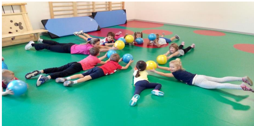
Slika 5. Opće pripremne vježbe s loptom

Odgojitelj na početku pripremnog dijela aktivnosti prvo daje uputu djeci da stanu u određenu postavu; u slobodnu postavu, vrste s međuprostorom, polukrug, krug, ili im kaže da stanu svaki na svoju točku koje je on postavio ranije (npr. samoljepljivom trakom u boji). Kada se za opće pripremne vježbe koriste pomagala, odgojitelj mora prije zauzimanja određene postave organizirati da djeca što jednostavnije (bez guranja) uzmu pomagalo za vježbanje i stanu na odgovarajuće mjesto na vježbalištu.