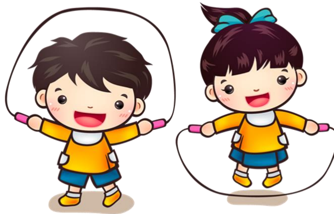
Slika 1. Tjelesna aktivnost-preskakanje vijače

predškolske dobi kreće se veći dio dana te na taj način potiče rast i razvoj. To je vrijeme kada dijete uči i stabilizira hod, počinje trčati, skakati, penjati se. Prirodne potrebe djeteta za kretanjem treba zadovoljiti, ali i njima rukovoditi.