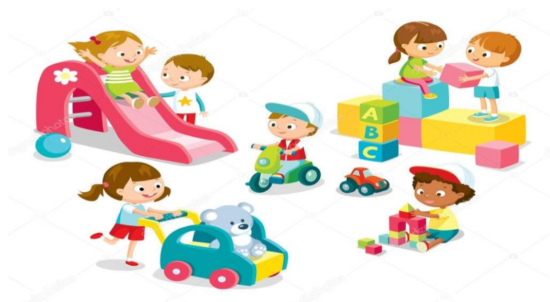
Slika 8. Poticajno tjelesno okruženje

Mala djeca uče radeći, a "aktivna igra" uključuje strukturirane i nestrukturirane aktivnosti. Djeca predškolske dobi (do 5 godina) najbolje uče kada nema "podučavanja" vještina izravno jer se kognitivno bore s pravilima. Za mlađu djecu strukturirana igra znači pružanje bogatog poticajnog okruženja kako u zatvorenom tako i vani. Svrha je poticajnog tjelesnog vježbanja zadovoljavanje osnovne (biološke) potrebe djece za kretanjem koje je potaknuto ponajviše prostornim okruženjem (Petrić, 2019). Poticajni unutarnji prostor pruža različite vrste loptica, čunjeva, preskakanja užeta, obruča, greda niske ravnoteže, mekih i tvrdih površina te malih penjačkih konstrukcija. Za djecu predškolskog uzrasta nije bitno da bacaju loptu pravilnim pokretima ruke i tijela. Umjesto toga, važno je da su sigurni u bacanje i kotrljanje lopti na razne načine: na kratke i velike daljine, u kantu za smeće, preko police za knjige, preko poda (Clark, 2014).