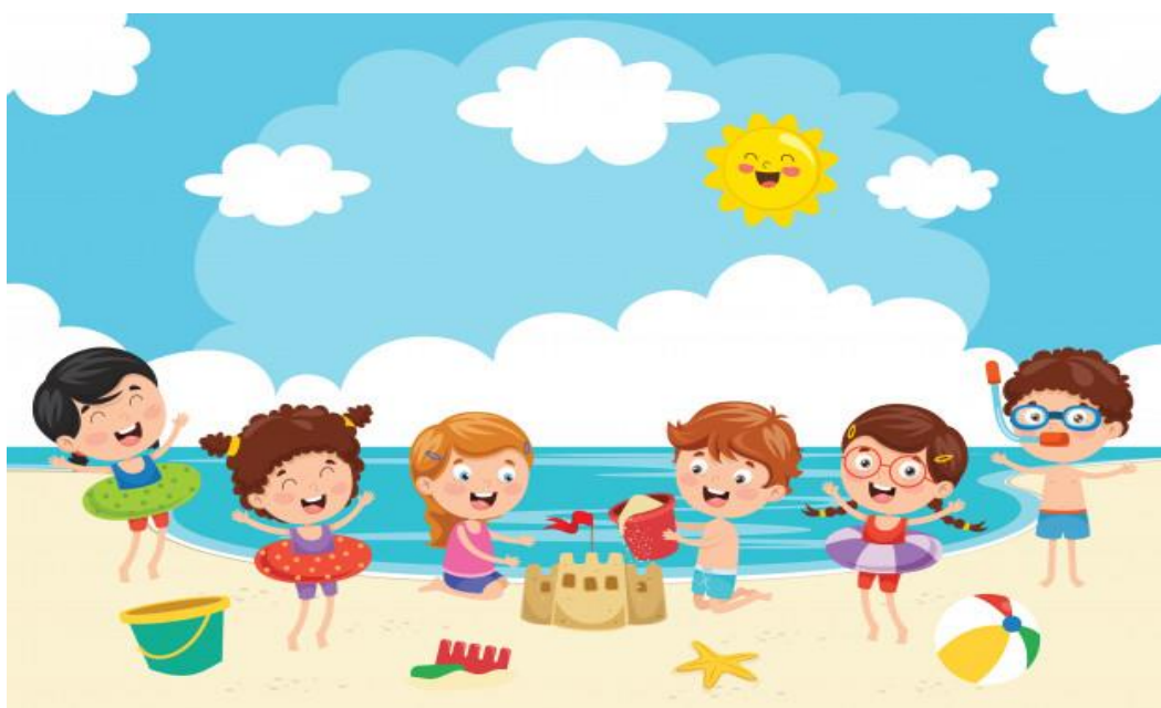
Slika 12. Ljetovanje

Svrha je ljetovanja kao kineziološke aktivnosti omogućiti djeci realizaciju različitih odgojno-obrazovnih kinezioloških sadržaja koji se mogu provoditi ljeti. Ljetovanja se mogu definirati kao organizirani višednevni boravak u prirodi ljeti, najčešće na mjestima uz more ili uz neke druge vodene površine (Petrić, 2019).