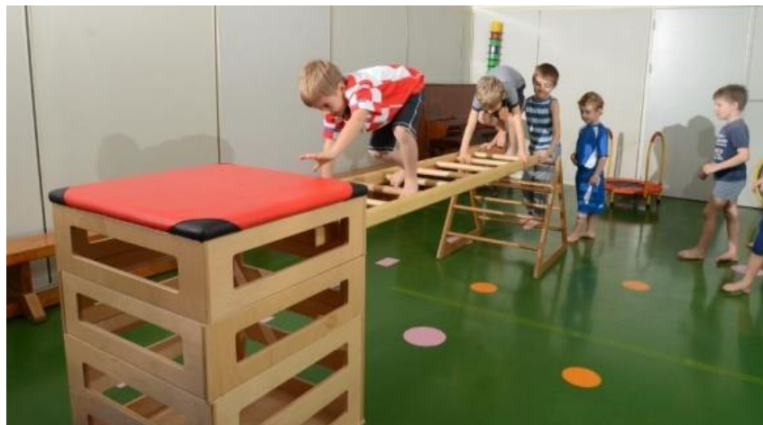
Slika 6. Realizacija motoričkih sadržaja iz cjeline (prelaženje prepreke)

Glavni „A“ dio je namijenjen poučavanju motoričkih znanja, dok je glavni „B“ u funkciji situacijskog usavršavanja istih. Autor Vilko Petrić (2019:14) ističe da su: „ sadržaji glavnog „A“ dijela aktivnosti tjelesnog odgoja proizlaze iz cjelina koje se mogu svrstati u četiri domene; svladavanje prostora, svladavanje prepreka, svladavanje otpora i svladavanje baratanja predmetima “.