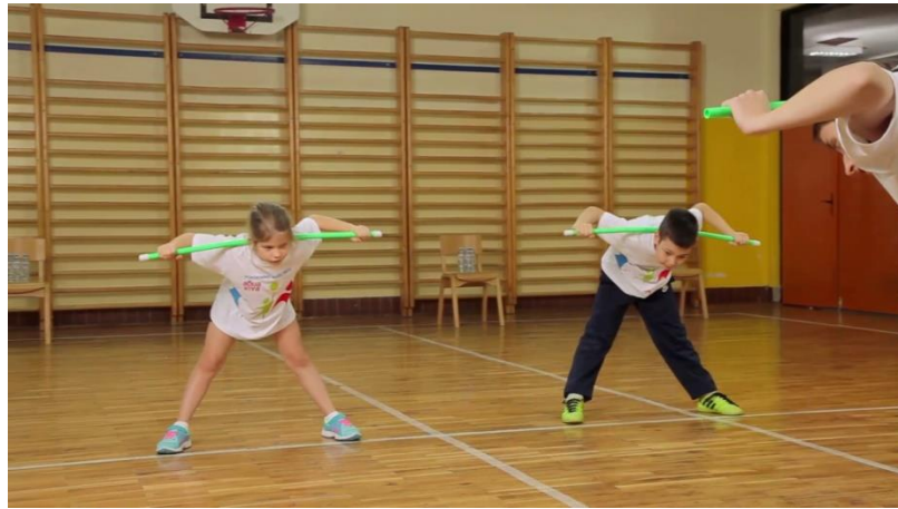
Slika 4. Opće pripremne vježba s palicom

Redosljed vježbi u pravilu određuju dijelovi tijela (vrat, ruke i rameni pojas, trup, zdjelični pojas i noge), te je najbitnije da budu obuhvaćeni svi dijelovi tijela. Opće pripremne vježbe mogu se provoditi u mjestu i kretanju, i to bez pomagala i s pomagalima.