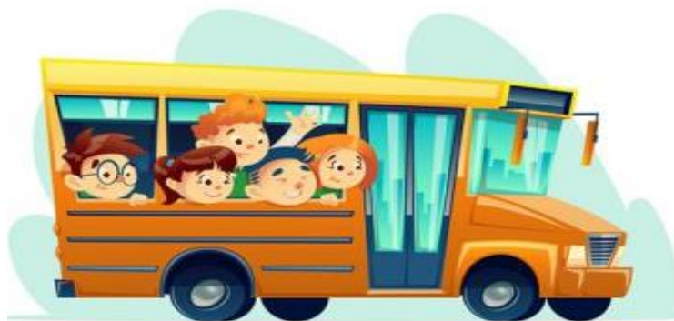
Slika 10. Izlet

Svrha je izleta kao kineziološke aktivnosti upoznavanje djece s određenim sportskim, kulturnim, prirodnim i ostalim vrijednostima s kojima se mogu susresti u bližoj ili daljoj okolini (Petrić, 2016). Izlet karakterizira njegova tema (cilj) i naglašena edukacijska komponenta koja pruža veliku mogućnost integriranja gotovo svih područja u odgojno-obrazovnom sustavu. Izleti mogu biti poludnevni, cjelodnevni i višednevni (Petrić, 2019).