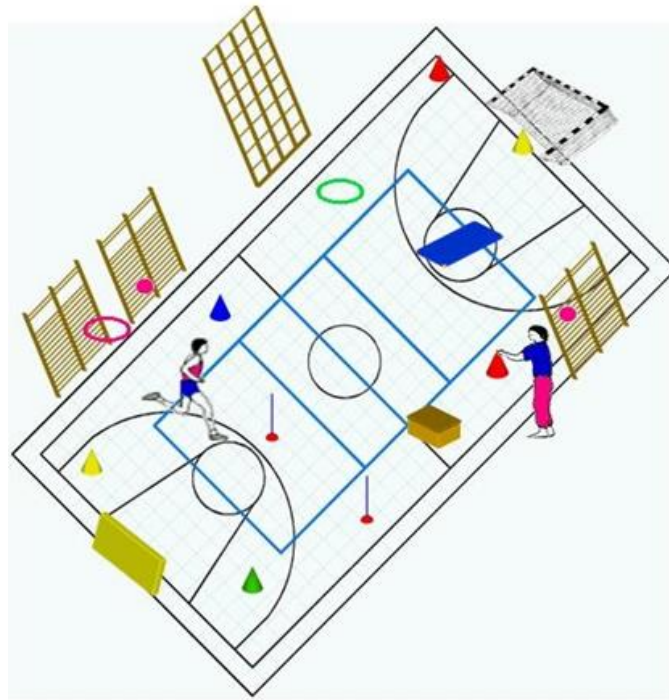
Slika 3. Igra „pronađi boju“

Primjerice igra „Pronađi boju“: djeca slobodno trče po dvorani tako dugo dok na znak voditelja ne dobiju zadatak da pronađu određenu boju u dvorani (pronađite mi crvenu boju). Na postavljeni zadatak djeca se rastrče i dotiču jednim prstom sve što je u dvorani te boje.