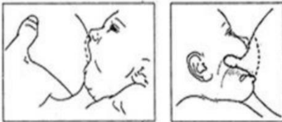
Slika 3. Pravilno stavljena bradavica u djetetovim ustima

Medicinska sestra treba biti podrška majci za vrijeme dojenja sve dok majka ne procijeni da može sama podojiti dijete. Kao pomoć, medicinska sestra majci daje pisana pravila o tehnikama dojenja i optimalnom položaju kako bi ih što ranije savladala. Majku također educira o važnosti i prednostima dojenja, potiče je dojenju na zahtjev djeteta te o osobnoj higijeni.