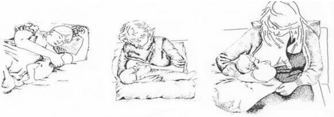
Slika 2. Pravilno stavljena bradavica u djetetovim ustima