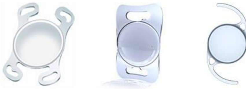
Slika 3. Različiti oblici IOL-a

Materijal i dizajn za intraokularne leće se konstantno razvija i poboljšava. Poboljšanja su usmjerena na bolju korekciju loma postoperativno i mogućnost manje veličine reza. Razvijeni su različiti materijali za intraokularne leće, koji se međusobno razlikuju po sadržaju vode, refraktnom indeksu i čvrstoći vlakana. [15]