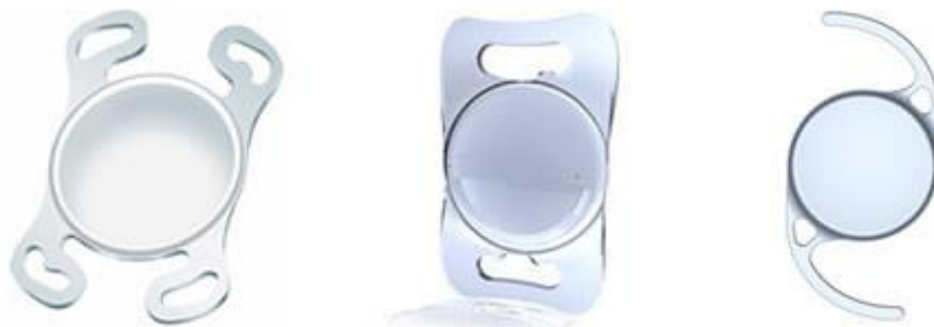
Slika 3. Različiti oblici IOL-a

Materijal i dizajn za intraokularne leće se konstantno razvija i poboljšava. Poboljšanja su usmjerena na bolju korekciju loma postoperativno i mogućnost manje veličine reza. Razvijeni su različiti materijali za intraokularne leće, koji se međusobno razlikuju po sadržaju vode, refraktnom indeksu i čvrstoći vlakana. [15]