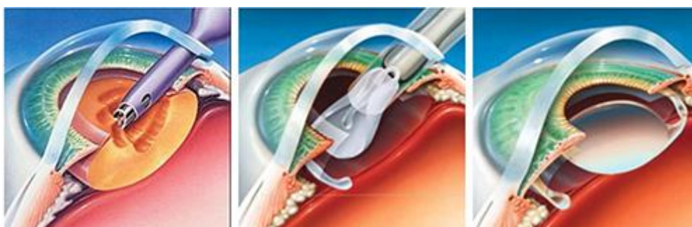
Slika 1. Prikaz fakoemulzifikacije – 1) usitnjavanje i ekstrahiranje leće 2) primjena IOL-a 3) IOL-a nakon insercije

Prvo i najvažnije za uspješno izvođenje operacije je vještina kirurga i vrsta zahvata s kojim kirurg ima najviše iskustva i sigurnosti. Općenito, vrsta operacije ovisi o tvrdoći nuklearne komponente katarakte (sve su kortikalne mreke mekane). Većina kirurga vrši fakoemulzifikaciju ECCE (extracapsular cataract extraction) na gotovo svim mrenama. [10]