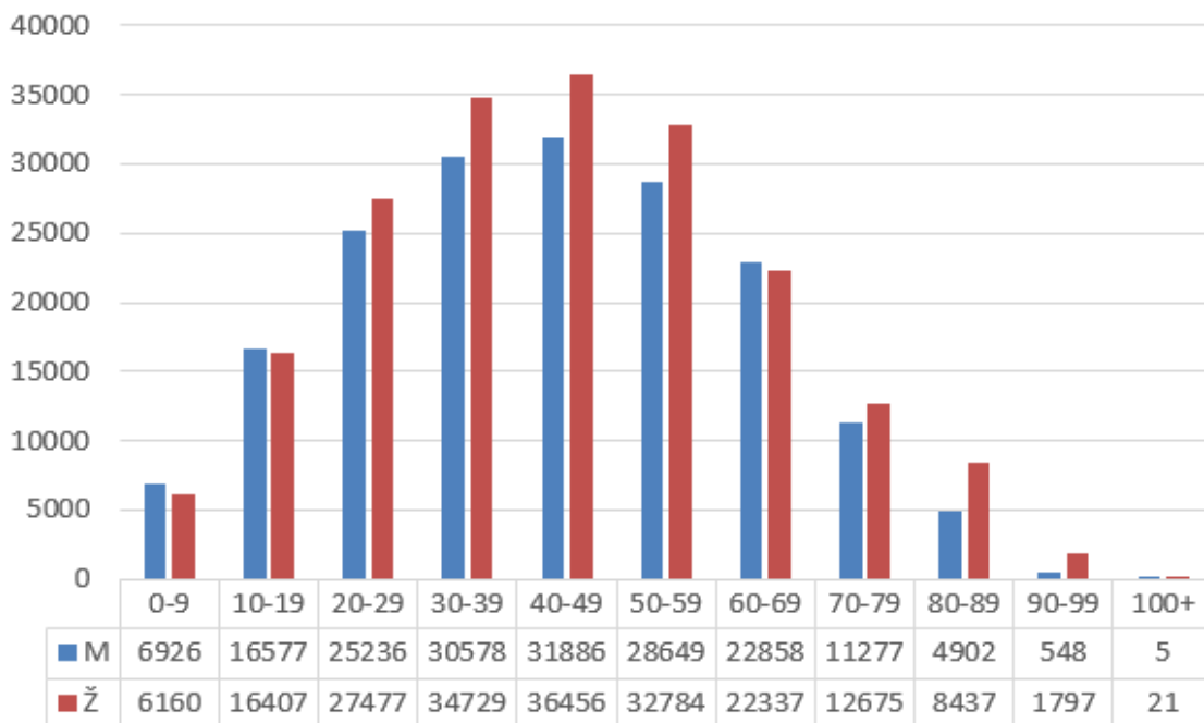
Grafikon 1. Raspodjela pozitivnih osoba po spolu i dobi