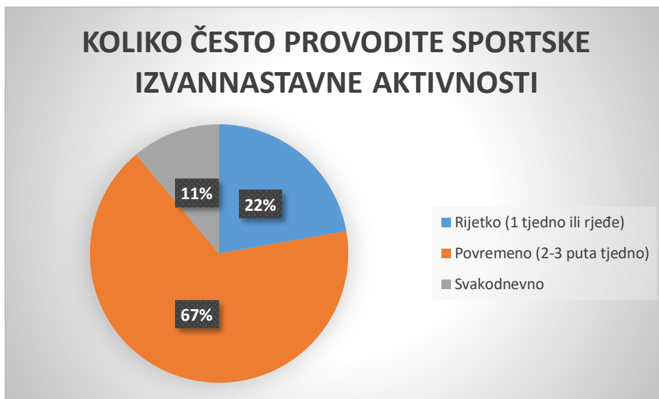
Grafikon 7. Koliko često se provode sportske izvannastavne aktivnosti

Iz tablice i grafikona možemo iščitati da se u dvije škole, što čini 22%, na području Grada Pule sportske izvannastavne aktivnosti provode jednom tjedno ili rjeđe. Povremeno (dva do tri puta tjedno) ih provodi 6 škola (67%), a svakodnevno samo jedna škola (11%). Iz ovih rezultata možemo zaključiti da se ipak u većini škola sportske izvannastavne aktivnosti provode 2 do 3 puta na tjedan što je vrlo važno da djeca usvoje naviku redovnog tjelesnog vježbanja. Školama u kojima se ne provode često sportske izvannastavne aktivnosti važno je napomenuti kako bi trebali povećati svoju satnicu upravo u tim izvannastavnim aktivnostima.