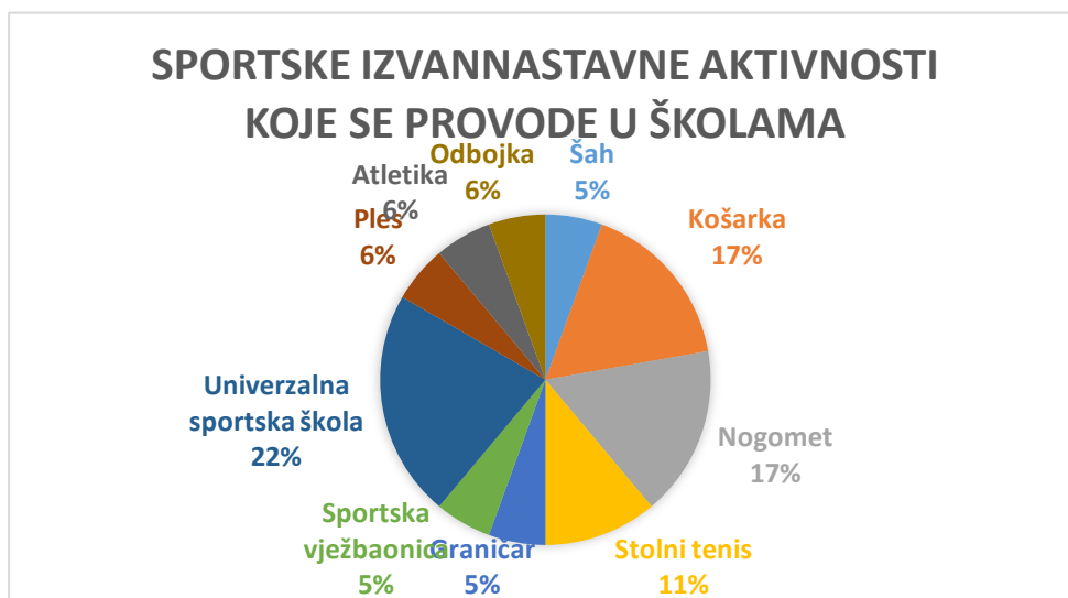
Grafikon 4. Prikaz izvannastavnih sportskih aktivnosti koje se provode u školama u postotcima