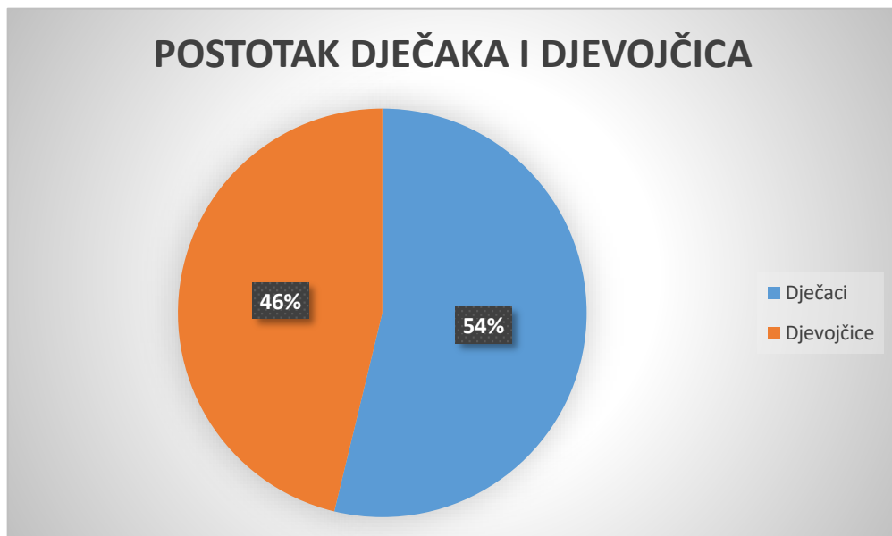
Grafikon 5. Postotak djevojčica i dječaka uključenih u sportske izvannastavne aktivnosti

U sljedećem je grafikonu (Grafikon 5.) prikazan odnos djevojčica i dječaka po postotku u kojem pohađaju sportske izvannastavne aktivnosti.