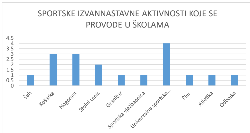
Grafikon 3. Prikaz sportskih izvannastavnih aktivnosti koje se provode u školama

Rezultati su prikazani u sljedeća dva grafikona ( Grafikon 3 i 4 ).