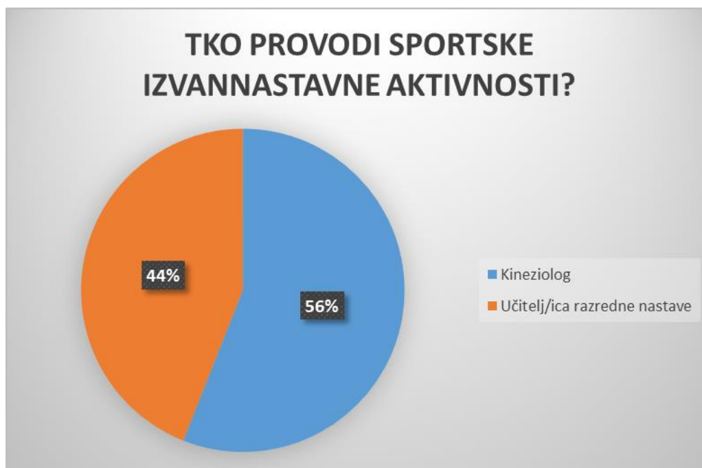
Grafikon 6. Tko provodi sportske izvannastavne aktivnosti

provode sportske aktivnosti kineziolog provodi sportske aktivnosti u 5 škola (56%), a u preostale 4 provodi ih učitelj/ica razredne nastave (44%) ( Grafikon 6. ).