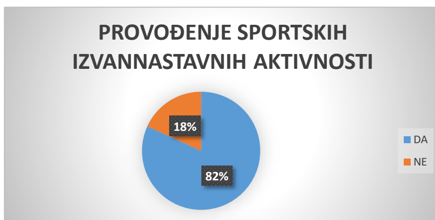
Grafikon 3. Provođenje sportskih izvannastavnih aktivnosti u školama

Sljedeće pitanje odnosilo se na to provode li škole sa svojim učenicima sportske izvannastavne aktivnosti. Rezultati su pokazali da od ukupno jedanaest škola koje su sudjelovale u istraživanju sportske izvannastavne aktivnosti provodi njih 9 što je ukupno 82%.