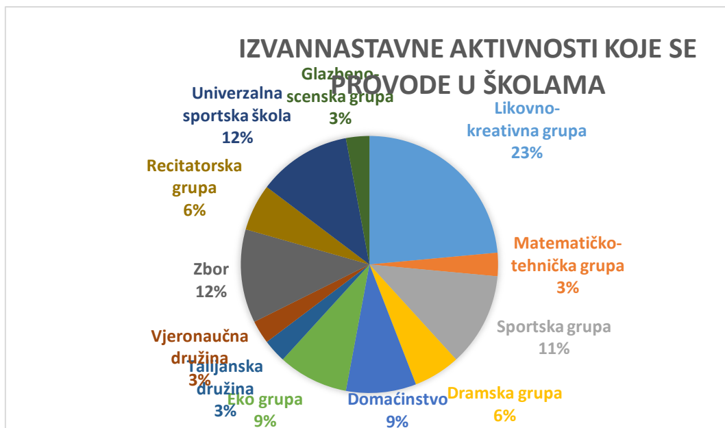
Grafikon 2. Izvannastavne aktivnosti koje se provode u školama u postotcima

Gledajući rezultate možemo zaključiti da su učenici najviše zainteresirani za likovno – kreativne aktivnosti, a slijede ih sportske aktivnosti što je jako dobro jer to znači da su učitelji kod svojih učenika osvijestili potrebu za vježbanjem i zdravim načinom života.